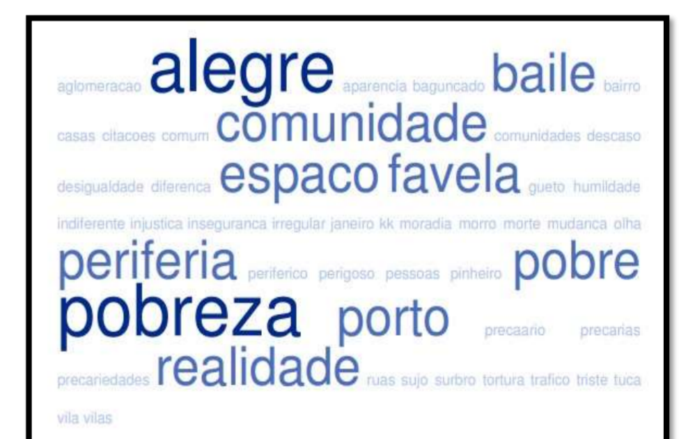
Organização: os autores (2018)