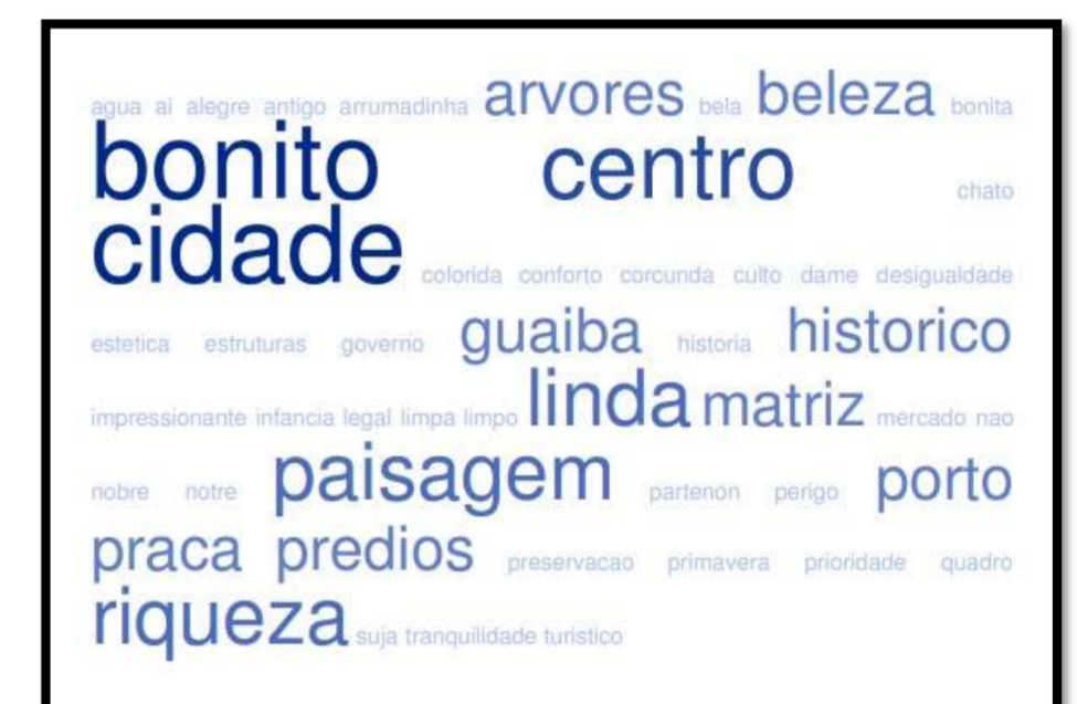
Organização: os autores (2018)