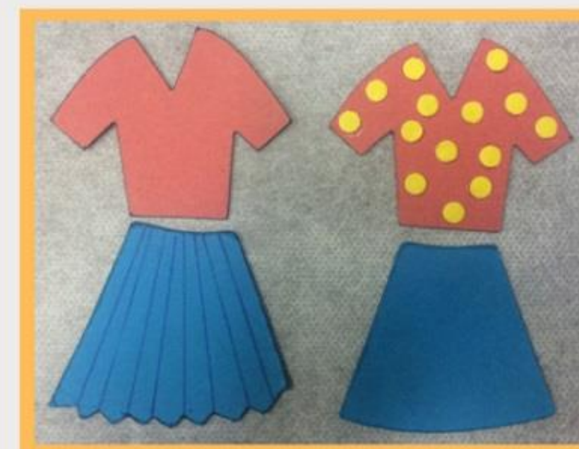
Figura 03 - Saias e blusas.