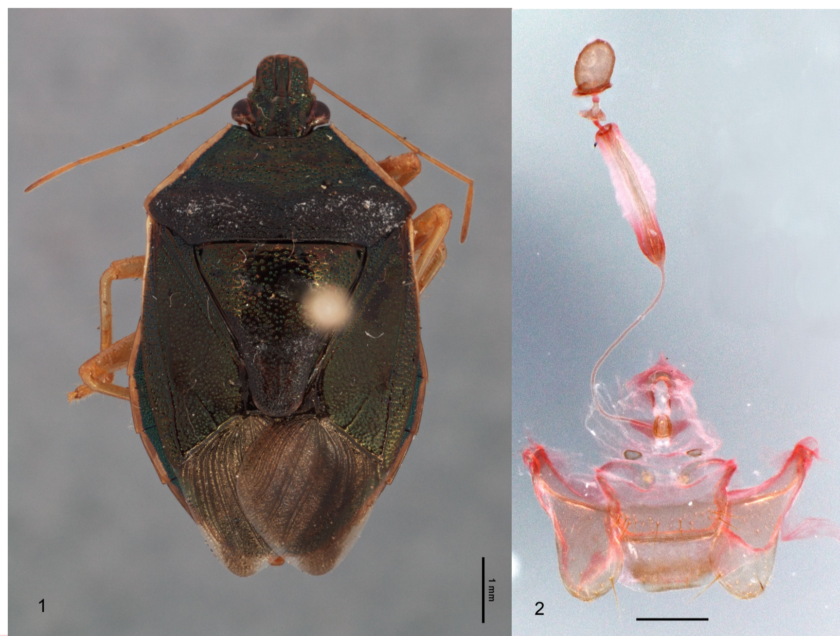
Figura [1]: Tynacantha marginata , fêmea em vista dorsal

INTRODUÇÃO: Tynacantha Dallas, 1851 é um gênero de percevejos predadores Fig.[1] que contém, atualmente, duas espécies: T. marginata Dallas, 1851, encontrada na América do Sul, e T. splendens Distant, 1889, na América Central. Elas apresentam potencial uso no controle biológico, especialmente T. marginata no Brasil (Moreira et al. 1995). Este trabalho buscou redescrever Tynacantha marginata , incluindo aspectos da morfologia geral e da genitália externa e interna tanto para machos Fig.[3.4.5.6] quanto para fêmeas Fig.[2] e poderá ser útil para o reconhecimento da espécie, atualmente pouco conhecida.