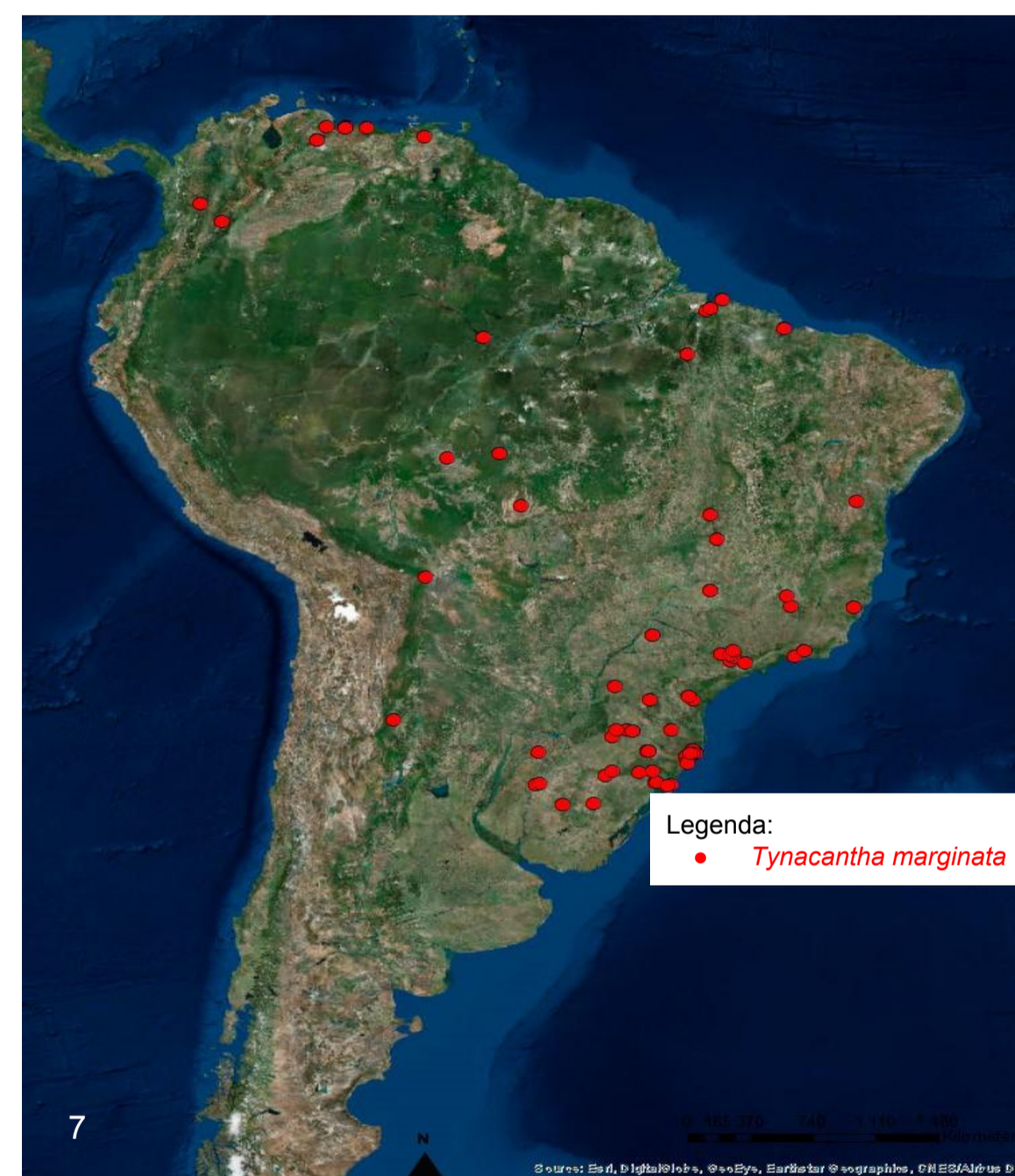
Figura [7]: Mapa de distribuição de Tynacantha marginata

MATERIAL E MÉTODOS: Os espécimes foram observados, medidos e fotografados com estereomicroscópio, sendo 17 parâmetros morfométricos utilizados. Fotografias de fêmeas e machos foram realizadas com estereomicroscópio Nikon AZ100M e o empilhamento de foco foi feito com Nikon NIS-Elements Ar Microscope Imaging Software. O mapeamento das espécies Fig. [7] foi produzido com o auxílio do software ArcGIS. Escalas das figuras: 1mm.