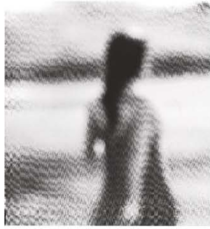
Figura 4 - Fuga, 1, 2, 3. Tríptico. Fotografia de Klaus Mitteldorf, São Paulo, Brasil. 2006. Fonte: Introvisão , Edição do autor, 2006. Figura 5 - Lu 1. Fotografia de Klaus Mitteldorf, São Paulo, Brasil. 2006. Fonte: Introvisão , Edição do autor, 2006.