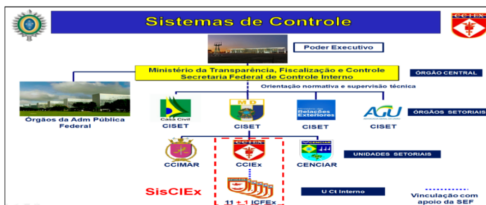
Figura 2 – Sistema de Controle Interno do Poder Executivo Federal.

Segundo o Manual de Auditoria (2013), a Secretaria Federal de Controle Interno da Controladoria Geral da União (SFC/CGU), além das funções de órgão central, acompanha todas as unidades e as entidades do Poder Executivo Federal, excetuados aqueles jurisdicionados pelos órgãos setoriais. Já a Secretaria de Controle Interno do Ministério da Defesa (CISSET/MD), além das funções de órgão setorial, acompanha as unidades e as entidades das Forças Armadas (Marinha, Exército e Aeronáutica). O Centro de Controle Interno do Exército (CCIEEx) é a unidade setorial. As Inspetorias de Contabilidade e Finanças do Exército (ICFEx), são as unidades de controle interno, atuando nas Unidades Gestoras (UG) vinculadas a sua orientação técnica. A Figura 2 apresenta o organograma do Sistema de Controle Interno do Poder Executivo Federal com seus órgãos e respectivas vinculações (BRASIL, 2013).