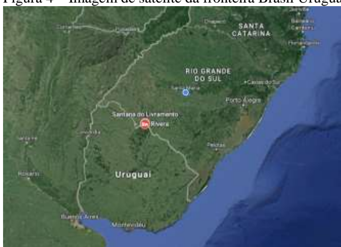
Figura 4 – Imagem de satélite da fronteira Brasil Uruguai

Abaixo a imagem de satélite (Figura 4) segue com a localização geográfica da Fronteira da Paz, evidenciando o ponto de contato entre as duas cidades. Os dois principais centros, do Uruguai e do Rio Grande do Sul, Montevideu e Porto Alegre, respectivamente, distam cerca de 500 km das cidades.