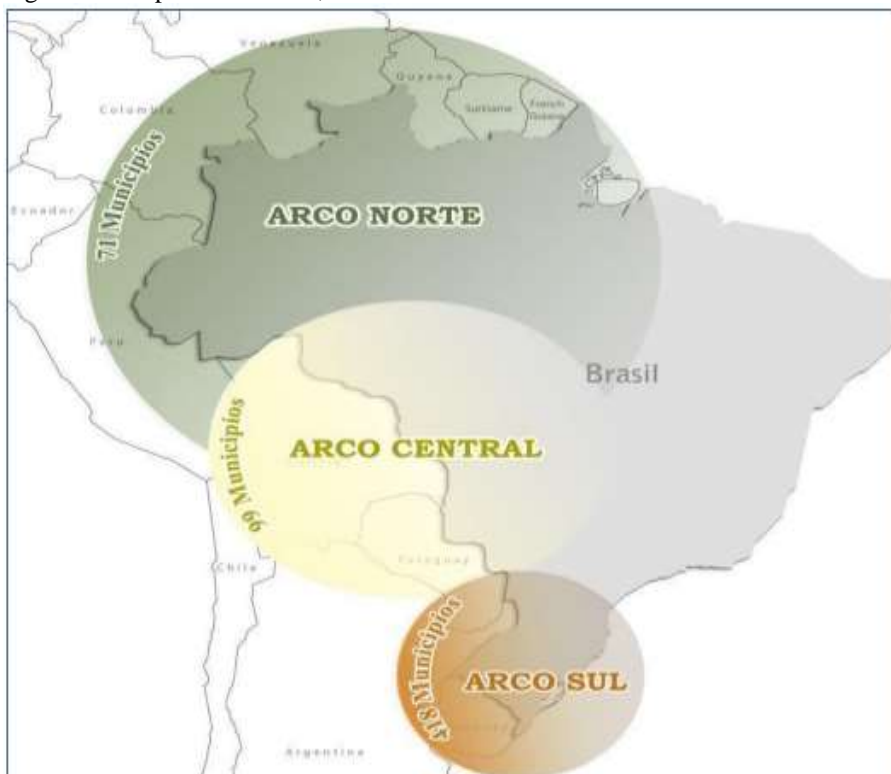
Figura 1 – Mapa Arcos Norte, Centro e Sul