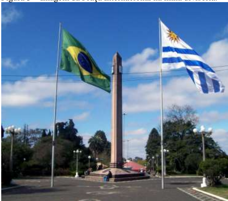
Figura 3 – Imagem da Praça Internacional na linha divisória.