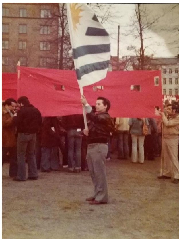
Figura 1 – Santos em ato político na Suécia, década de 1970