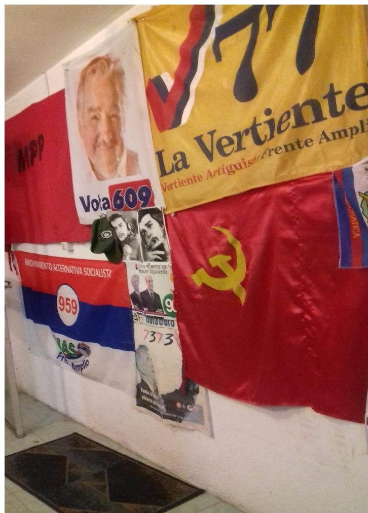
Figura 6 – Entrada do comitê de base, algumas bandeiras dos partidos que compõe o Frente Amplio – 11.02.2018

Fonte: digitalizado do acervo pessoal da autora (2018)