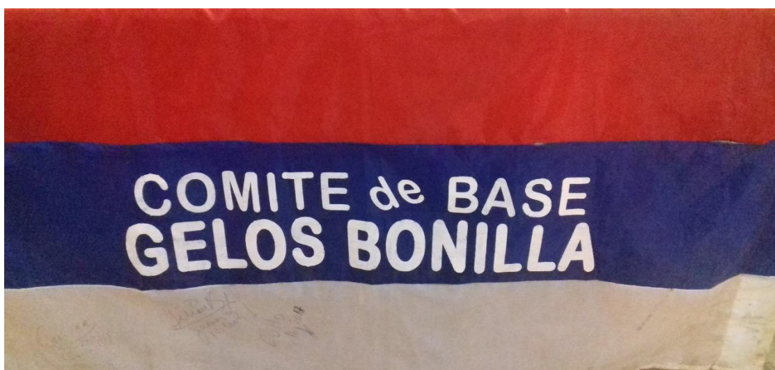
Figura 5 – Bandeira do comitê de base, no interior da sede – 11.02.2018

Fonte: digitalizado do acervo pessoal da autora (2018)