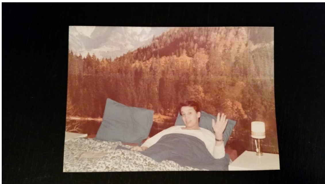
Santos no exílio em Suécia. Década de 1970