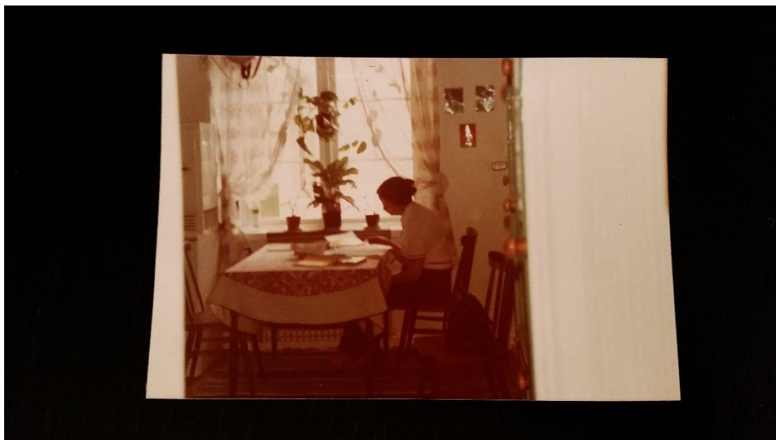
Santos no exílio em Suécia. Década de 1970