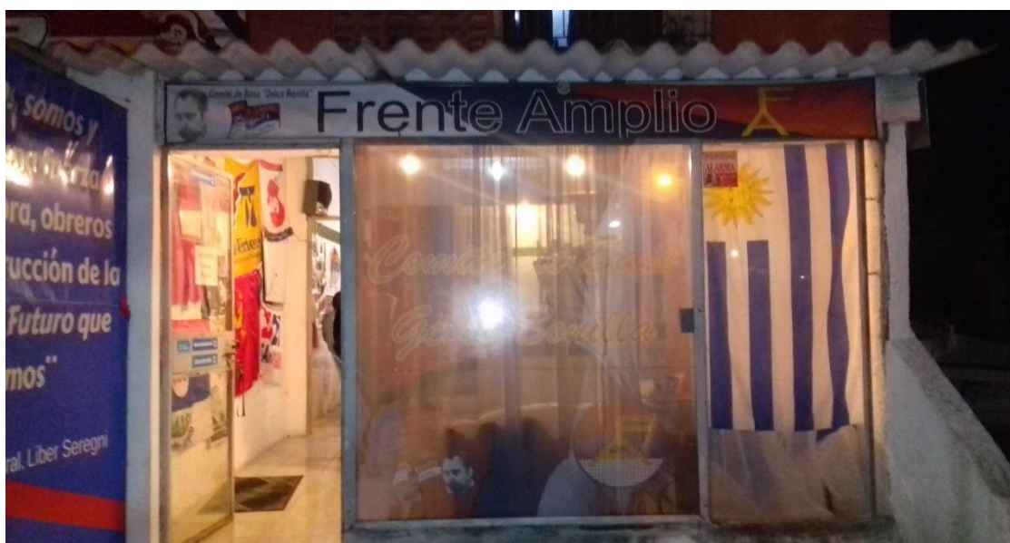
Figura 4 – Fachada da Sede Gelos Bonilla. Maldonado – 11.02.2018

Fonte: digitalizado do acervo pessoal da autora (2018)