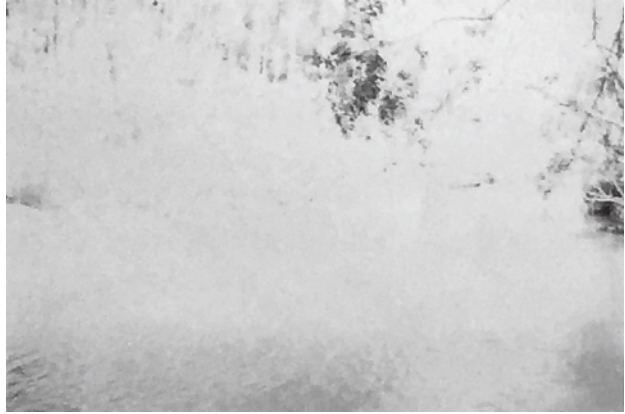
Figura 3 · Claudia Zimmer, Meia Praia — da série Cartografia do Meio , fotografia impressa em papel-jornal, 2008.