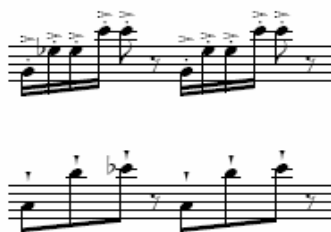
Figura 44: Ciclo IV, terceiro movimento, piano 2 [2]

Todas as variações deste motivo aparecem em forma de acorde e são compostas por todas as variações de colcheia que aparecem na música, uma vez que o material foi gerado de uma única célula vertical. A colcheia é o menor espaço que há entre uma célula e outra, com exceção do movimento de tercinas em semicolcheias, que tem a função de impulsionar para o ataque seguinte.