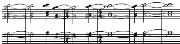
Figura 12: Ciclo I, segundo movimento [22-27] – piano 2