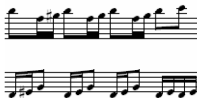
Figura 16: Abertura do II Ato – piano 1 [86]

Algumas variações do motivo principal têm como objetivo deteriorar o material original, que é distorcido no decorrer do movimento.