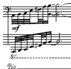
Figura 10: Ciclo 1, segundo movimento [28] – piano 2