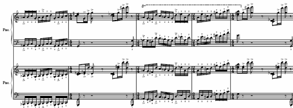
Figura 5: Ciclo IV, terceiro movimento - pianos

Os movimentos II, XIV e a abertura do segundo ato foram escritos para dois pianos desacompanhados da orquestra, flauta ou timpani . Nenhum destes movimentos é peça central de algum ciclo e é pertinente tecer algumas observações sobre eles.