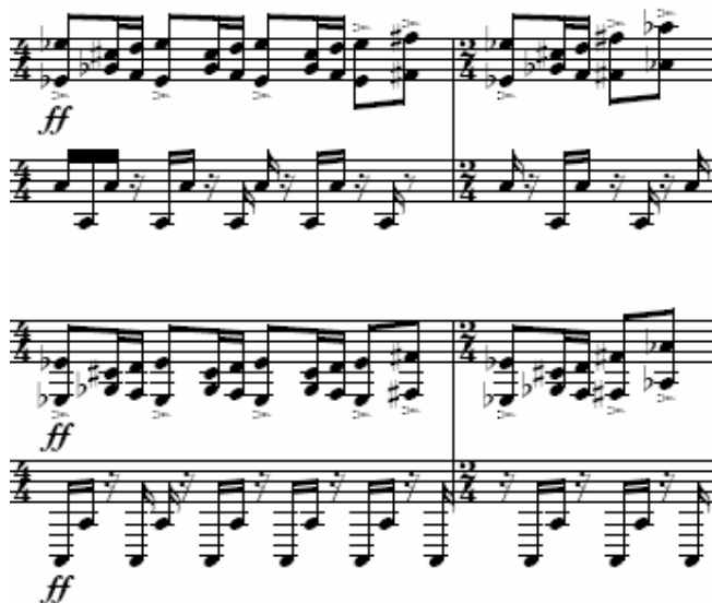
Figura 17: Abertura do II Ato [108-109]