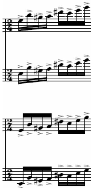
Figura 50: Ciclo IV, terceiro movimento, piano 1 e 2 [9]

A primeira seção foi construída basicamente com a alternância e a variação destes dois motivos. Durante o trabalho de composição, buscou-se o equilíbrio entre fluência e descanso no uso destes materiais, bem como o equilíbrio visual da partitura, como ponto de partida para a composição.