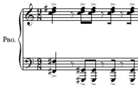
Figura 45: Ciclo IV, terceiro movimento, piano 2 [10]