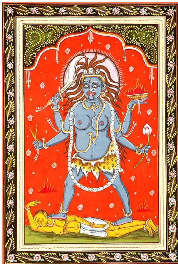
Figura 1: Tara

Neste memorial, as imagens provocam o impulso inicial para o trabalho e definem sua atmosfera e seu conteúdo expressivo. Os estímulos visuais contribuem para o cenário expressivo da composição que, ao adquirir vida própria, reinventa as imagens através de repetições, similaridades e contrastes e transforma-se em discurso imagético, sustentando e controlando o tempo na música e tendo as imagens como fonte de motivação expressiva e retórica. Outras artes constituem o universo criativo de que trata esse estudo, elas participam da construção estética da composição.