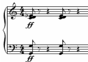
Figura 43: Ciclo IV, terceiro movimento, piano 1 [1]