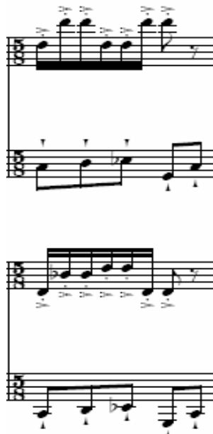
Figura 49: Ciclo IV, terceiro movimento, piano 1 e 2 [6]