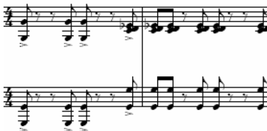
Figura 46: Ciclo IV, terceiro movimento, piano 2 [22]