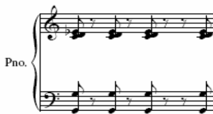
Figura 47: Ciclo IV, terceiro movimento, piano 1 [25]