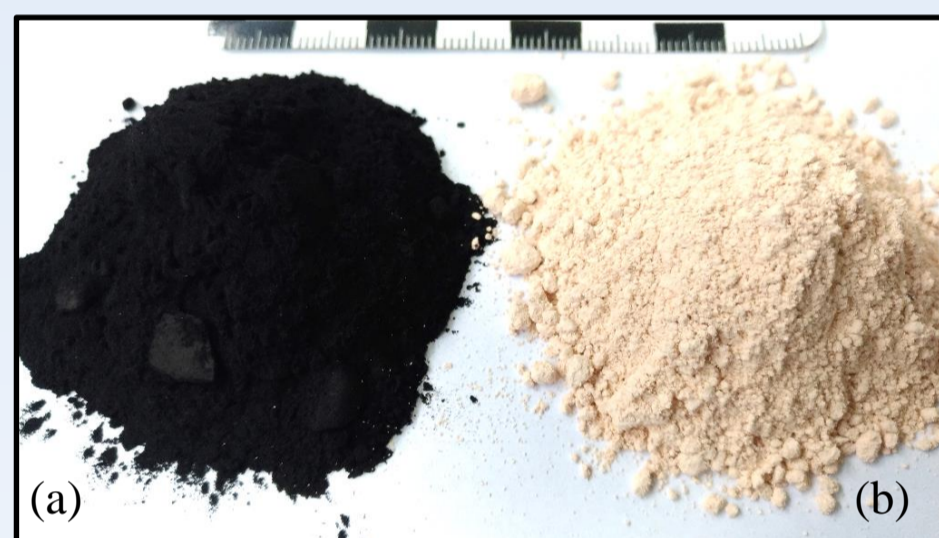
Figura 2. Amostras de carvão e de caulim, utilizados na preparação das misturas.

Tanto o sifão (Fig. 3a), quanto o UHCM (Fig. 3b) foram posicionados no fundo do béquer na direção contrária ao escoamento gerado pelo misturador.