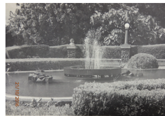
Figura 7: Registro do chafariz em funcionamento. Logo após sua criação.