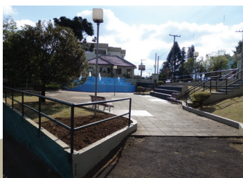
Figura 1: Registro da praça atualmente - Praça Concórdia - Ivoti

1. Levantamento: Análise das referências documentais e bibliográficas em arquivo;