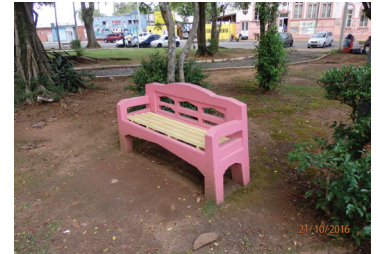
Figura 6: Exemplo de um dos bancos da praça atualmente.