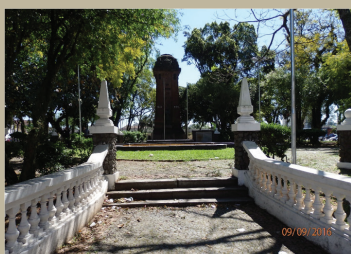
Figura 3: Entrada da praça do Imigrante atualmente.