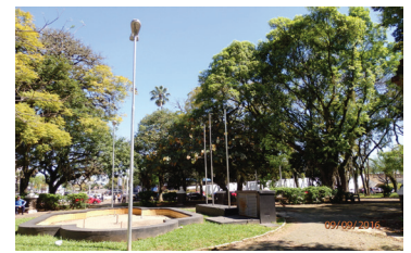
Figura 8: Registro do chafariz atualmente.

3. Desenho do espaço público levantado e de seu mobiliário urbano, para cada uma das cidades;