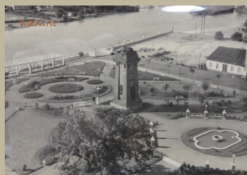
Figura 3: Praça do Imigrante em São Leopoldo antigamente. Ano da foto: 1936

2. Busca por informações que representassem a transformação desses espaços públicos e seu mobiliário ao longo do tempo, através de pesquisas em acervos e em órgãos públicos;