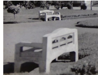
Figura 5: Registro de dois dos bancos da praça, logo após sua criação - Década de 30.

2. Busca por informações que representassem a transformação desses espaços públicos e seu mobiliário ao longo do tempo, através de pesquisas em acervos e em órgãos públicos;