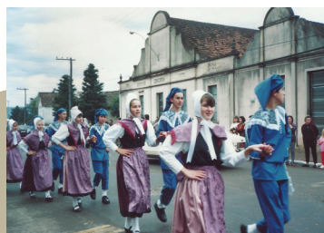
Figura 2: Registro antigo de desfile na Avenida Presidente Lucena, ao lado da Praça Concórdia.