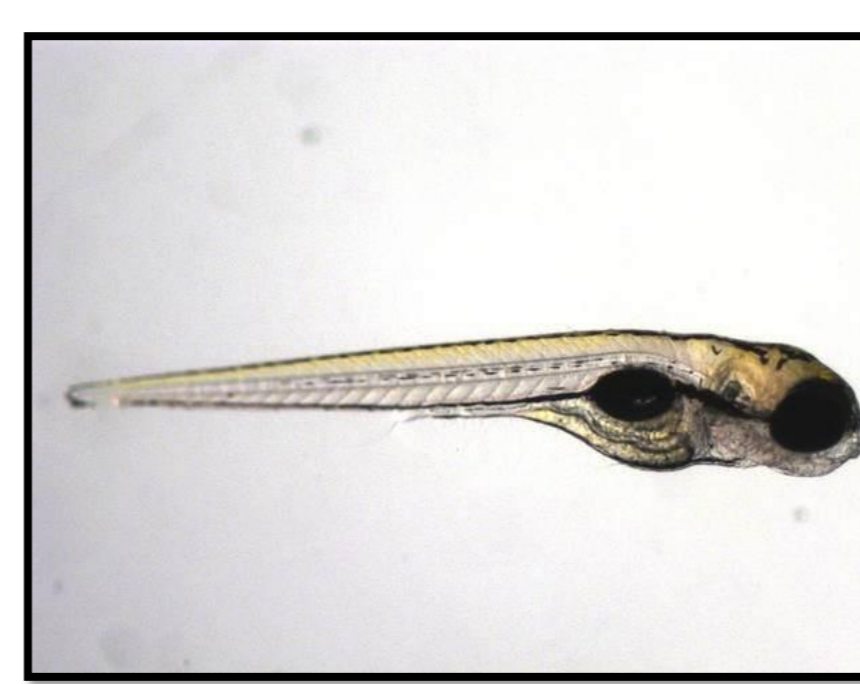
Embrião de zebrafish de 3 dpf