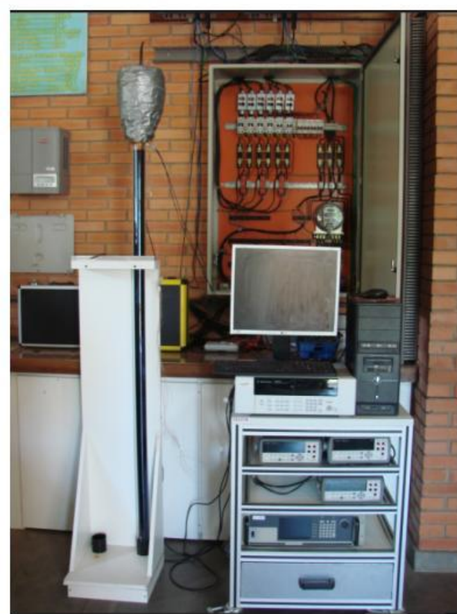
Figure 1: Visão externa do experimento

Aquecedores solares a vácuo recebem esse nome devido ao meio de isolamento que estes fazem uso. Nestes aquecedores estão presentes dois tubos concêntricos com vácuo entre eles. A absorção de calor é otimizada por meio de uma superfície seletiva e as perdas de calor são minimizadas devido ao uso do vácuo como isolante térmico, possibilitando a sua utilização mesmo em regiões de clima frio. Na parte interna dos tubos que estudamos temos inserido um tubo de calor "heat pipe", que transfere calor para a água em contato com a extremidade superior. O presente trabalho busca um estudo detalhado da consistência e dos fenômenos físicos que acontecem no interior de um tubo de calor.