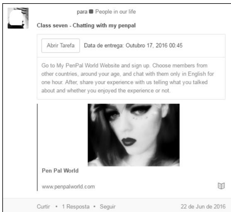
Imagem 2: Tarefa “Chatting with my penpal” da unidade didática People in your life

Conforme esses exemplos, tanto os aspectos tecnológicos quanto os aspectos didático-pedagógicos fomentados por essas unidades didáticas e suas tarefas podem nos levar a um ensino interativo, dinâmico e preocupado em relacionar as atividades cotidianas dos alunos e dos professores, visto que promovem também a praticidade e a formação de comunidades em rede entre os próprios educadores. Entretanto, é necessário sempre voltarmos a pensar na relação entre a parte técnica e a parte pedagógica, questionando como uma determinada ferramenta digital pode auxiliar e enriquecer uma proposta didática.