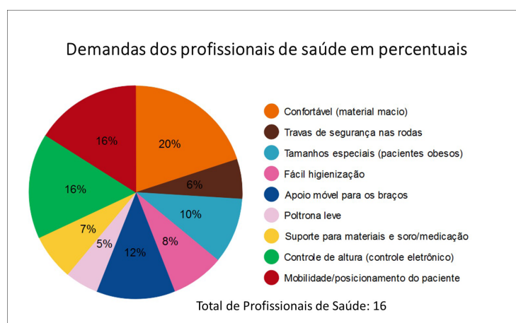
Gráfico 1: Demandas dos profissionais de saúde, em percentuais, coletadas nas entrevistas semiestruturadas. Fonte: Elaborado pelo Autor.

Nota: Todos os profissionais de saúde que participaram das entrevistas cumprem turnos de 6 horas nos setores onde trabalham, sendo essa quantidade de horas considerada como utilização do mobiliário para fornecer atendimento à pacientes. Fonte: Elaborado pelo Autor.