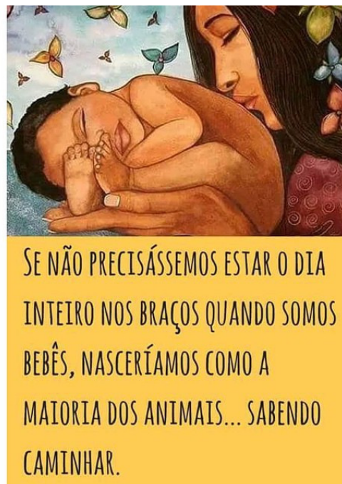
Figura 2 – Teoria da extergestação 33

A teoria da extergestação parte do pressuposto que durante a evolução humana, os homo sapiens adquiriram inteligência e conseqüentemente, um cérebro com dimensões maiores. Em decorrência, González (2015) refere que os seres humanos nascem mais cedo que os outros mamíferos, caso contrário a criança não passaria pela pélvis da mãe no momento do parto. Por nascerem imaturos, antes que seu sistema nervoso central esteja completamente amadurecido, os seres humanos demorariam então mais tempo para andar em comparação às demais espécies animais, sendo extremamente dependentes de cuidados. A teoria da extergestação propõe que o bebê continue sendo “gestado fora do útero” por sua mãe por mais nove meses, o que implica em dormir junto ao bebê, amamentá-lo em livre demanda (sempre que a criança quiser, sem horários fixos) e carregá-lo junto ao se deslocar (ver Figura 2).