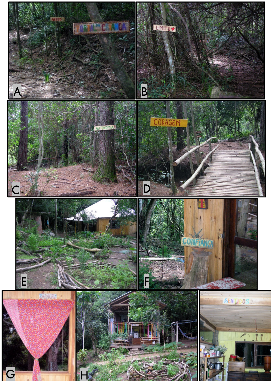
Figura 4 – Placas para orientação dispostas pelo Timbaúva – quem percorre o caminho de acesso depara-se com diversas placas com as seguintes palavras: “portal da criança” e “afeto” (A), “limite” (B), “autonomia” (C) e “coragem” (D), até chegar à parte central, onde encontra os canteiros, o salão octogonal e os banheiros externos (E). Ali observa placas com os dizeres “confiança” na parte externa (F) e “amor” na parte interna (G) do salão octogonal. Também há nesse espaço uma cantina (H). Na parte interna da mesma, uma placa chama a atenção para os “sentidos” (I).