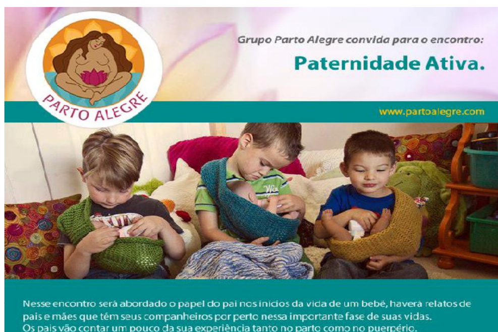
Figura 7 – Recorte do material virtual de divulgação do encontro sobre “paternidade ativa” promovido pelo Grupo Parto Alegre 63 .

meses, todos os dias, pegava um ônibus e levava o filho para que a companheira o amamentasse no trabalho. Depois desse ano, ele já estava um tanto cansado dessa rotina e apareceu uma boa oportunidade de emprego. Então resolveram colocá-lo em um jardim de infância. Ele também falou que durante esse tempo eles receberam críticas dos parentes e dos amigos pela forma como estavam criando o filho, por fazerem parto natural e depois cama compartilhada. Ponderou que o pai é sempre posto de lado no cuidado com crianças, começando pelo parto, ocasião em que alguns hospitais não deixam os pais entrarem na sala de parto. Para ele, tudo é direcionado para as mães, que os grupos de apoio são habitualmente de mães ou discutem temas sobre maternidade. Concluiu recordando certa vez em que foi com o filho a uma sessão do Cinematerna 61 e menino começou a chorar. As demais pessoas ali presentes, todas mulheres, começaram a oferecer ajudar, apontar motivos pelos quais criança poderia estar chorando e o que ele deveria fazer, “ como se eu não soubesse! ” 62 .