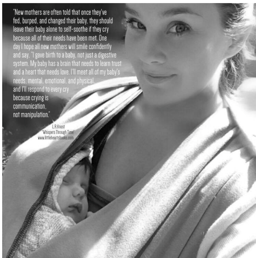
Figura 1 – “Choro é comunicação, não manipulação” 31

Um aspecto importante a se ter em conta em relação à etologia, é que esta, enquanto ramo da biologia que tem como pressuposto conceitos como evolução e seleção natural, toma como irreal a dicotomia inato/adquirido. Assim, embora Bowlby considere o apego como um mecanismo natural, ele não o aborda como inato, mas sim como conformado na interação com o meio ambiente em que esteve operando durante a sua evolução. Nessa formulação, o choro é então uma adaptação biológica que contribuiu para a sobrevivência da espécie ao longo dos tempos. A ruptura da dicotomia inato/adquirido é operada em uma criação agenciada pela criança 32 em meio ao que seria um “ambiente primitivo”. Nesse estilo de criação infantil, a aquisição de conhecimentos, entendidos neste caso enquanto “habilidades corporificadas de percepção e ação” (INGOLD, 2010), é reconfigurada como um processo natural. Contudo, é preciso atentar que se trata de uma ruptura parcial, uma vez que, por outro lado, esse dualismo permanece e até mesmo se exacerba quando se trata da criação infantil em um “ambiente civilizado”, no qual parece não haver possibilidade de agência infantil. Em outras palavras, é como se a aquisição de conhecimentos apresentasse uma mobilidade,