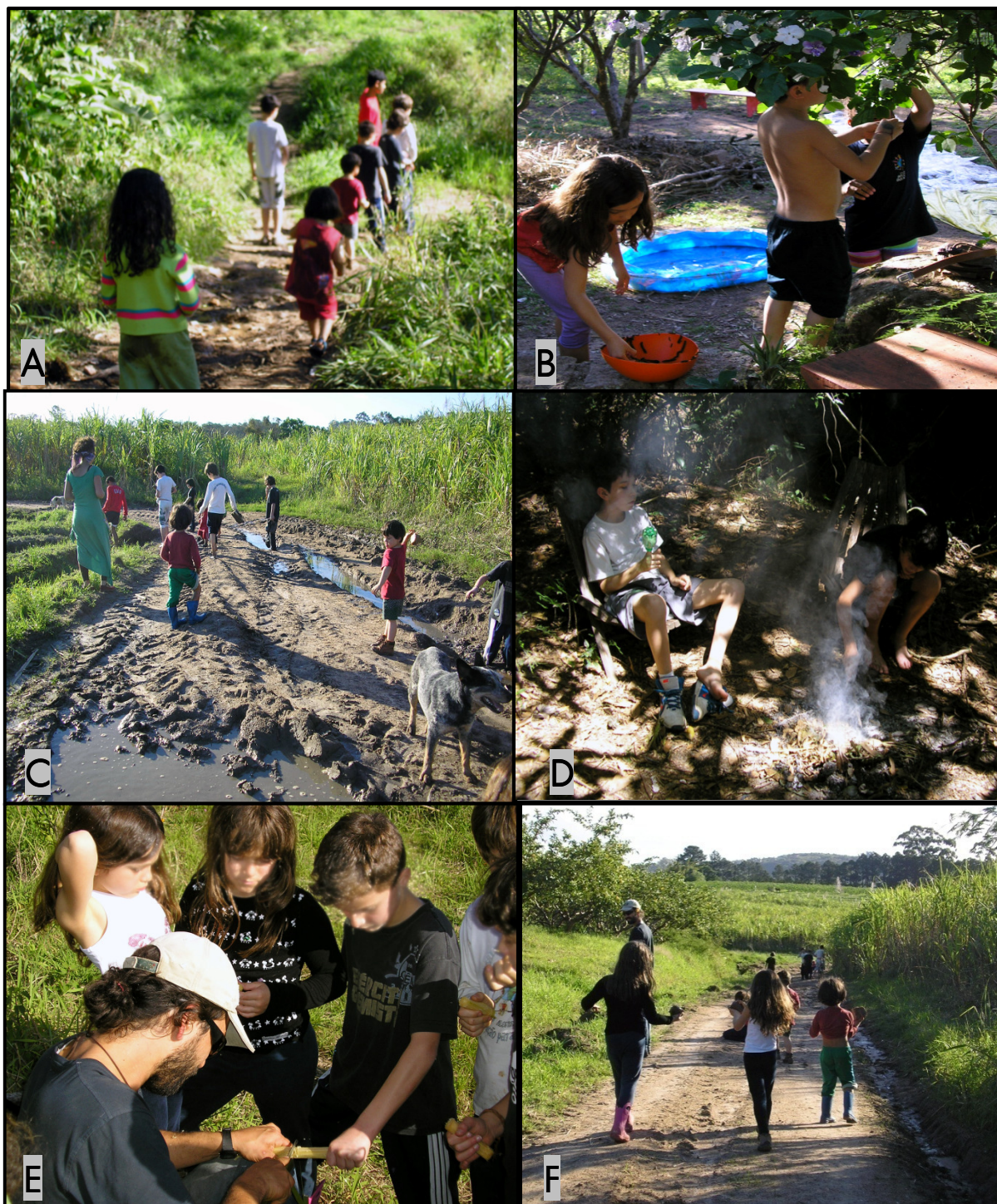
Figura 5 – Momentos durante as Tardes no Verde: crianças no percurso da trilha (A); colocando em uma tigela as lagartas recolhidas de um manacá (B); pondo os pés na lama (C); repousando ao redor da fogueira (D); aguardando um pedaço de cana-de-açúcar (E); e modelando bolas com o barro encontrado no caminho (F).