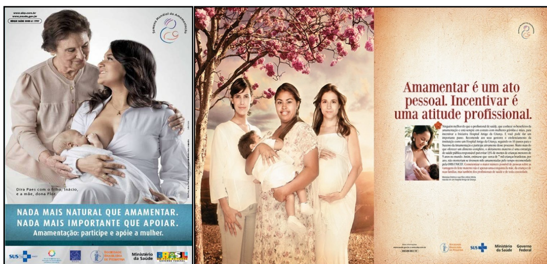
Figura 8 – Material publicitário das campanhas da SMAM de 2008 e de 2010.

descrita para a produção de biopolíticas em torno da prática da amamentação. Contudo, poucas foram as campanhas que chamam a atenção para a rede de pessoas e instituições necessárias para que se possa amamentar. Este é o caso das campanhas de 2008 e de 2009, cujos fôlderes elencaram algumas ações que podem ser desempenhadas por profissionais da saúde; familiares, vizinhos e amigos; Governo; empregadores; organizações sociais; e meios de comunicação no intuito de, respectivamente, apoiar a mulher que amamenta e proteger a criança em situações de emergência. Neste último caso, outros atores para além da mulher são implicados na prática da amamentação possivelmente por partir-se do entendimento que emergências são situações sobre as quais não se tem controle nem responsabilidade.