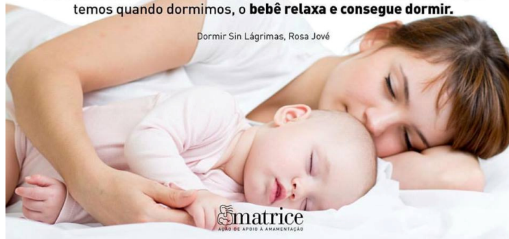
Figura 3 – Coleito e sincronização da respiração e do sono do bebê 34

O co-sleeping (dormir com o bebê) também é uma boa escolha para ajudar na evolução natural do sono . A este respeito, McKenna mostrou que a respiração das mães e dos bebês quando eles dormem juntos se combinam , favorecendo que a criança se adeque às diferentes fases do sono junto com a respiração de sua mãe. Além disso, a duração e a qualidade do sono são melhores . Em um nível prático, muitos pais já sabem que uma das melhores maneiras de fazer adormecer seu bebê é aparentar estar dormindo também. Conforme o pai ou a mãe imitam a respiração que temos quando dormimos, o bebê relaxa e consegue dormir .