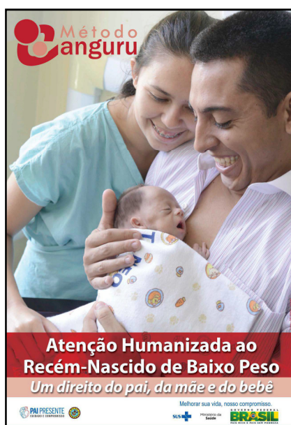
Figura 9 – Cartaz do método canguru, publicado pelo MS em 2014

Nascido de Baixo Peso – Método Canguru. Essa biopolítica configurou o MC no país como uma prática operada por uma equipe multidisciplinar (médicos, enfermeiros, psicólogos, fisioterapeutas, terapeutas ocupacionais, assistentes sociais, fonoaudiólogos, nutricionistas) que busca, entre outras ações, oferecer suporte emocional e desenvolver ações educativas junto às famílias; encorajar o aleitamento materno; contribuir para o processo de formação dos laços afetivos entre os pais e seu bebê; observar o comportamento e desenvolvimento psicoafetivo do bebê; adequar o ambiente e atuação da equipe profissional no sentido de diminuir estímulos adversos como manuseio excessivo, odores, luzes e ruídos (CARVALHO; PROCHNIK, 2001; BRASIL, 2011b).