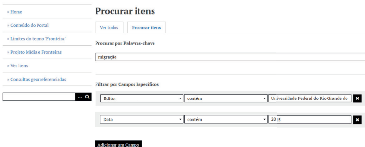
Figura 7: os campos no Portal

Os campos também são chamados de metadados, sendo os elementos necessários para descrever cada item. Na interface gráfica do portal, eles estão identificados como “campos”. Você também pode adicionar mais de uma barra de pesquisa avançada e selecionar mais de um dos campos citados anteriormente, proporcionando uma pesquisa mais detalhada.