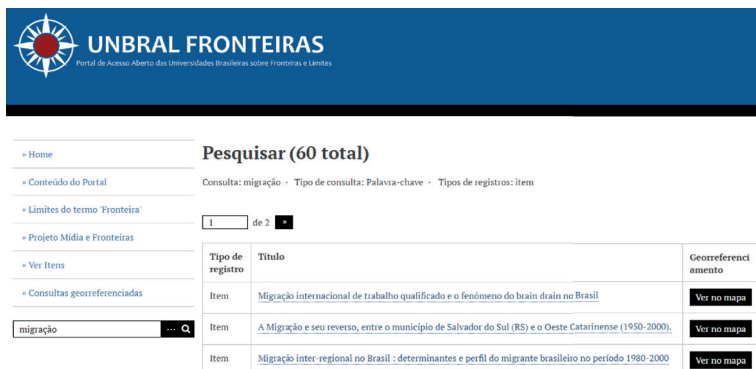
Figura 3: Exemplo de Resultado: “migração”