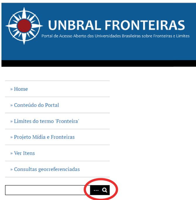
Figura 1: Localização da Pesquisa Avançada

Acesse o endereço eletrônico do site do Unbral Fronteiras e clique no link correspondente à página do portal. O endereço eletrônico do Unbral Fronteiras é: http://unbral.nuvem.ufrgs.br . Clique em “Portal Unbral Fronteiras” na margem superior da tela. Você será direcionado para a página inicial do portal ( http://unbral.nuvem.ufrgs.br/portal/ ), a qual contém a barra de pesquisa desejada. Existem diversas formas de fazer uma pesquisa. Para definir qual dessas formas será utilizada, é necessário clicar no ícone de reticências que está na barra (ao lado da lupa). O botão de reticências abre o menu que permite ao usuário fazer a pesquisa simples ou avançada, as quais serão explicadas a seguir.