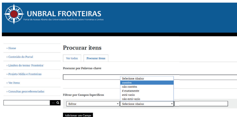
Figura 6: Operadores booleanos de ação