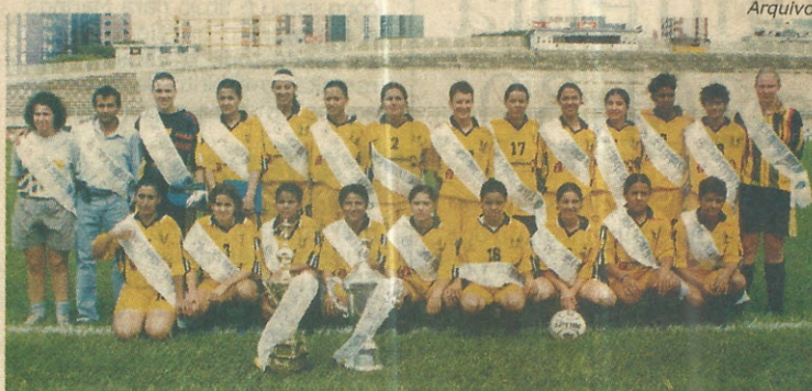
Seleto Clube tem jogo difícil contra a equipe feminina do Internacional