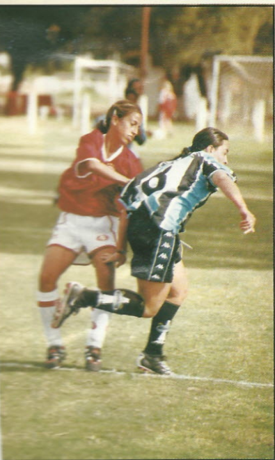
Jogadoras da dupla marcam presença também na Seleção Brasileira

O Grêmio estreia no dia 19/08, contra o São Cristóvão, do Rio de Janeiro. As meninas do Inter, no dia 18, pegam o Futebol Esperança Carioca. A final está prevista para o dia 09 de setembro.