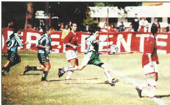
GRE-NAL decidiu o terceiro lugar do Brasileiro

O primeiro jogo de futebol feminino foi realizado na Inglaterra em 1896, entre as seleções inglesa e escocesa. No Brasil, a prática foi iniciada por volta dos anos 30, mas por muito tempo foi discriminada.