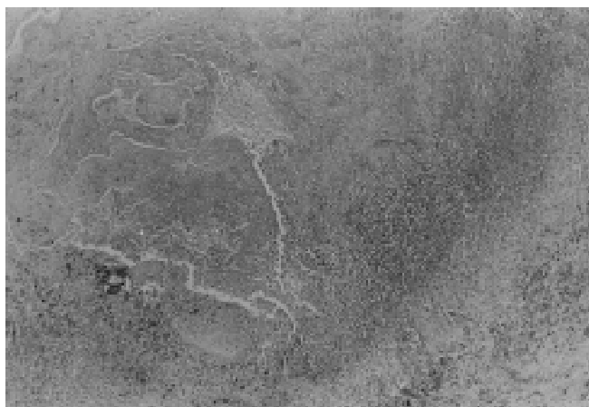
Tuberculose pulmonar. Granuloma com necrose caseosa central. HE 5x.

de nefroesclerose benigna com hialinização da parede de arteríolas renais, nódulo colóide no istmo da tireóide de 0,7cm no seu maior diâmetro, medula óssea com discreta hiperplasia reacional e edema cerebral. Não encontramos achados macroscópicos referentes a acidentes vasculares cerebrais anteriores. Entretanto, em muitos quadros isquêmicos cerebrais, os achados macroscópicos podem não ser reconhecidos em material de necropsia. O paciente apresentou, ainda, úlcera gástrica aguda em pequena curvatura, medindo 2,3cm, com destruição importante da mucosa e submucosa nesse nível. Não foram identificados fenômenos tromboembólicos terminais ao exame macroscópico. Concluimos estar a doença básica relacionada à tuberculose pulmonar, de evolução lenta e progressiva, acompanhada por broncopneumonia recente de etiologiabacteriana.