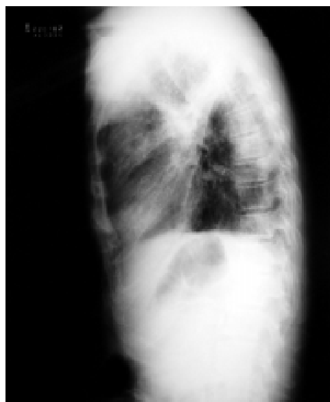
Figura 1: Radiografias de tórax mostrando consolidações acinares, mais acentuadas no lobo superior direito e cúpula, espessamento de septos, atelectasia à esquerda e enfisema centrolobular.