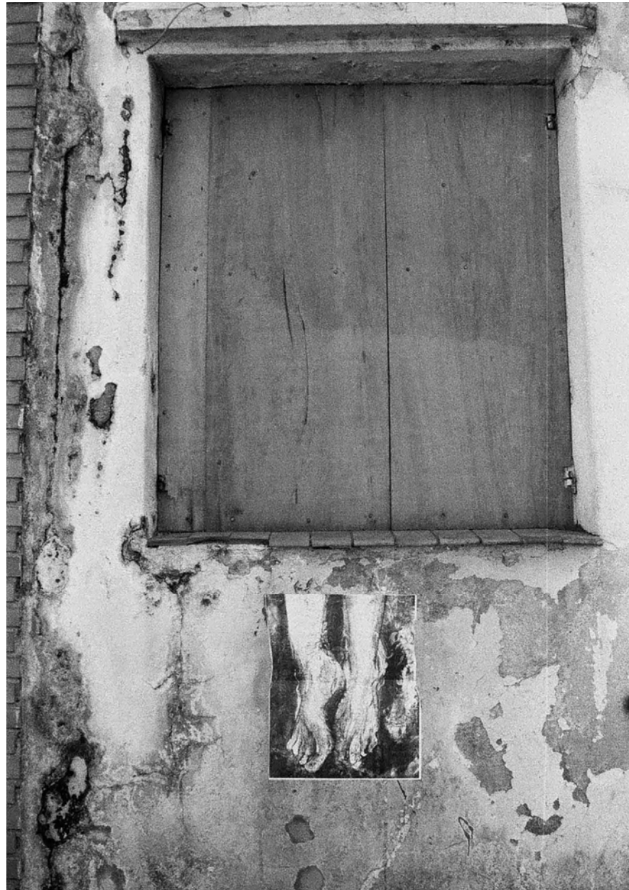
Figura 25 Fernanda Manéa Da série Janelas Desenho, Fotocópia, Intervenção e Fotografia 2006 25x20 cm