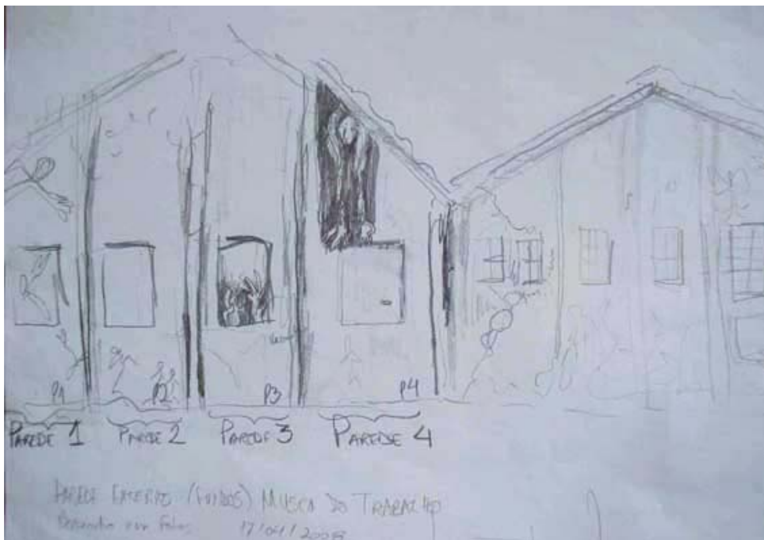
Figura 59 Fernanda Manéa Grupo II Intervenções em espaços autorizados Esboço 2008 21x29,5 cm