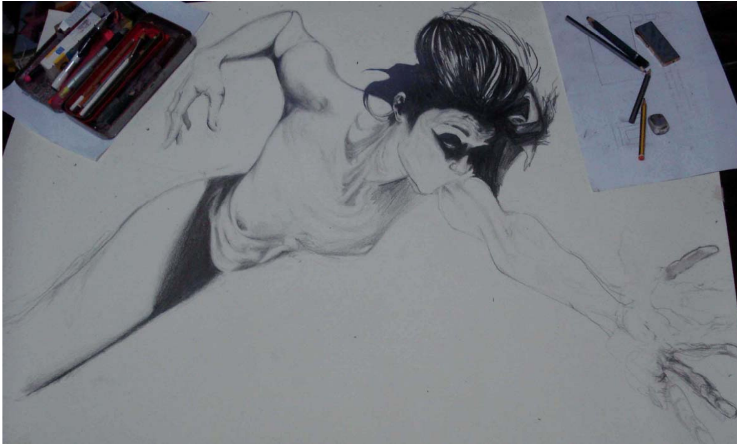
Figura 34 Fernanda Manéa Processos Grafite sobre papel 2008 70x100 cm