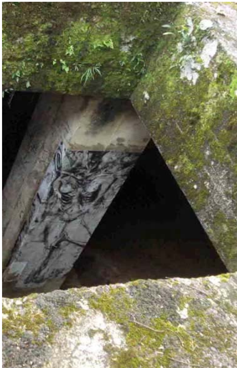
Figura 03 Fernanda Manéa A profundidade da alma humana Desenho, Fotocópia, Intervenção e Fotografia 2006 25x20 cm