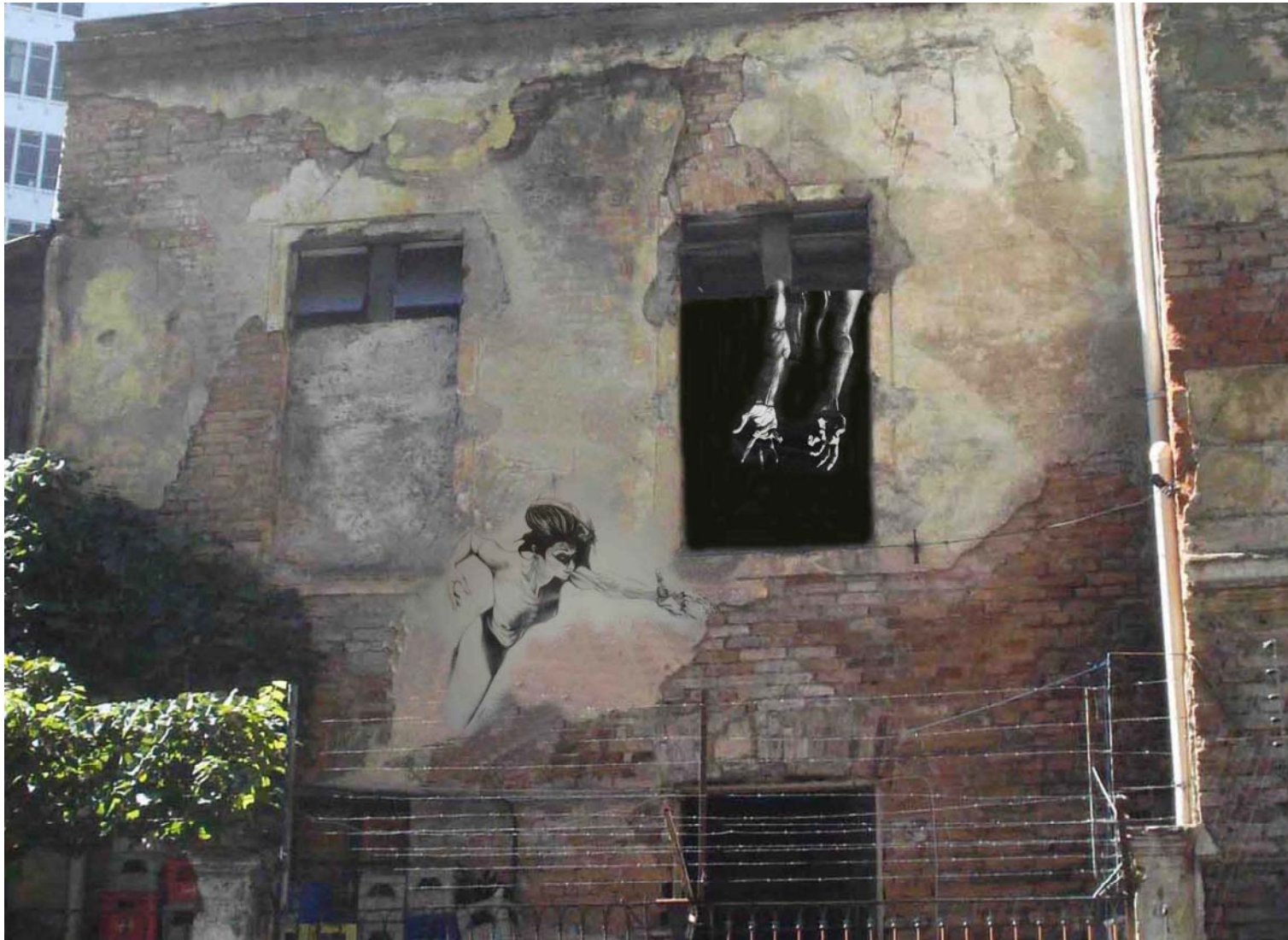
Figura 45 Fernanda Manéa Grupo II Intervenções em espaços autorizados Projeto digital 2008