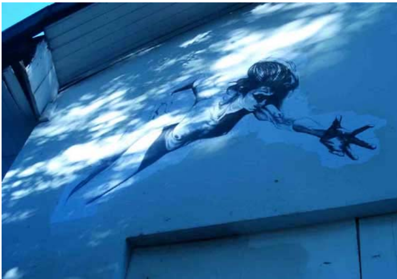
Figura 65 Fernanda Manéa Grupo II Intervenções em espaços autorizados Registro 2008