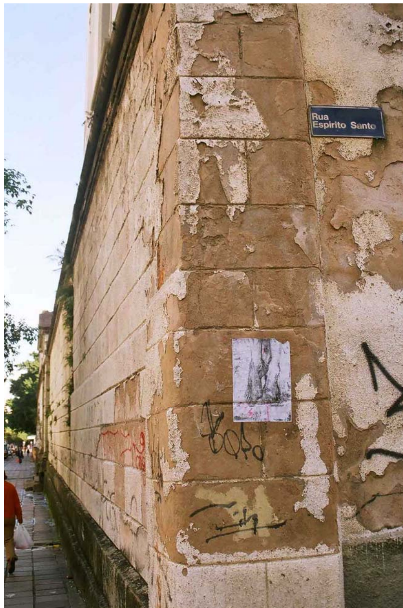
Figura 71 Fernanda Manéa Espírito Santo Desenho, Fotocópia, Intervenção e Fotografia 2006 25x20 cm