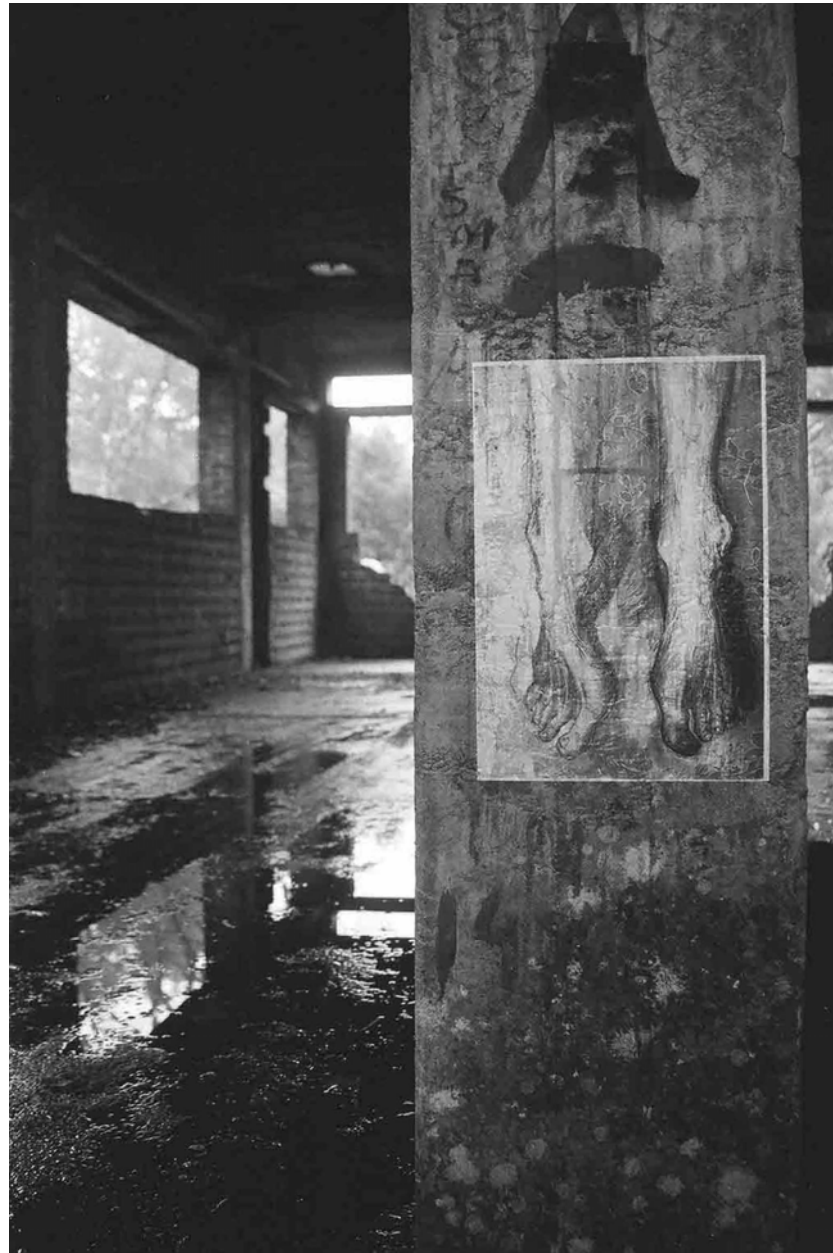
Figura 07 Fernanda Manéa Ascensão Desenho, Fotocópia, Intervenção e Fotografia 2006 25x20 cm