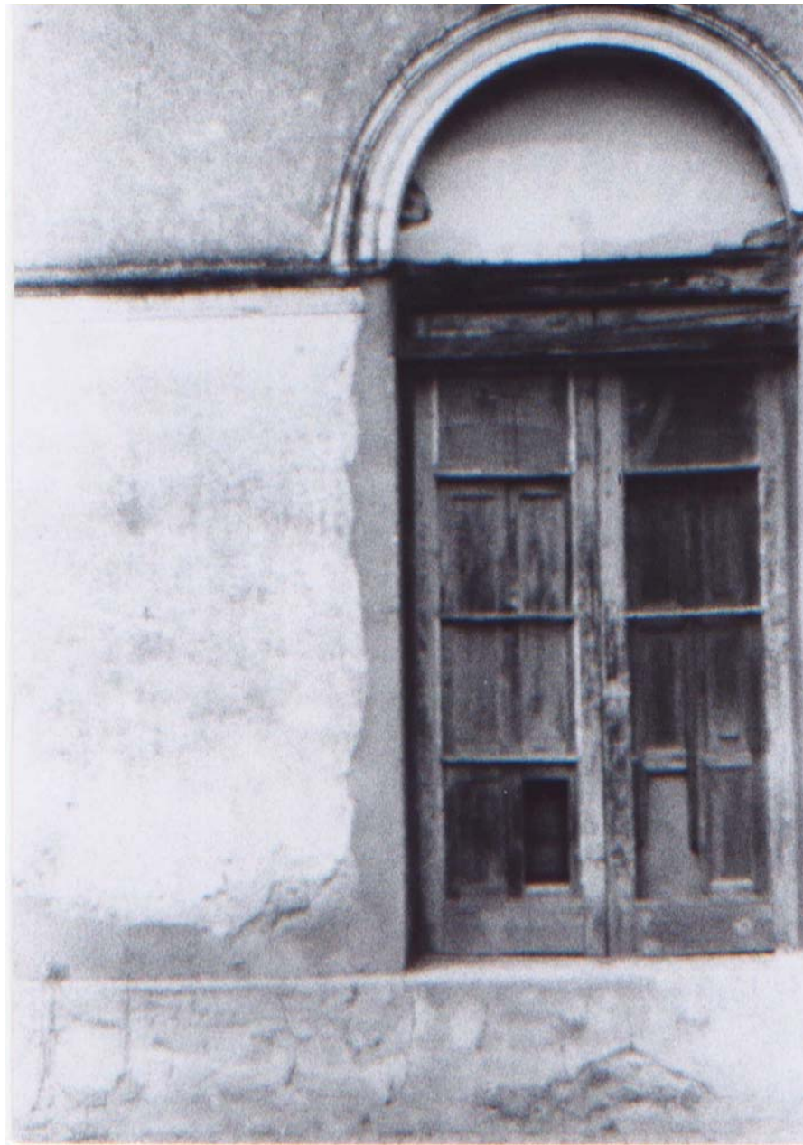
Figura 11 Fernanda Manéa Da série Montevideo Fotografia 2006 25x20 cm