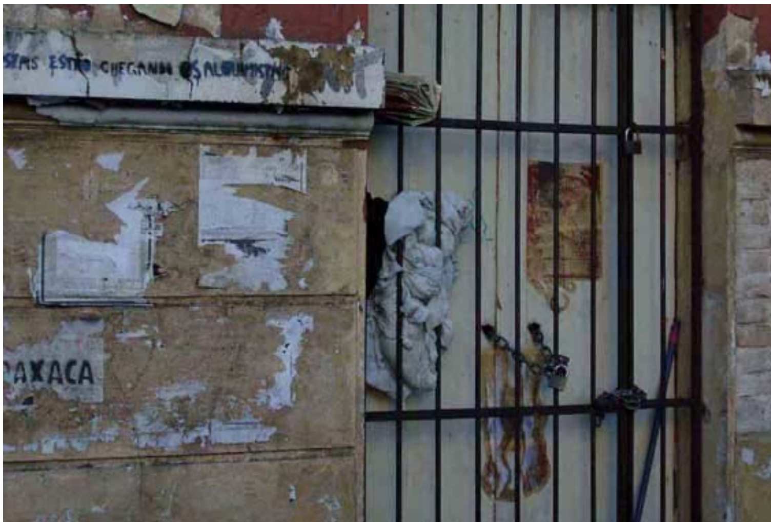
Figura 28 Fernanda Manéa