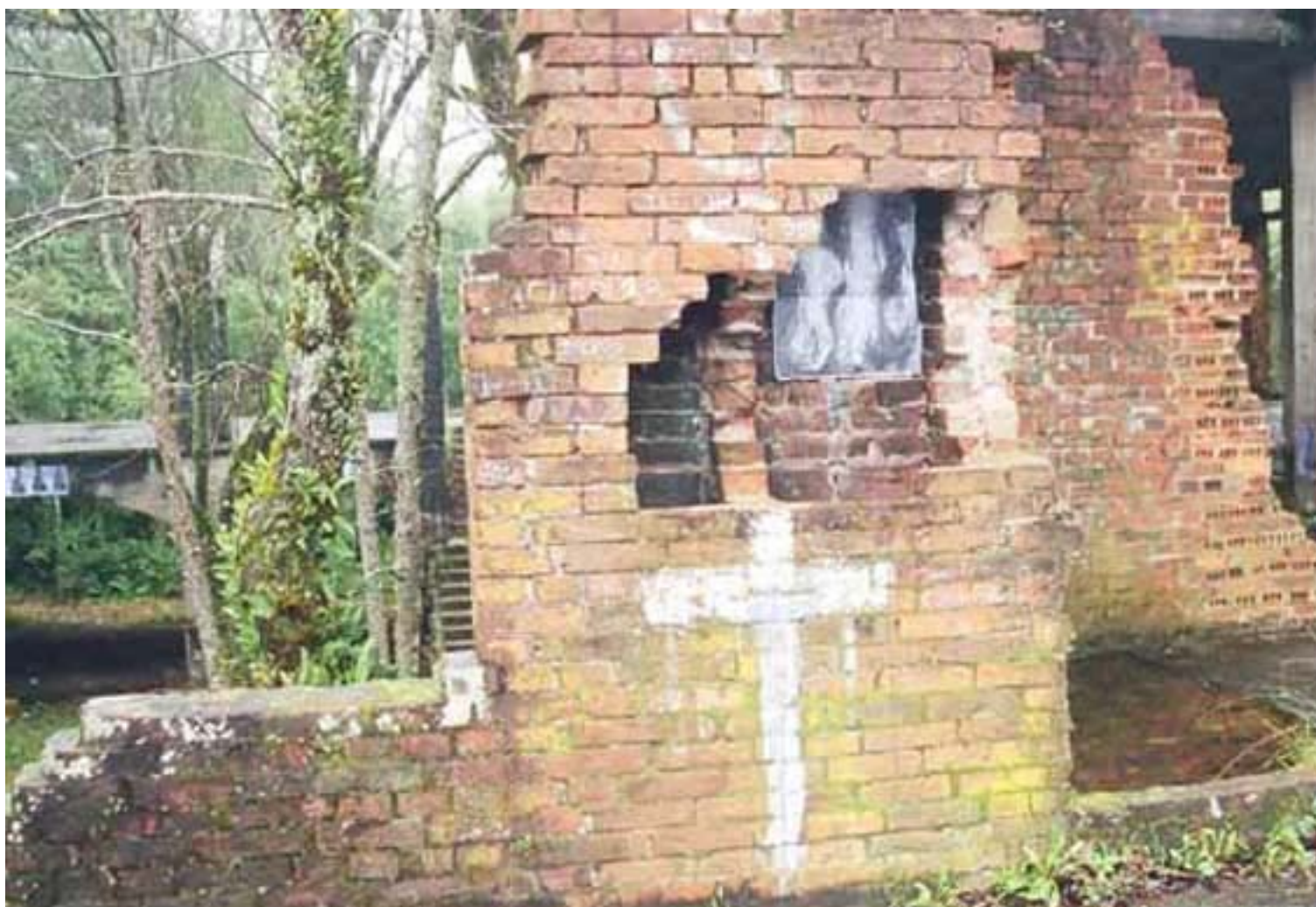
Figura 16 Fernanda Manéa Da série Intervenções I Desenho, Fotocópia, Intervenção e Fotografia 2006 20x25 cm