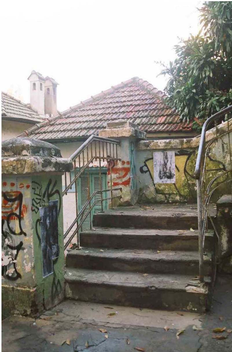
Figura 41 Fernanda Manéa Grupo I O destino dos trabalhos que não tenho controle 2006 Antes