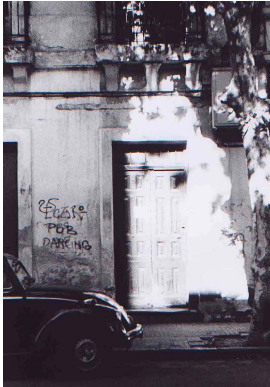
Figura 10 Fernanda Manéa Da série Montevideo Fotografia 2006 25x20 cm