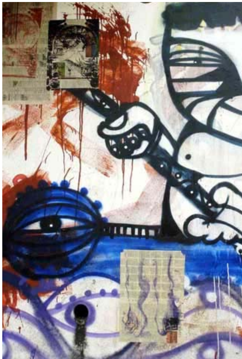
Figura 23 Fernanda Manéa Da série Intervenções III Desenho, Serigrafia, Intervenção e Fotografia 2007 25x20 cm