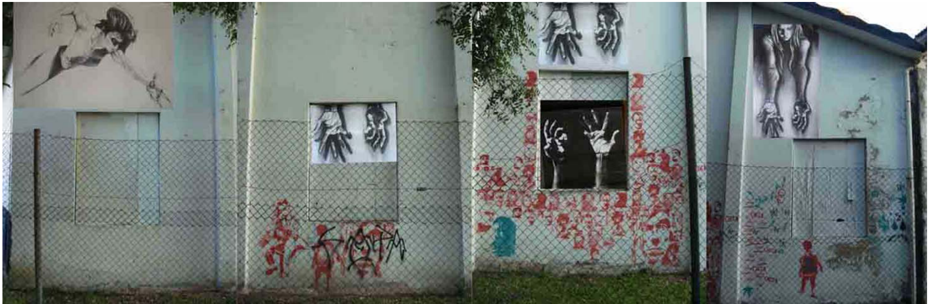
Figura 60 Fernanda Manéa Grupo II Intervenções em espaços autorizados Projeto Digital 2008 Paredes 1, 2, 3 e 4 respectivamente