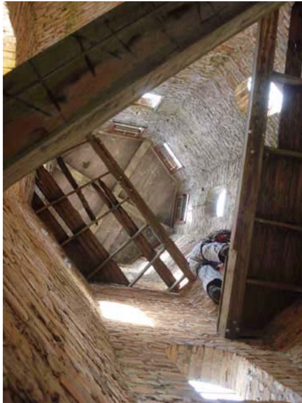
Figura 55 Fernanda Manéa Grupo II Intervenções em espaços autorizados Registro 2008