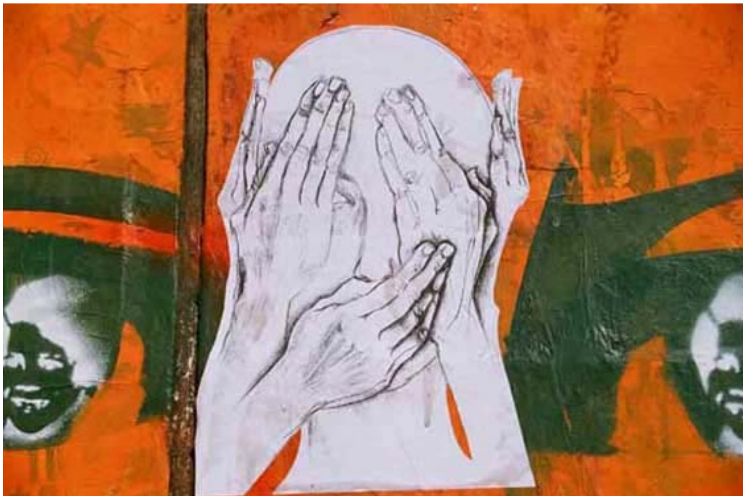
Figura 15 Fernanda Manéa O que você esconde de si mesmo? Da série Intervenções I Desenho, Intervenção e Fotografia 2006 25x20 cm