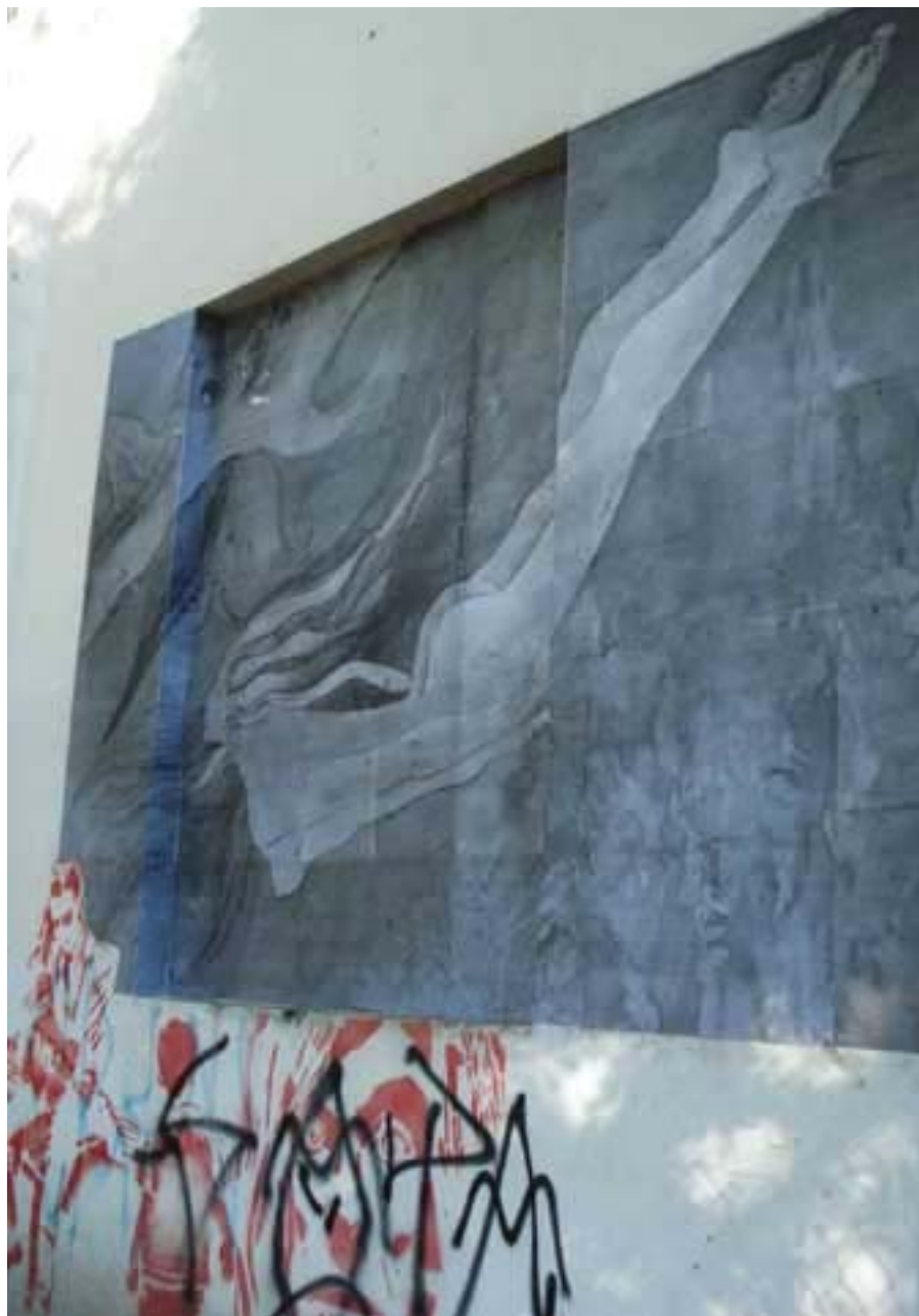
Figura 63 Fernanda Manéa Grupo II Intervenções em espaços autorizados Registro 2008