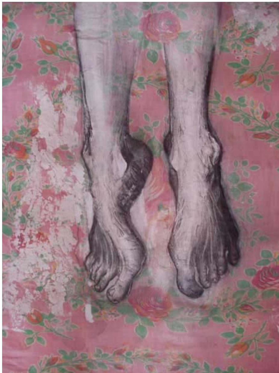
Figura 06 Fernanda Manéa Da série Pés Grafite sobre papel 2005 62x40 cm