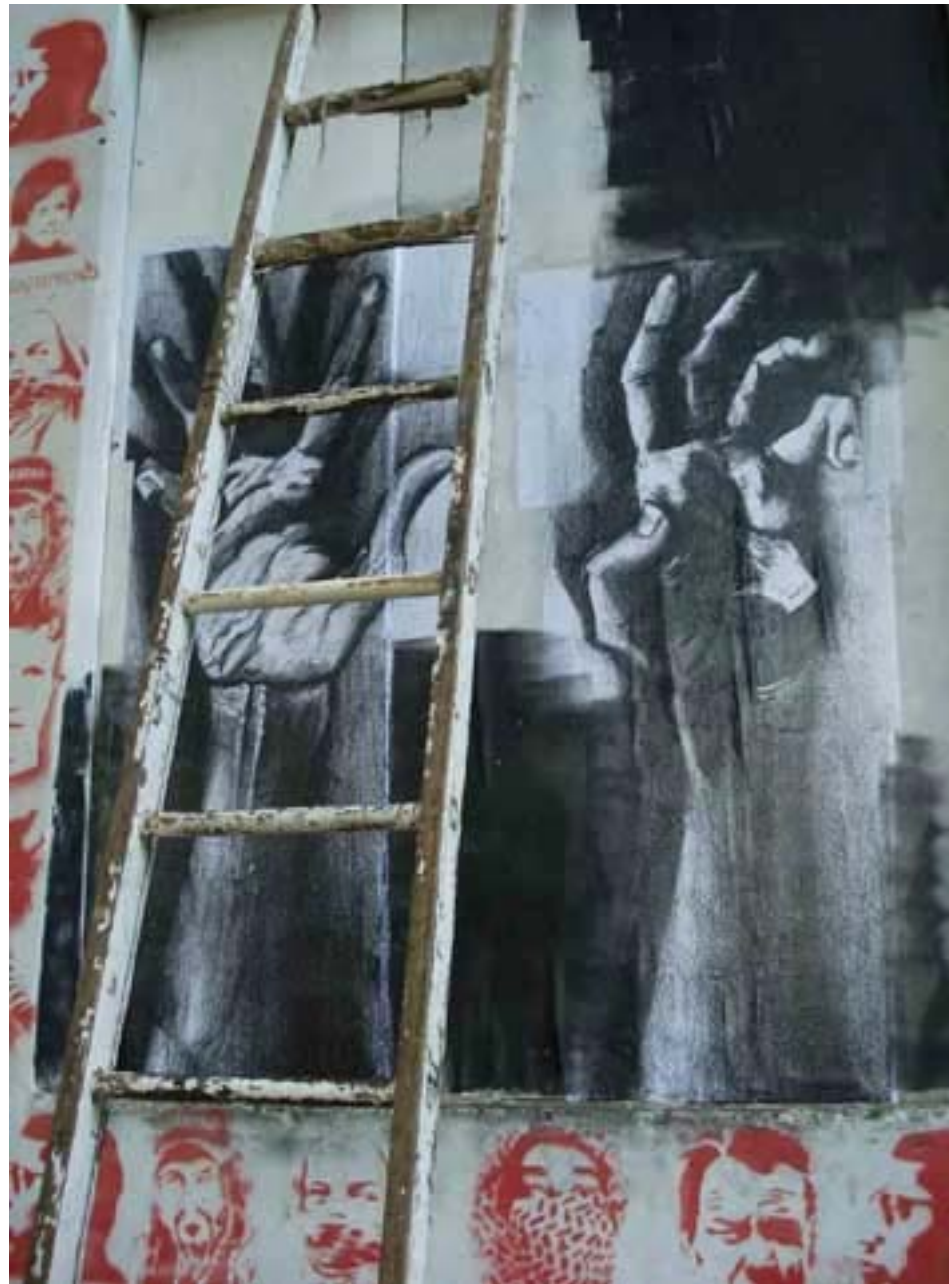
Figura 66 Fernanda Manéa Grupo II Intervenções em espaços autorizados Registro 2008