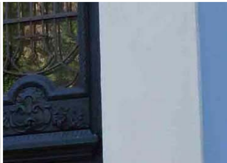
Figura 44 Fernanda Manéa Grupo I controle Depois O destino dos trabalhos que não tenho 2008