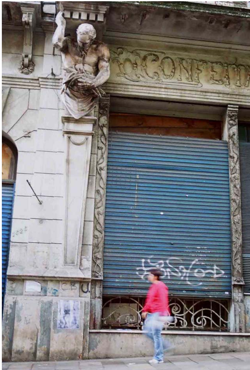
Figura 39 Fernanda Manéa Grupo I O destino dos trabalhos que não tenho controle 2006 Antes