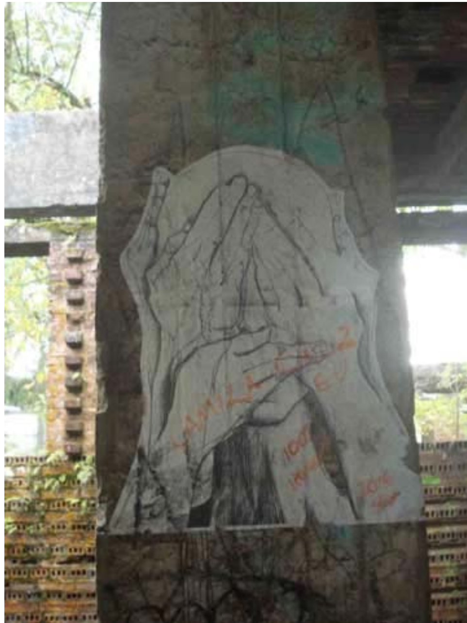
Figura 69 Fernanda Manéa Desenho, Fotocópia, Intervenção e Fotografia Registro 2007