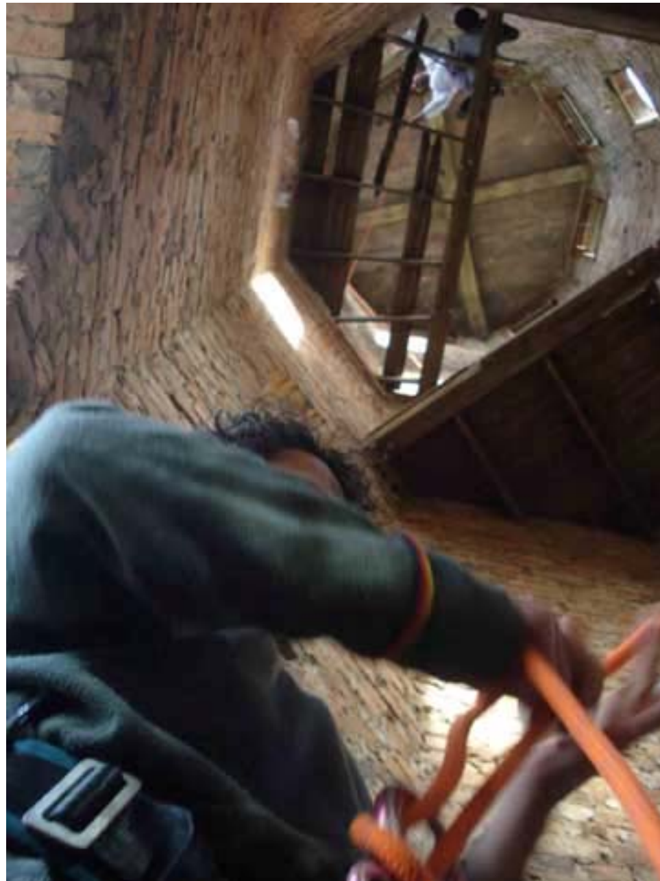
Figura 56 Fernanda Manéa Grupo II Intervenções em espaços autorizados Registro 2008