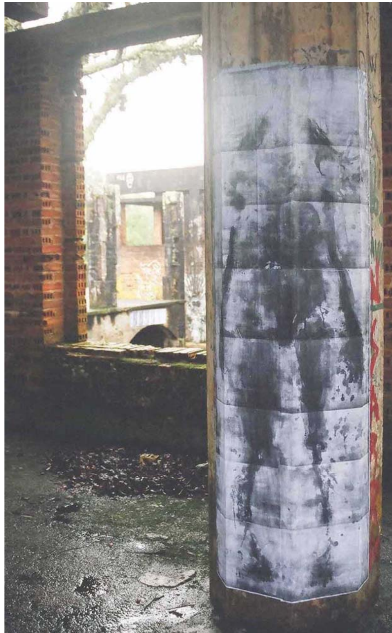
Figura 05 Fernanda Manéa Desenho, Fotocópia, Intervenção e Fotografia 2006 25 x 20