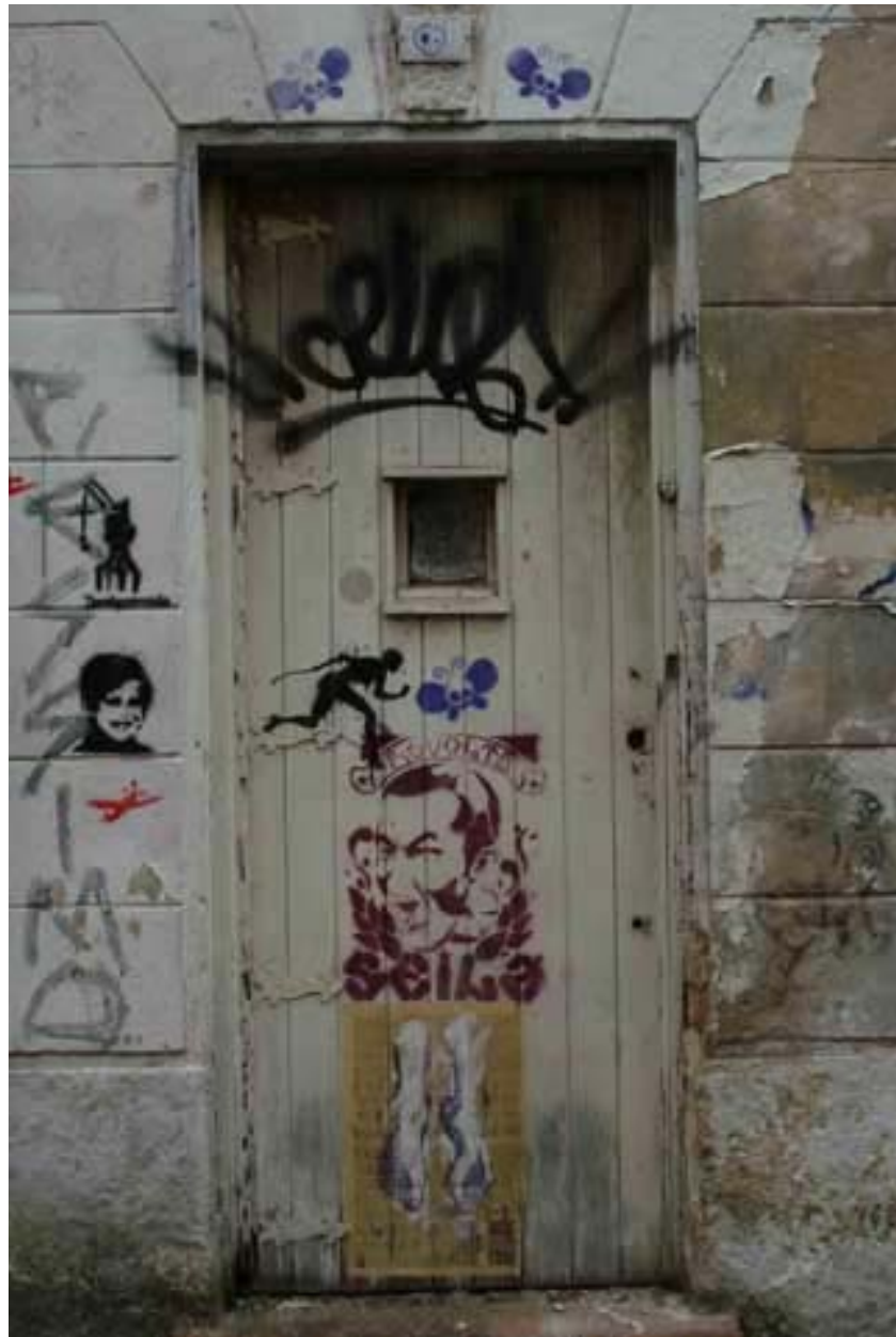
Figura 30 Fernanda Manéa Da série Portas Desenho, Serigrafia, Intervenção e Fotografia 2007 25x20 cm