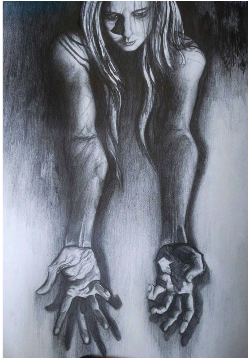
Figura 33 Fernanda Manéa Processos Grafite sobre papel 2008 66x49 cm