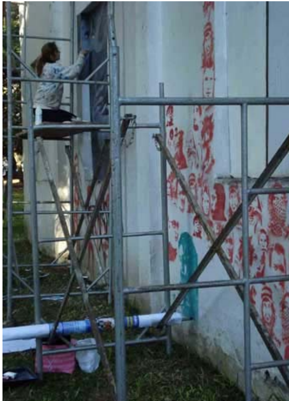
Figura 62 Fernanda Manéa Grupo II Intervenções em espaços autorizados Registro 2008