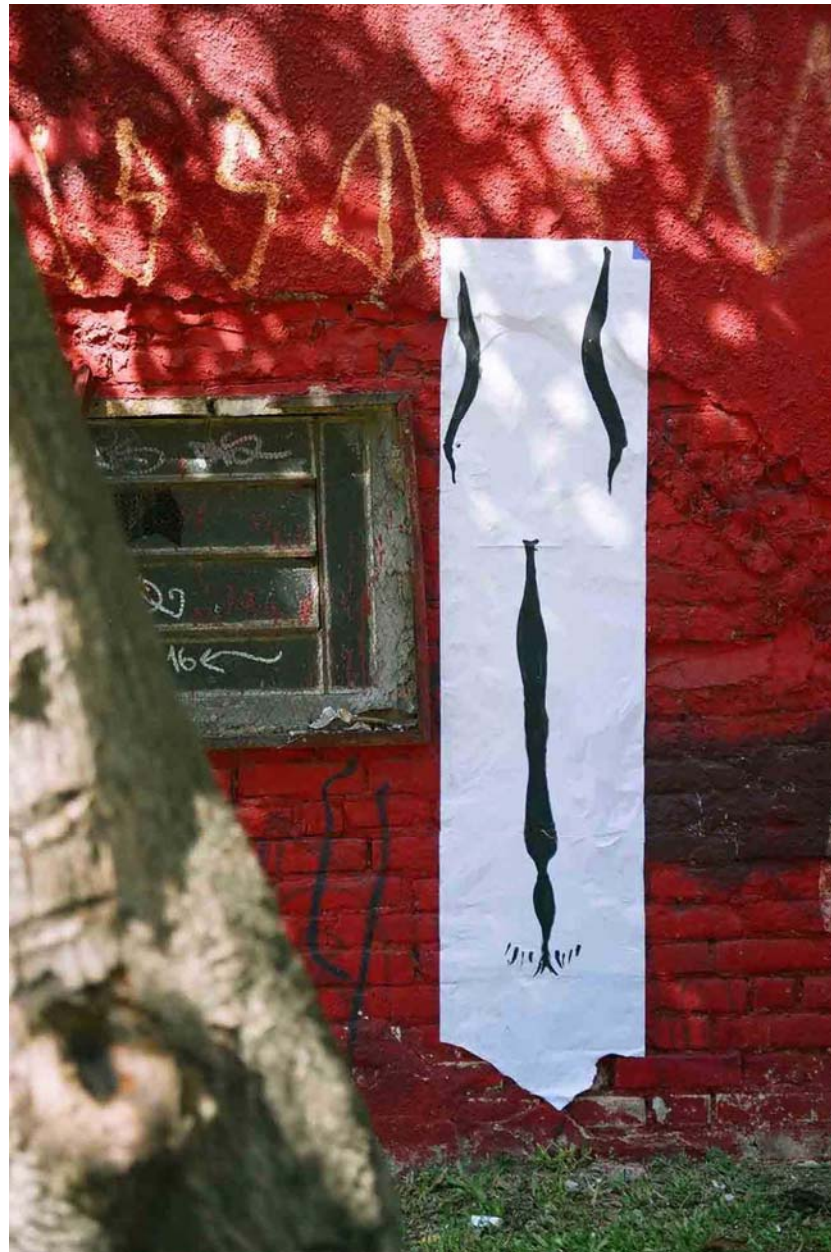
Figura 13 Fernanda Manéa Da série Intervenções I Desenho, Intervenção e Fotografia 2006 25x20 cm