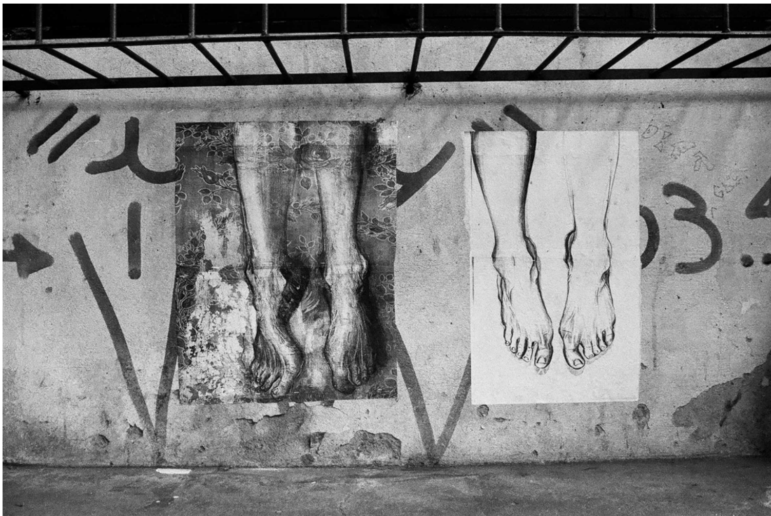
Figura 27 Fernanda Manéa Sem Pré Conceito Da série Janelas Desenho, Fotocópia, Intervenção e Fotografia 2006 20x25 cm