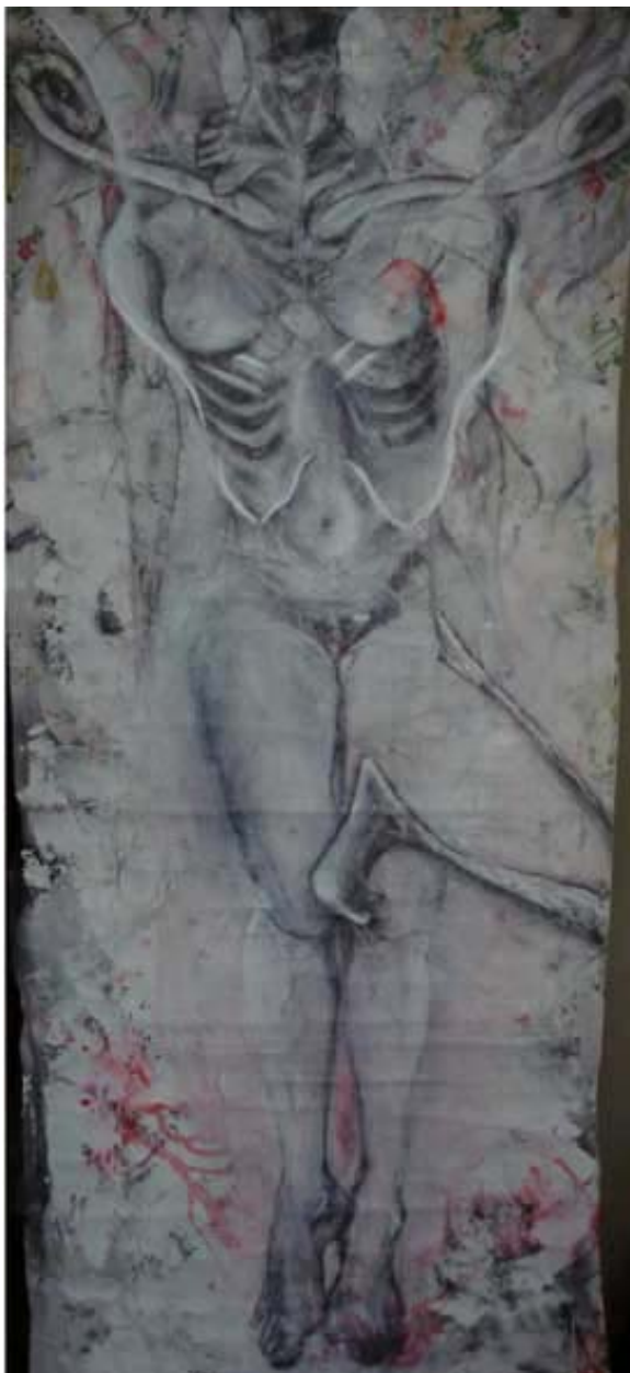
Figura 02 Fernanda Manéa Da série Corpos Suspensos Grafite e acrílica sobre lona 2005 175x80 cm