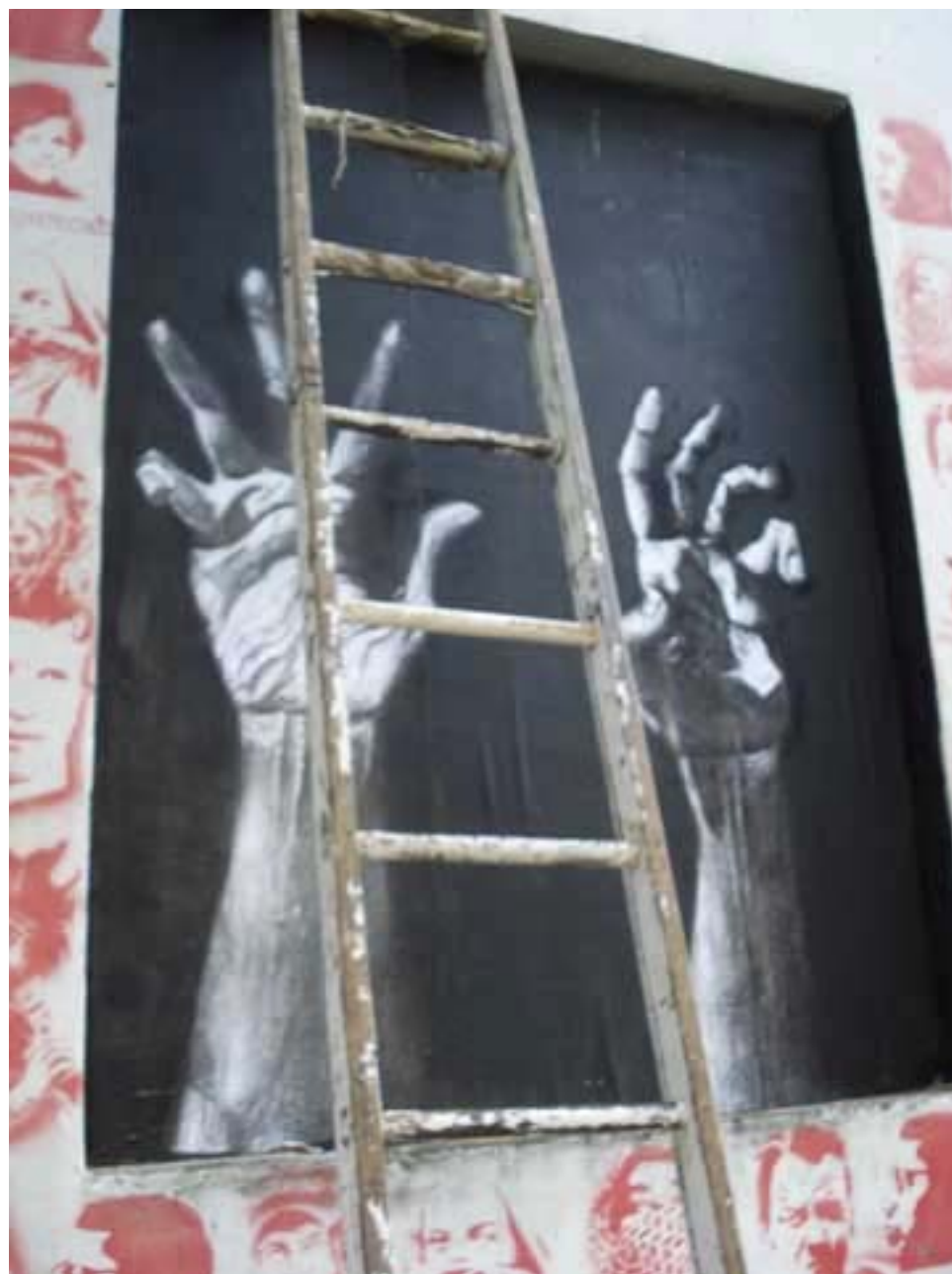
Figura 67 Fernanda Manéa Grupo II Intervenções em espaços autorizados Registro 2008