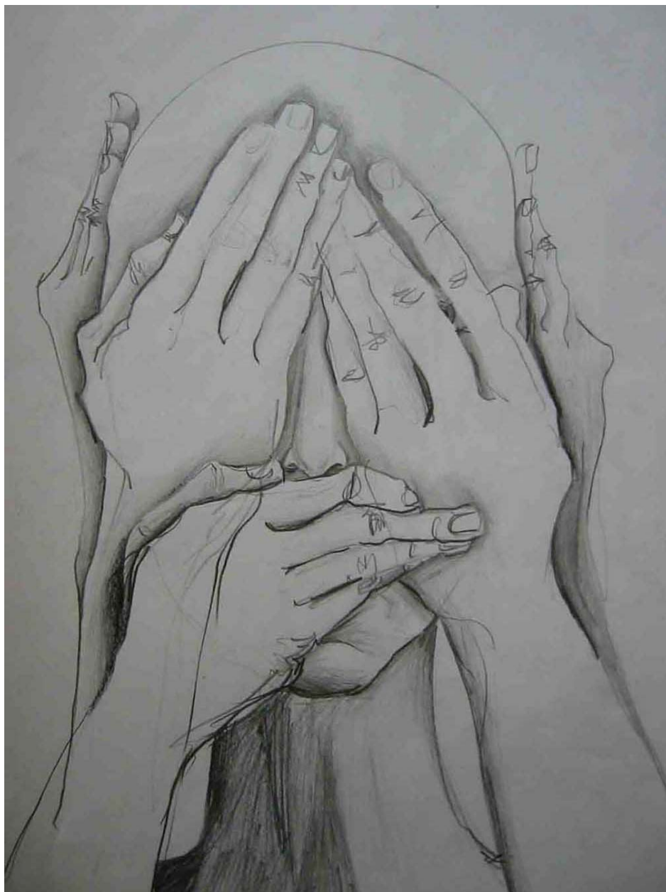
Figura 08 Fernanda Manéa Da série Surdo Cego e Mudo Grafite sobre papel 2005 42x29,5 cm