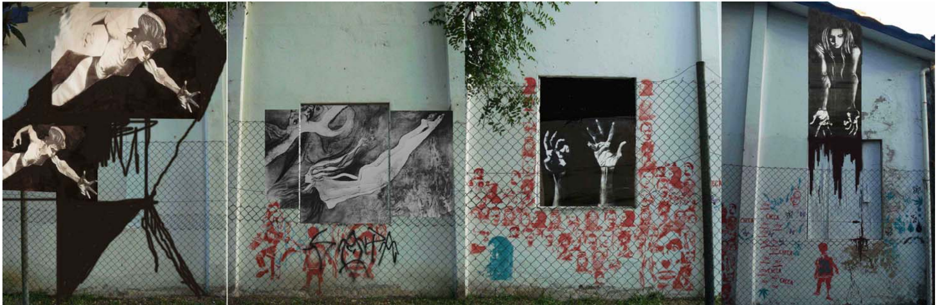
Figura 61 Fernanda Manéa Grupo II Intervenções em espaços autorizados Projeto Digital Final 2008 Paredes 1, 2, 3 e 4 respectivamente