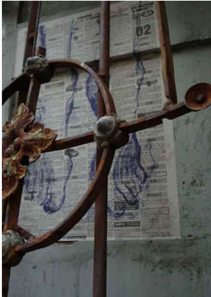
Figura 29 Fernanda Manéa Da série Portas Desenho, Serigrafia, Intervenção e Fotografia 2007 25x20 cm