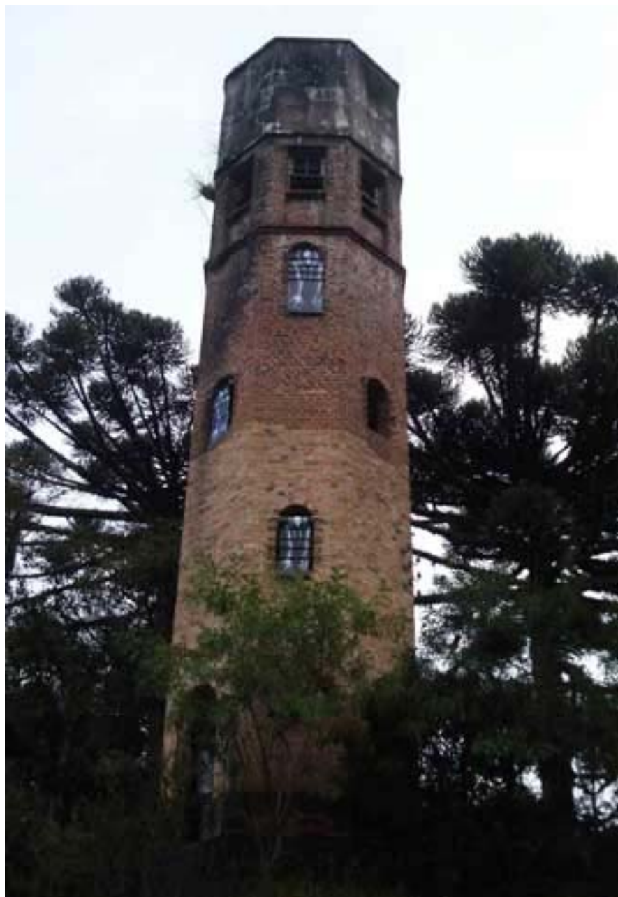
Figura 58 Fernanda Manéa Grupo II Intervenções em espaços autorizados Registro 2008