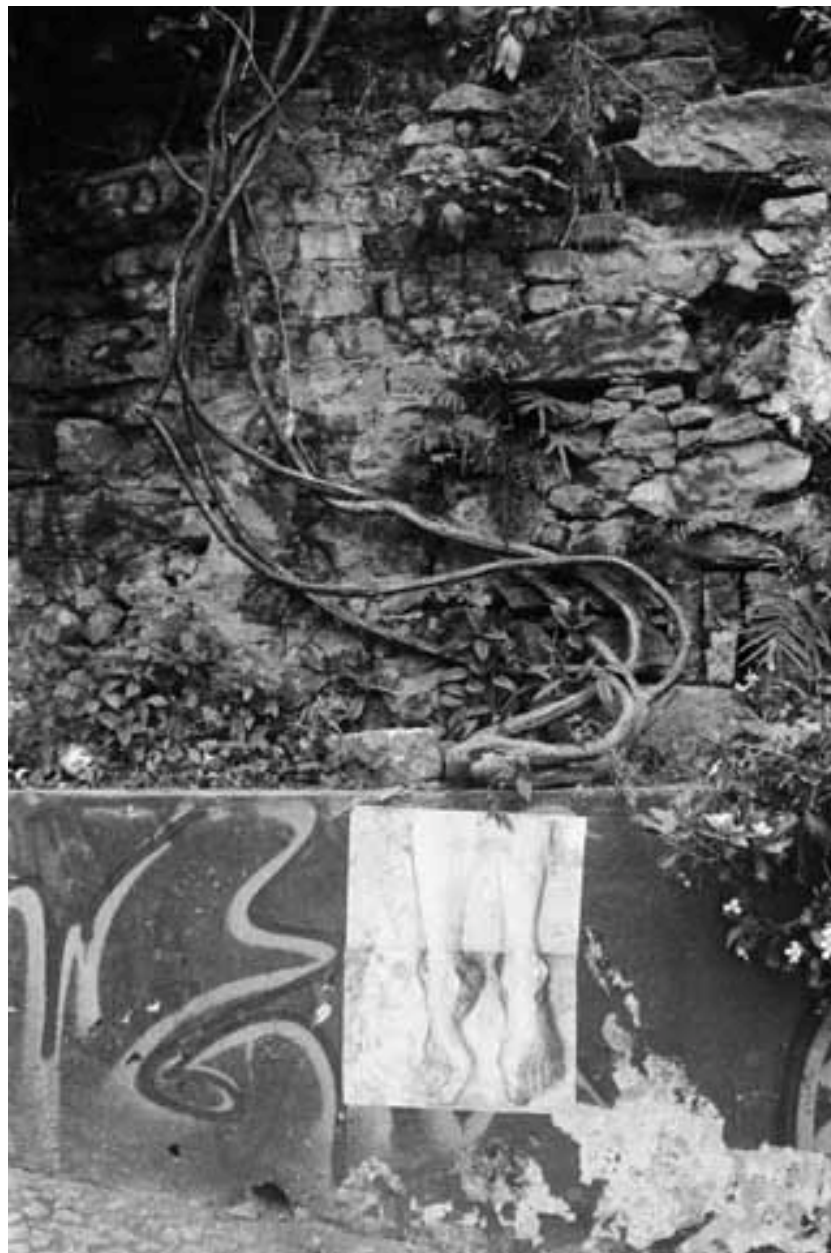
Figura 21 Fernanda Manéa Encontre suas Raízes Da série Intervenções II Desenho, Fotocópia, Intervenção e Fotografia 2007 25x20 cm