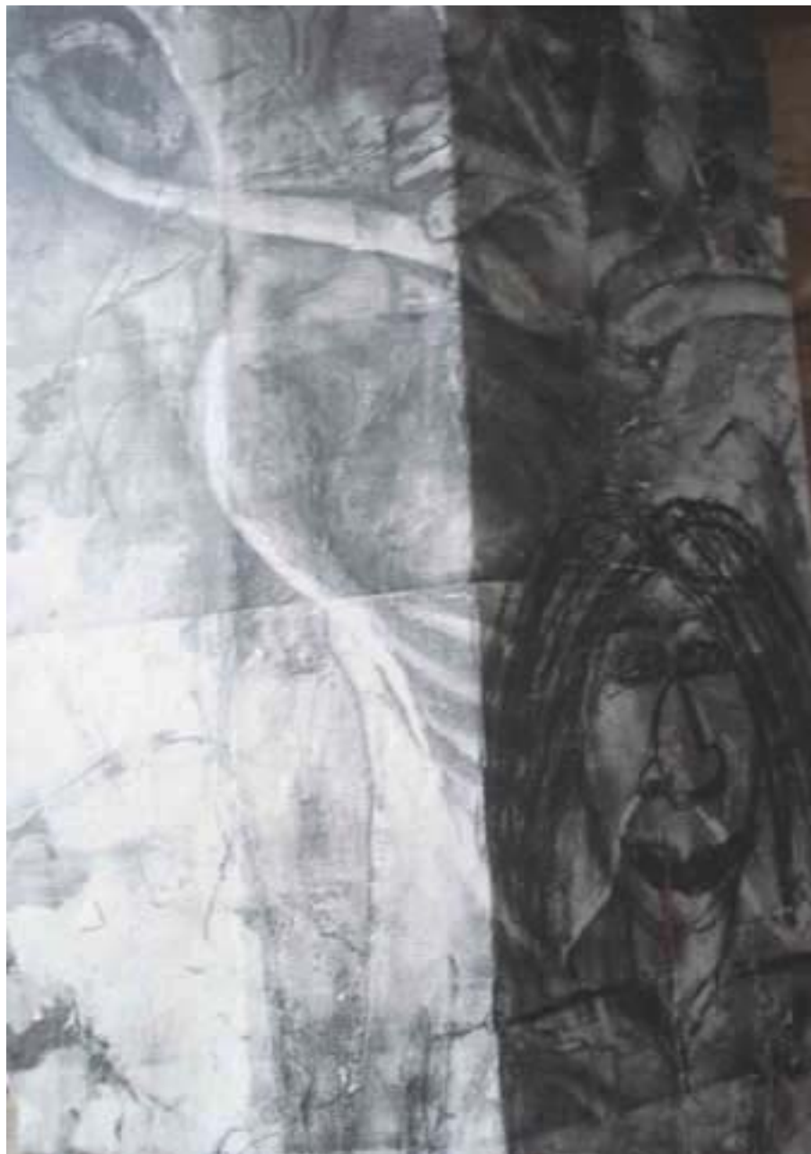
Figura 70 Fernanda Manéa Desenho, Fotocópia, Intervenção e Fotografia Registro 2008