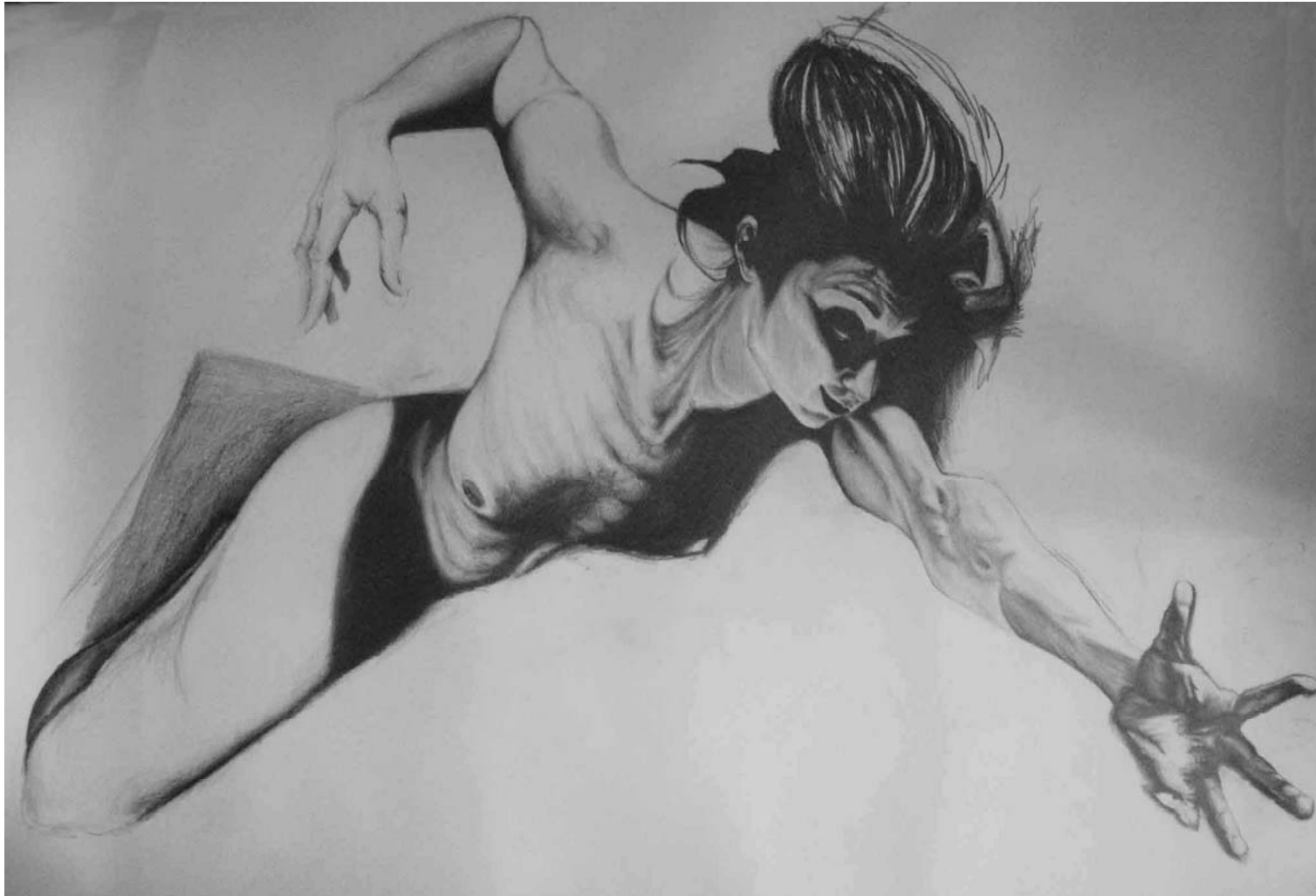
Figura 35 Fernanda Manéa Processos Grafite sobre papel 2008 70x100 cm