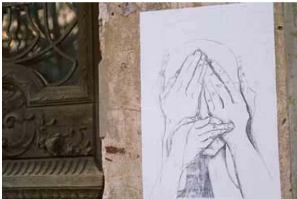
Figura 43 Fernanda Manéa Grupo I controle Antes O destino dos trabalhos que não tenho 2005