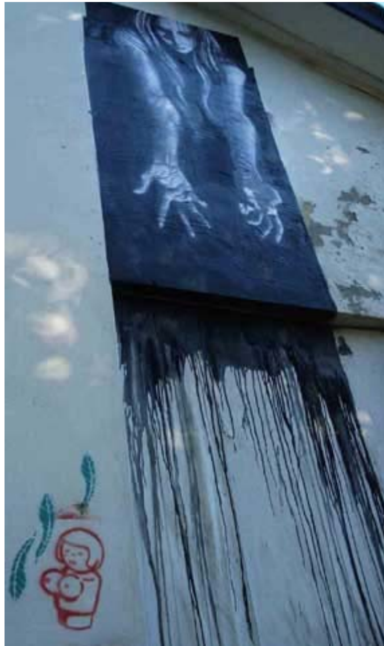
Figura 64 Fernanda Manéa Grupo II Intervenções em espaços autorizados Registro 2008