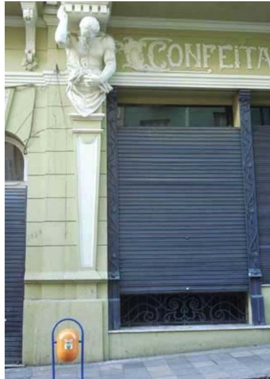
Figura 40 Fernanda Manéa Grupo I O destino dos trabalhos que não tenho controle 2007 Depois