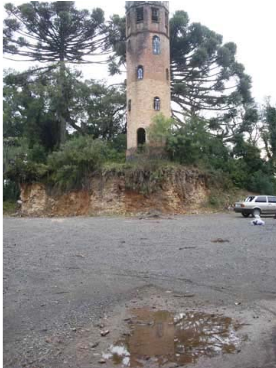
Figura 73 Fernanda Manéa Desenho, Fotocópia, Intervenção e Fotografia Registro 2008