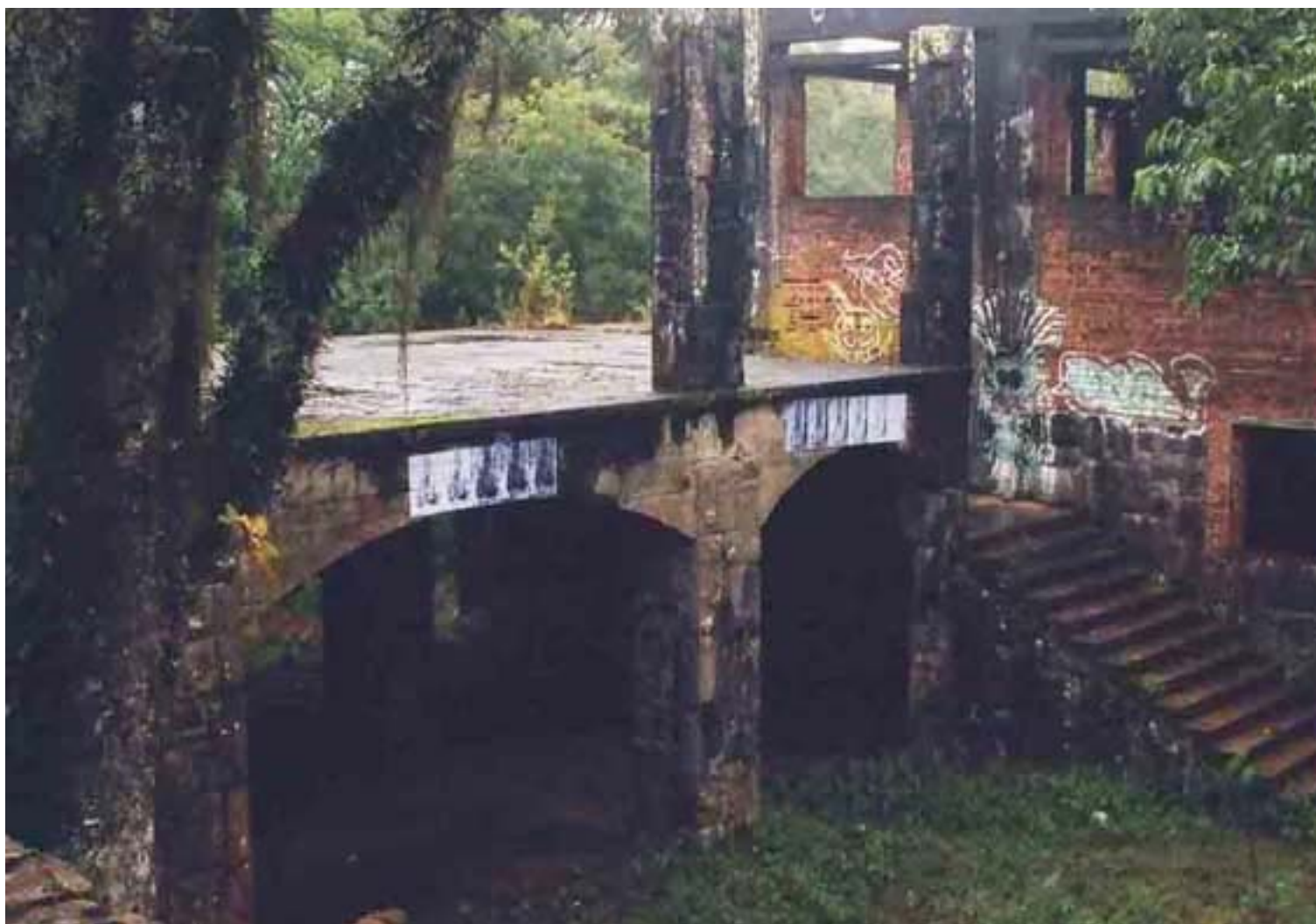
Figura 18 Fernanda Manéa Da série Intervenções I Desenho, Fotocópia, Intervenção e Fotografia 2006 20x25 cm