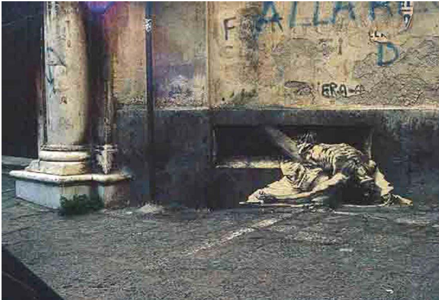
Figura 31 Pignon Ernest Lê Soupirail Nápoles 1990