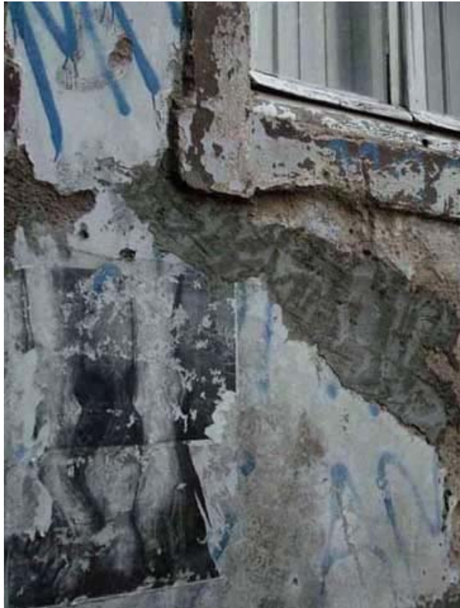
Figura 26 Fernanda Manéa Da série Janelas Desenho, Serigrafia, Intervenção e Fotografia 2007 25x20 cm