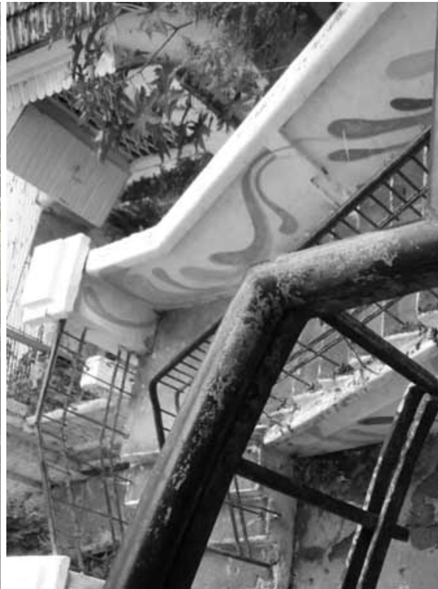
Figura 42 Fernanda Manéa Grupo I O destino dos trabalhos que não tenho controle 2007 Depois