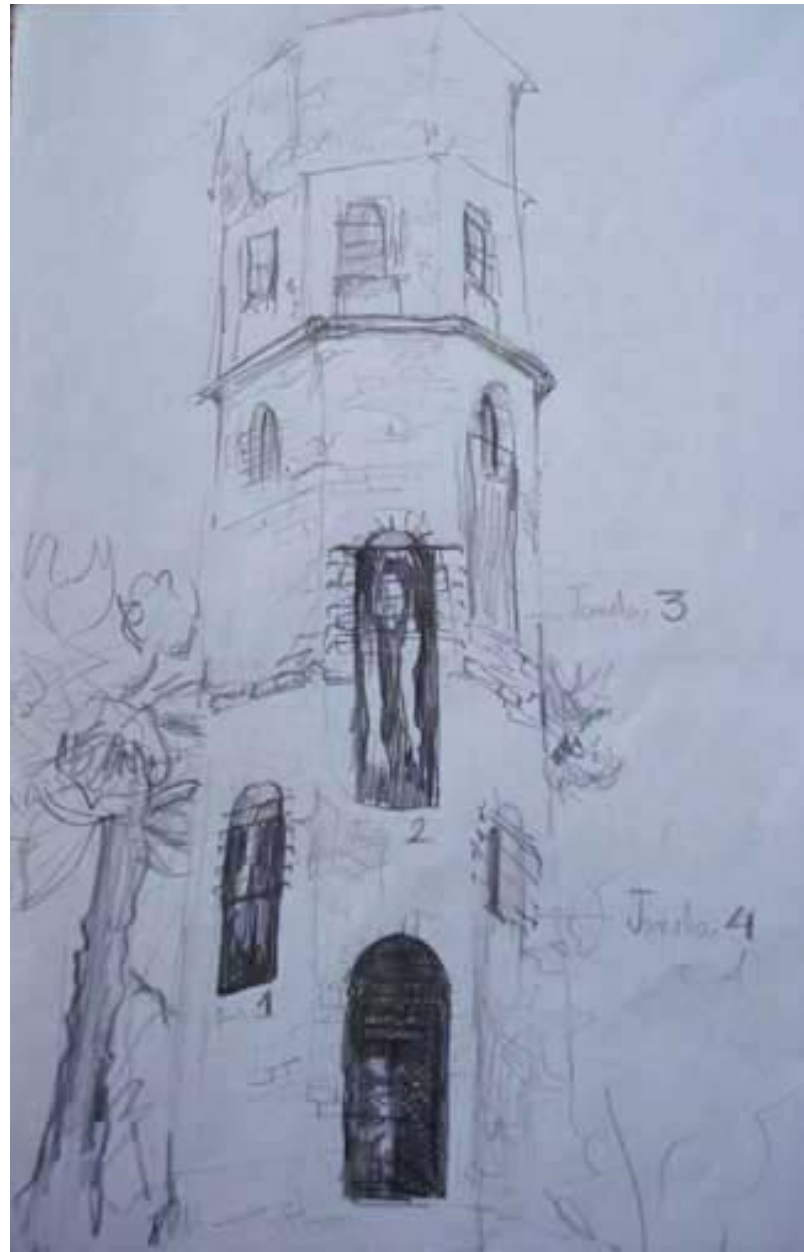
Figura 49 Fernanda Manéa Grupo II Intervenções em espaços autorizados Esboço 2008 29,5x21 cm