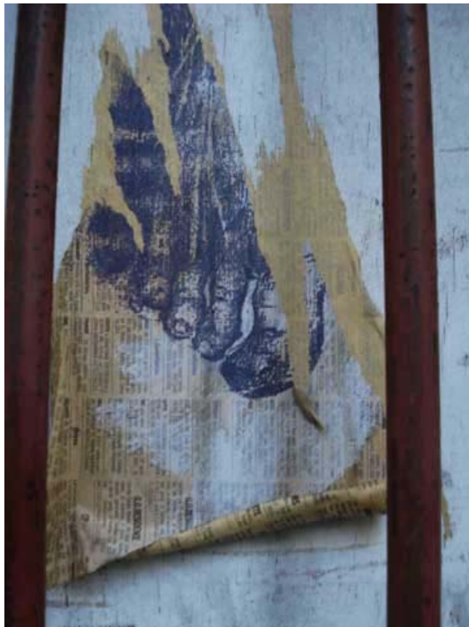
Figura 68 Fernanda Manéa Desenho, Serigrafia, Intervenção e Fotografia Registro 2008