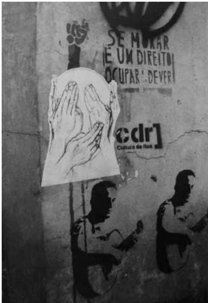
Figura 22 Fernanda Manéa Da série Intervenções II Desenho, Fotocópia, Intervenção e Fotografia 2007 25x20 cm