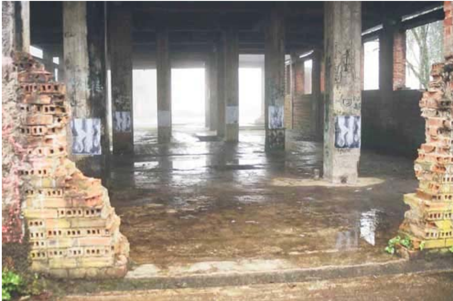
Figura 17 Fernanda Manéa Da série Intervenções I Desenho, Fotocópia, Intervenção e Fotografia 2006 20x25 cm