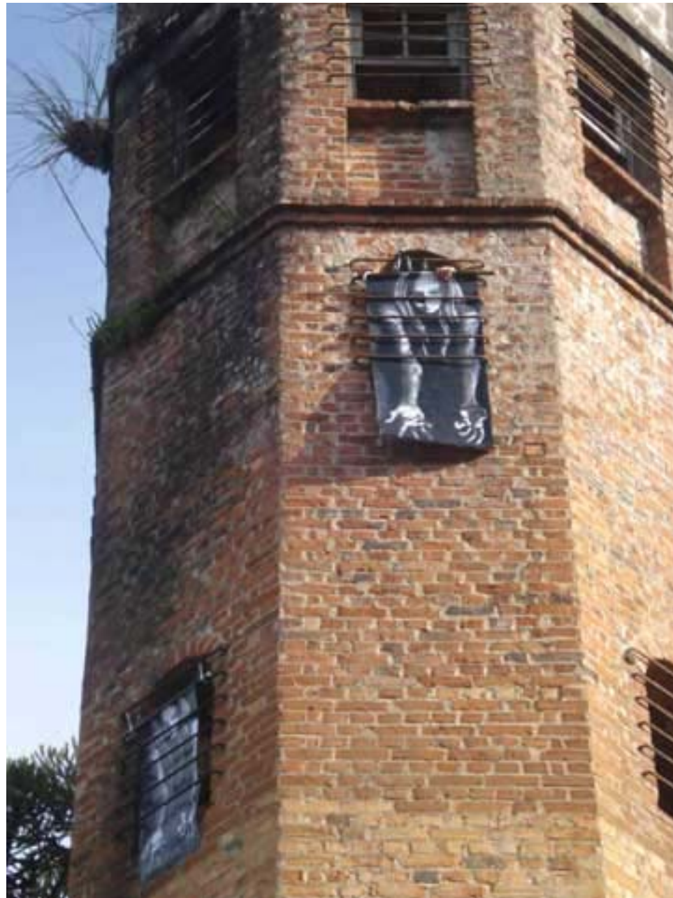
Figura 57 Fernanda Manéa Grupo II Intervenções em espaços autorizados Registro 2008