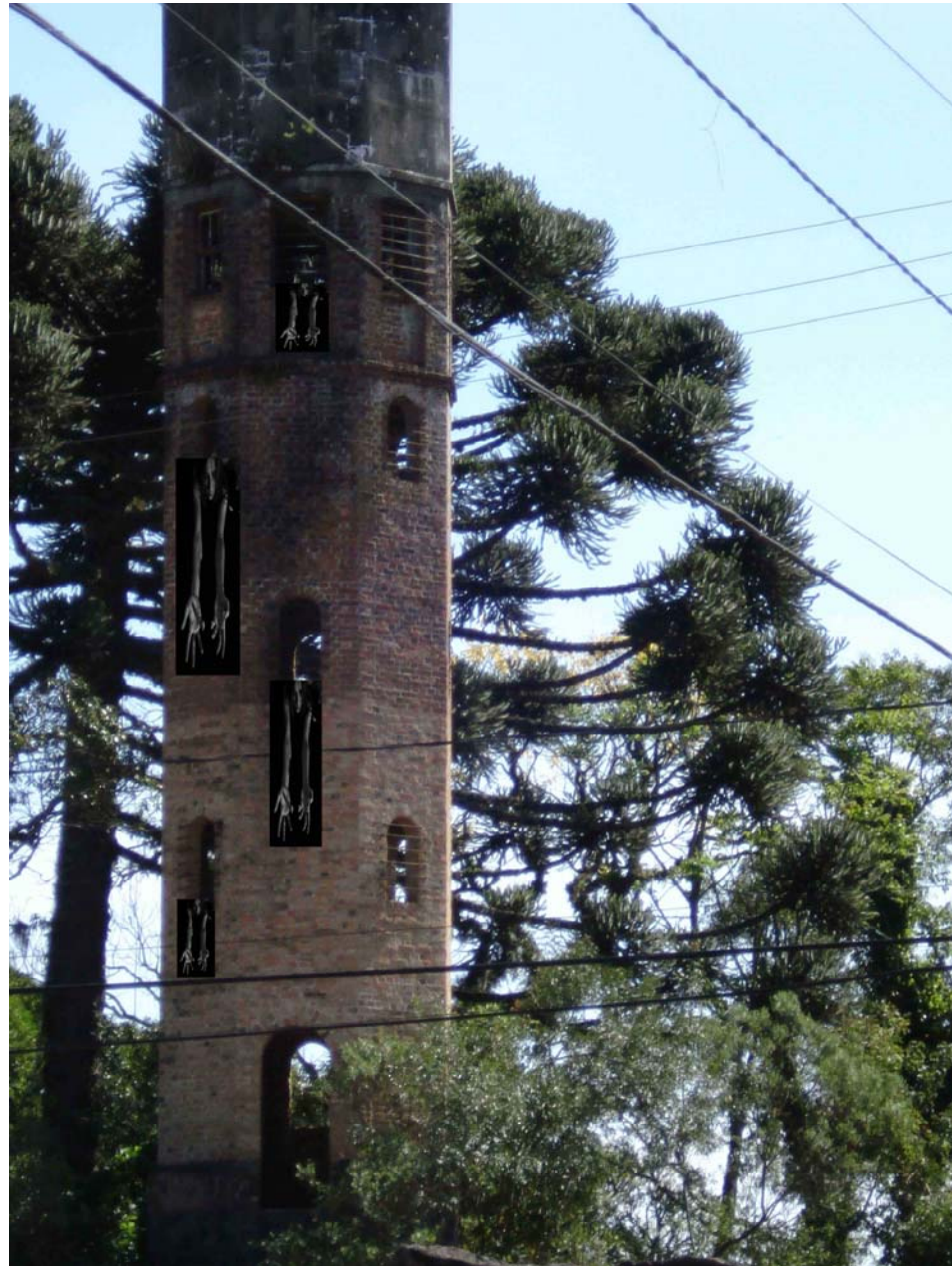
Figura 50 Fernanda Manéa Grupo II Intervenções em espaços autorizados Projeto Digital 2008