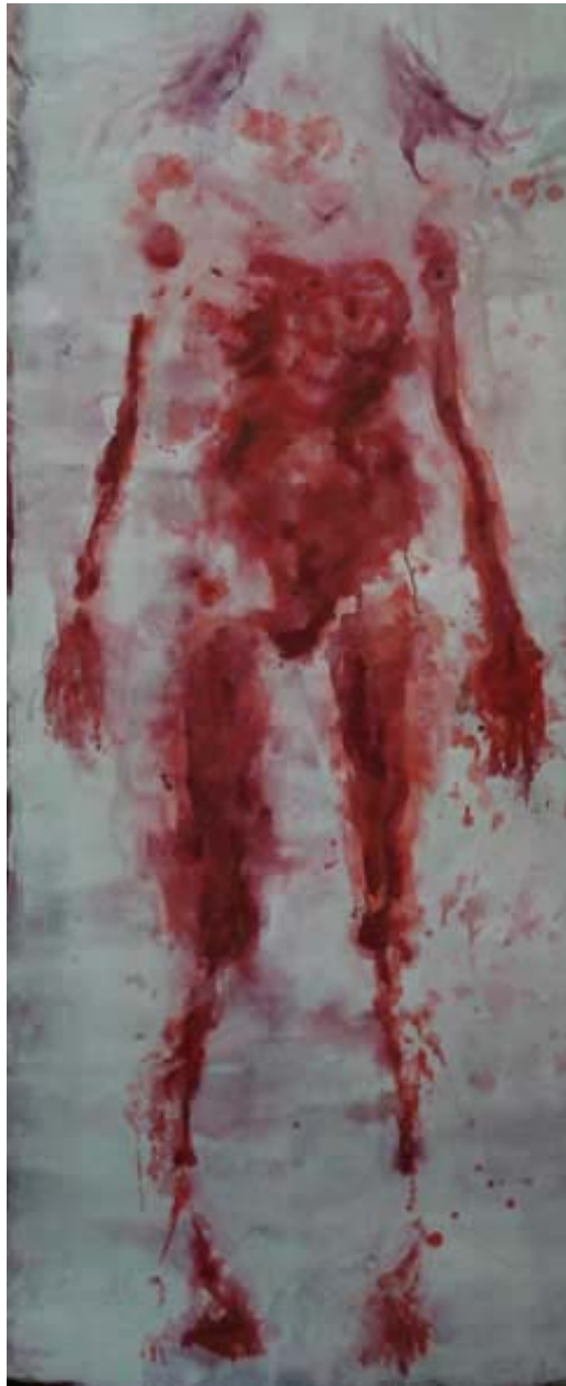
Figura 04 Fernanda Manéa Da série Corpos Suspensos Grafite e acrílica sobre lona 2006 195x 76 cm