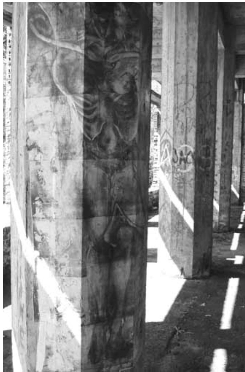
Figura 19 Fernanda Manéa Da série Intervenções I Desenho, Fotocópia, Intervenção e Fotografia 2007 25x20 cm