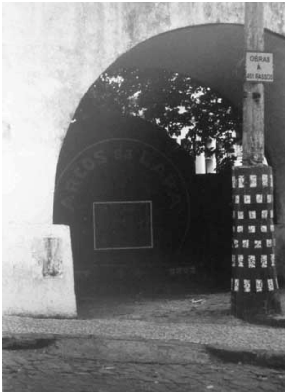
Figura 20 Fernanda Manéa Da série Intervenções II Desenho, Fotocópia, Intervenção e Fotografia 2007 25x20 cm