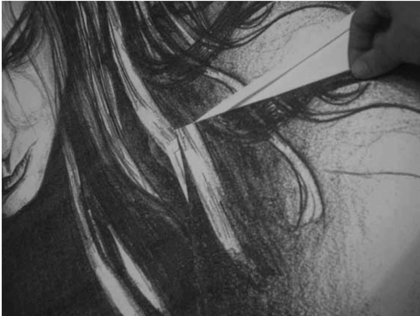
Figura 37 Fernanda Manéa Processos 2008 Detalhe da Colagem 70x100 cm