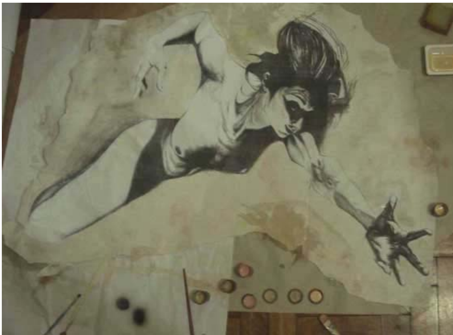
Figura 46 Fernanda Manéa Grupo II Intervenções em espaços autorizados Registro 2008