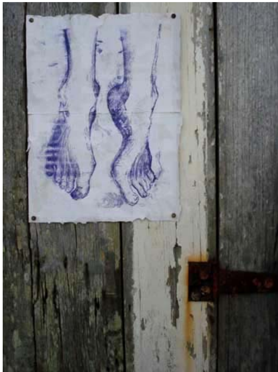
Figura 24 Fernanda Manéa Da série Intervenções III Desenho, Serigrafia, Intervenção e Fotografia 2007 25x20 cm