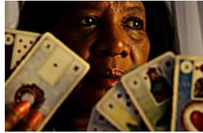
Conheça uma das mais requisitadas cartomantes de Porto Alegre