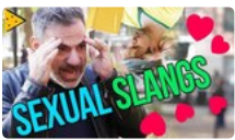
Como falar gírias sexuais em inglês