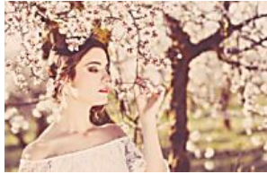
Tendências Verão 2017: Das passarelas para o seu armário