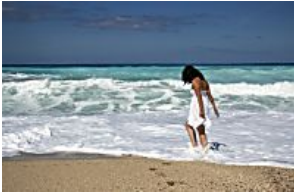
Moda Praia: você já sabe o que usar nesse verão?