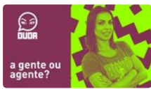
Português com a Duda #04 - a gente