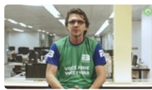
ITA para os Fortes HD