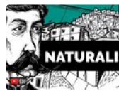
Naturalismo | reVi + Tatiary