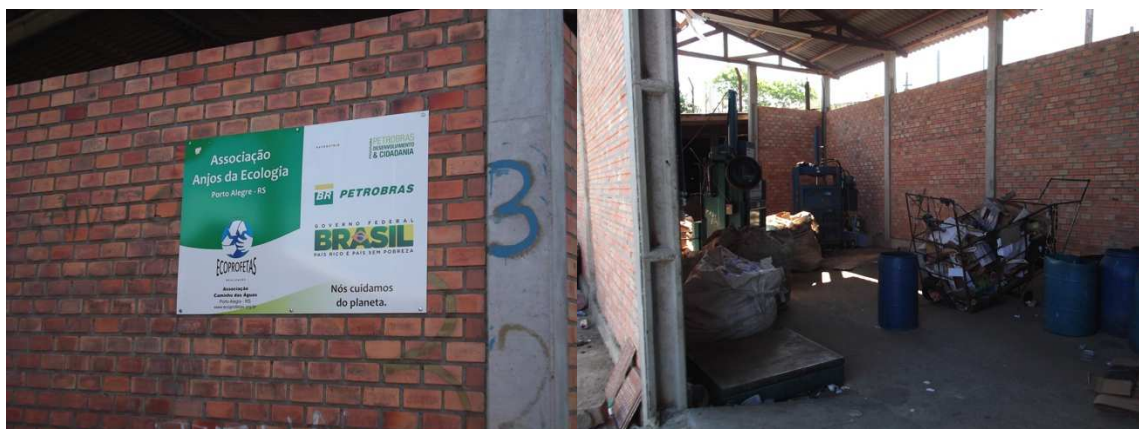
Figura 7 – ONG Ecoprofetaz fornece equipamento e educação ambiental, social e política para os catadores

A assistência prestada por esta organização se dá por intermédio dos educadores, que fazem um trabalho de conscientização, tanto quanto a questão ambiental, quanto em relação a questões como política, direitos e cidadania. A Ecoprofetaz também ajuda mobilizando doações, o que possibilita a compra de maquinário, indispensável para o trabalho de triagem (figura 7).