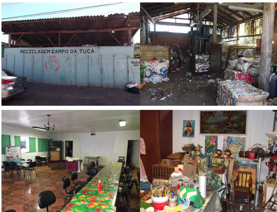
Figura 5 – UT Campo da Tuca: organização a partir da associação comunitária do bairro

Na visita à Unidade de Triagem do Campo da Tuca (figura 5), no bairro São José, verificou-se que esta começou suas atividades no ano de 1994, a partir de iniciativa da Associação Comunitária do Campo da Tuca, que por sua vez existe desde o final da década de 70.