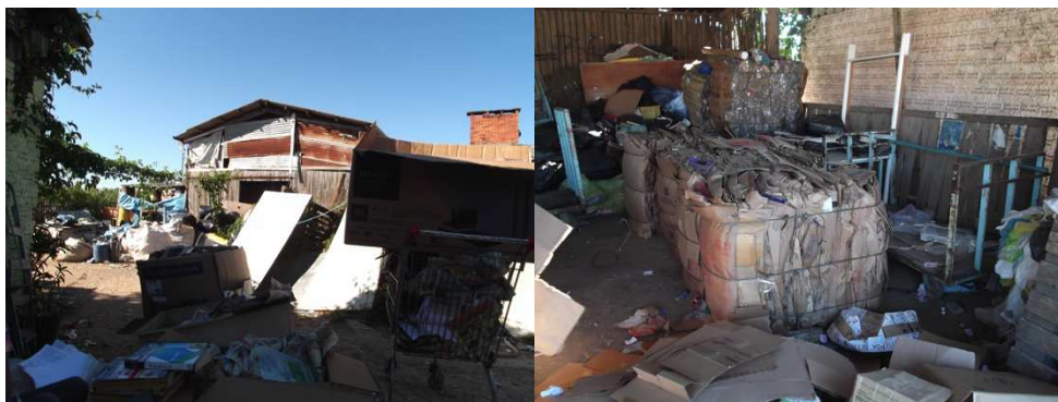
Figura 4 – UT Padre Cacique: galpão mal estruturado e mal posicionado no terreno alagadiço.

que deve envolver um trabalho de campo para a produção de um trabalho acadêmico. A responsável pelo local se chama Sonia Holmes de Mesquita, que fundou a associação e trabalha há mais de 30 anos com serviço social.