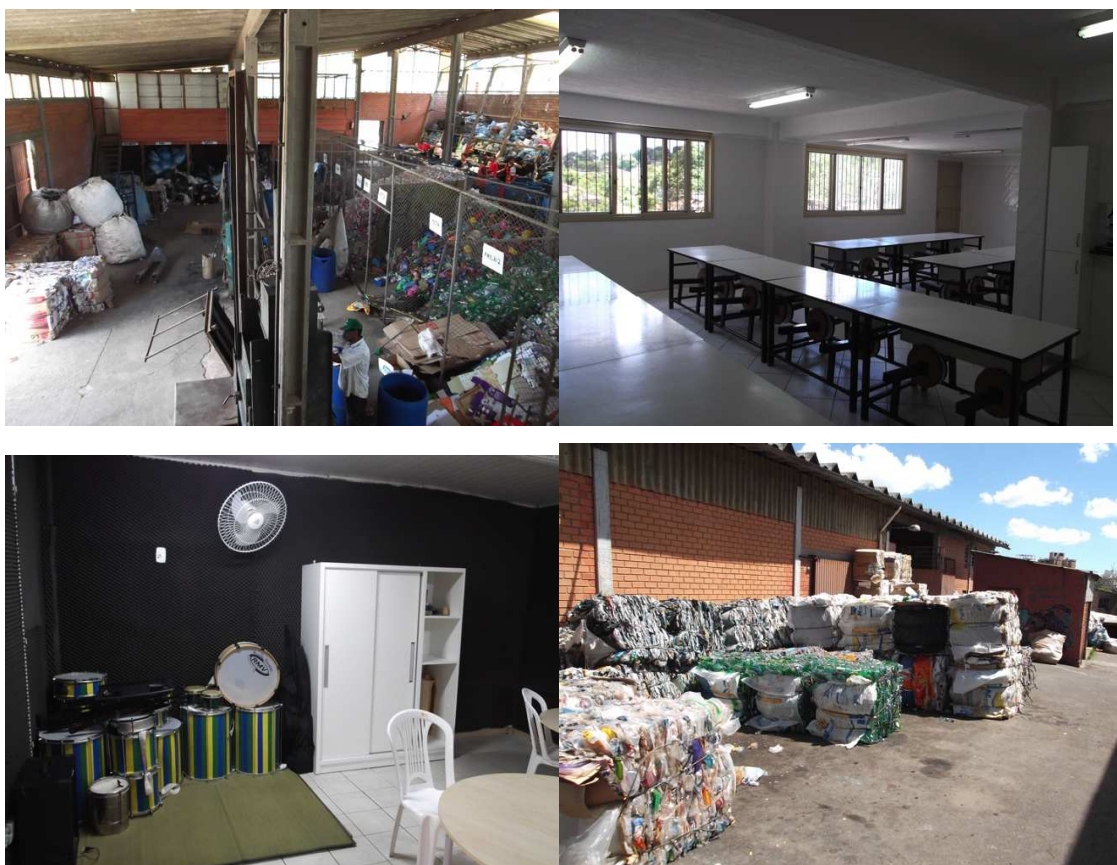
Figura 6 – UT Vila Pinto: trabalho com a triagem possibilitou melhorias para a comunidade.

Na figura 6, pode-se observar que o centro de triagem da Vila Pinto é, definitivamente, um modelo a ser seguido na questão da reciclagem dos resíduos sólidos urbanos.