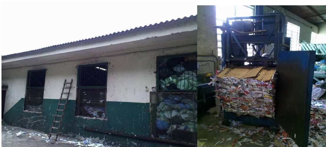
Figura 3 – UT São Pedro: força de trabalho dos pacientes do hospital psiquiátrico.

O fato de a força de trabalho nesta unidade ser composta de pacientes do hospital psiquiátrico gera algumas pequenas diferenças e características peculiares, contudo isso não foi abordado por não se tratar do escopo da pesquisa. Apesar disto, em seus aspectos principais, como a estrutura de trabalho, esta unidade é bastante semelhante às demais.