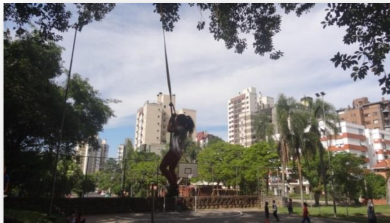
Figuras 1, 2, 3 - Descoberta orientada