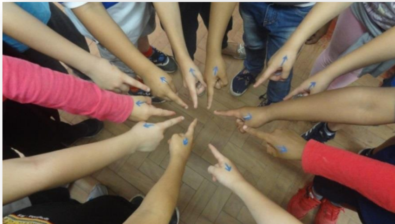
Figuras 5 - Quando aponto um dedo para o outro, lembro que aponto outros três para mim

lembravam de realizar a auto-avaliação. Era um momento de reflexão e de expressão individual, que também se manifestou a partir de desenhos e palavras. Esta atividade nos possibilitou maior proximidade com cada um/a, conhecendo um pouco mais sobre suas particularidades. Foi possível estabelecer um vínculo de amizade com a turma, o que favoreceu um aprendizado rico e marcante para todas as partes, cada uma da sua maneira.