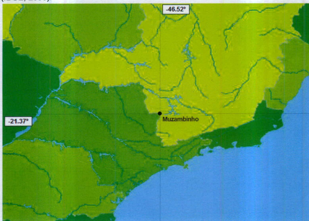
FIGURA 1 – Localização do município de Muzambinho

Segundo o Instituto Brasileiro de Geografia e Estatística (IBGE) a estimativa da população em 2009 foi de 20.426 habitantes. A área é de 409,4 km 2 e a densidade demográfica de 53,60 hab/km 2 (IBGE, 2000).