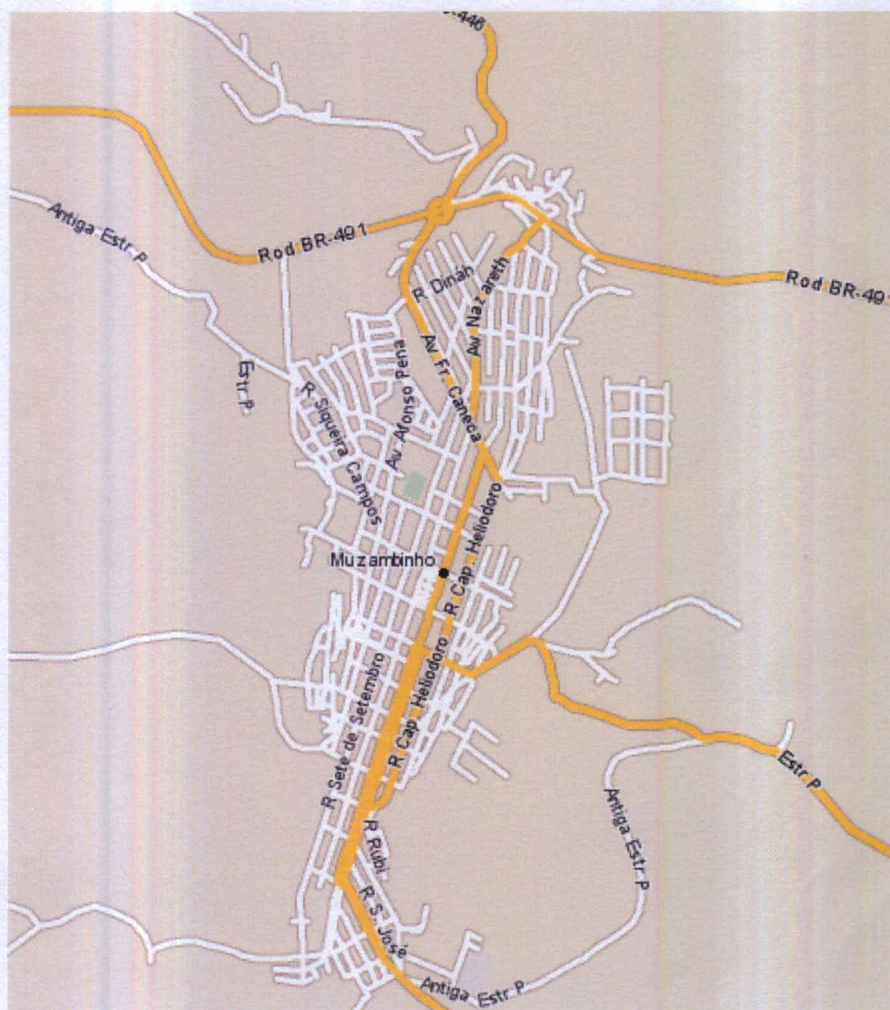
FIGURA 2 - Mapa da zona urbana da cidade de Muzambinho