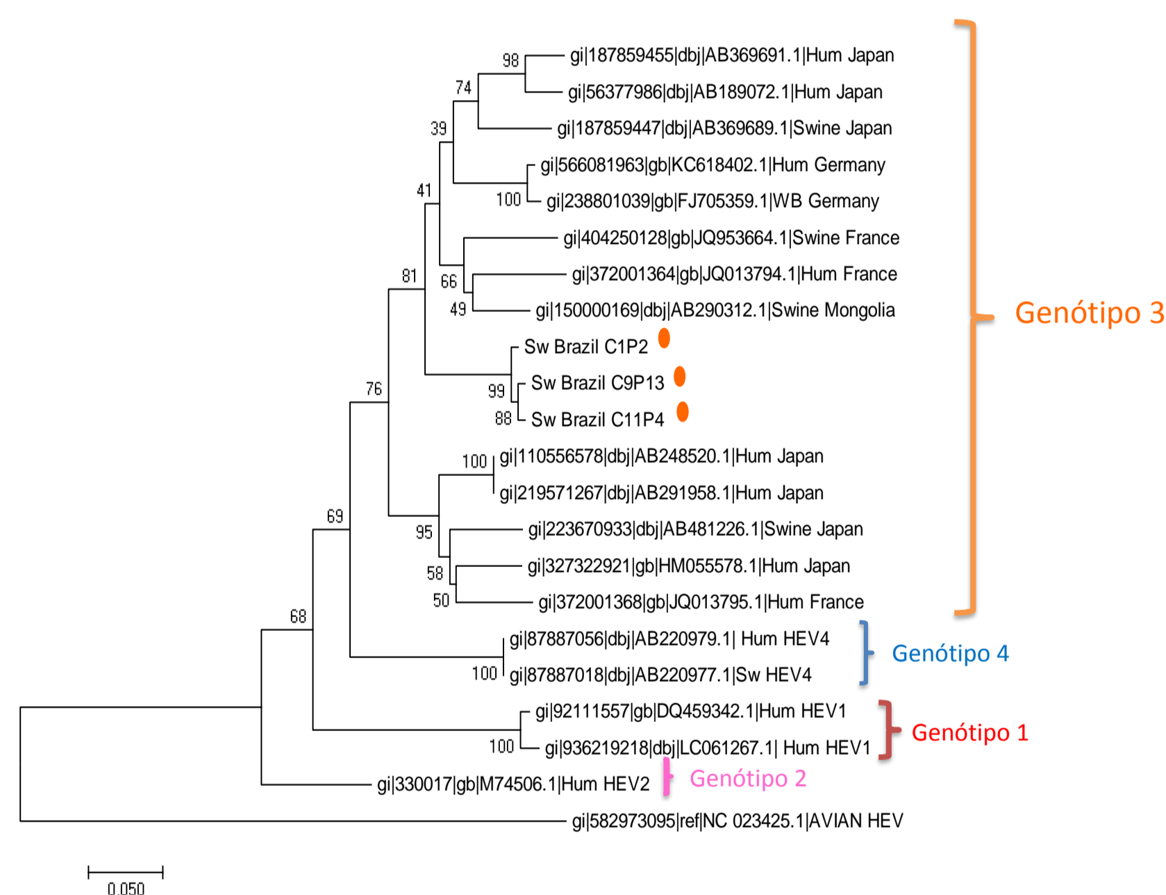
Figura 01: Árvore filogenética contendo as três amostras sequenciadas (●).