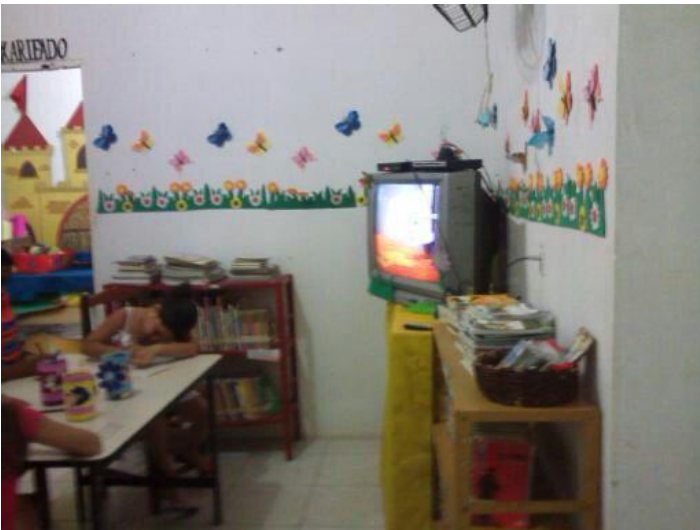
OFICINA DE LEITURA