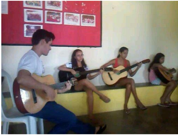
OFICINA DE MÚSICA