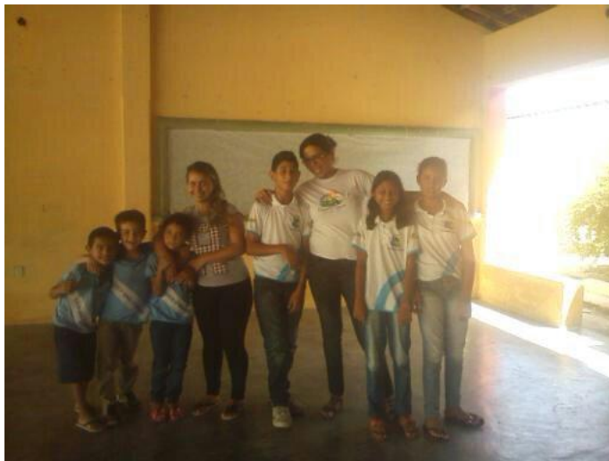
OFICINA DE JOGOS RECREATIVOS