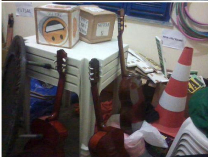
SALA DE MATERIAIS