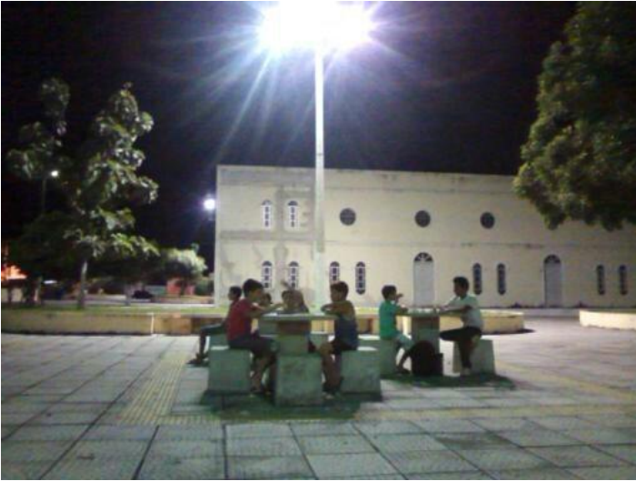
OFICINA DE JOGOS DE TABULEIRO