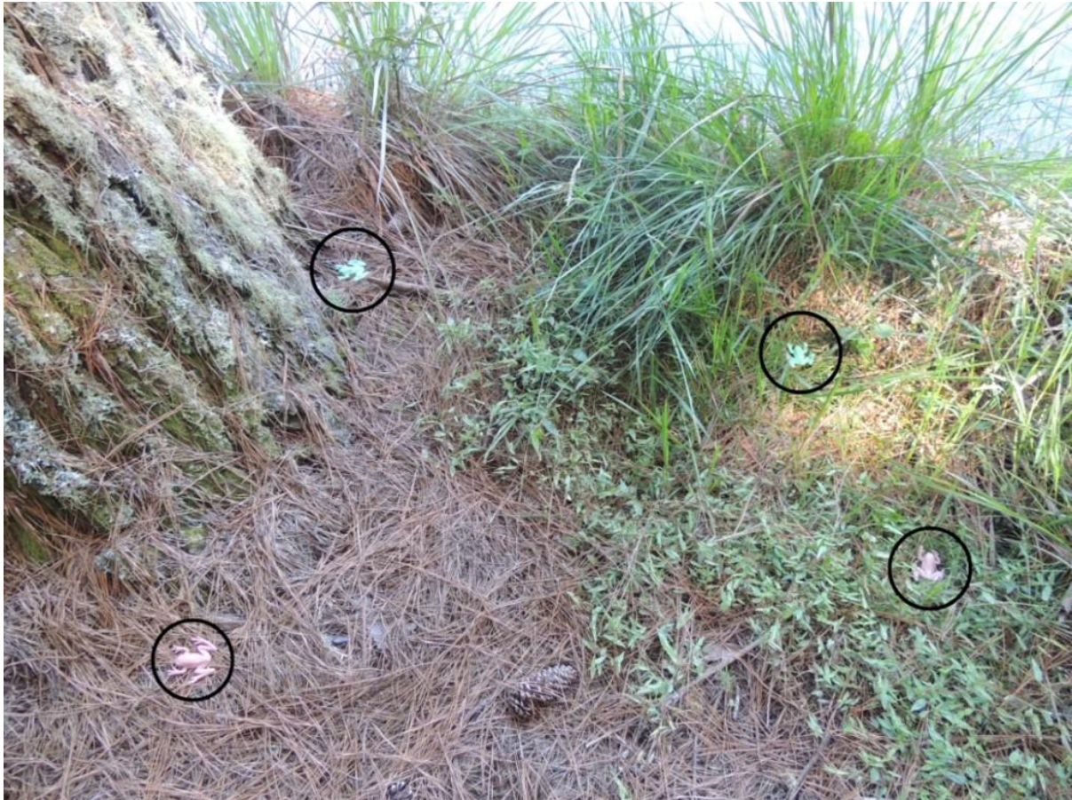
Figura 4. Modelos artificiais de Hypsiboas pulchellus disponibilizados aos potenciais predadores. Os modelos foram dispostos em uma área de aproximadamente um metro quadrado, conforme os tratamentos: MV+AV, MV+AM, MM+AV, e MM+AM; Sendo MV = modelo verde, MM = modelo marrom, AV = ambiente com fundo verde e AM = ambiente com fundo marrom. Os círculos indicam a posição de cada um dos quatro modelos em cada tratamento.