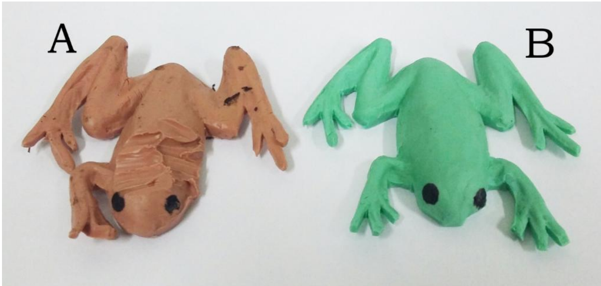
Figura 3. Modelos artificiais, com marcação dos olhos, de Hypsiboas pulchellus nas colorações marrom (A) e verde (B). O modelo artificial marrom (A) possui marcas resultantes de ataques predatórios, possivelmente por mamífero; e o modelo artificial verde (B) encontra-se intacto.

disponibilizados 188 modelos no total, distribuídos em 47 pontos amostrais (blocos) próximos a um corpo d'água. A distância mínima entre os pontos amostrais foi de 100 m.