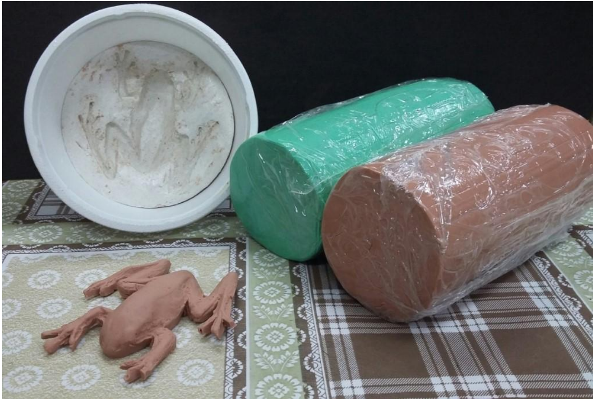
Figura 2. Material utilizado na confecção dos modelos artificiais de Hypsiboas pulchellus na coloração verde e marrom: pré-molde de gesso confeccionado a partir de um indivíduo macho adulto, massa de modelar atóxica nas cores verde e marrom, e modelo artificial sem marcação dos olhos.

Anfíbios e Répteis do Museu de Ciências e Tecnologia da PUCRS. Portanto, os modelos artificiais têm proporções idênticas a um indivíduo real. Com um marcador permanente de cor preta, foi adicionada a marcação dos olhos nos modelos (Figura 3).