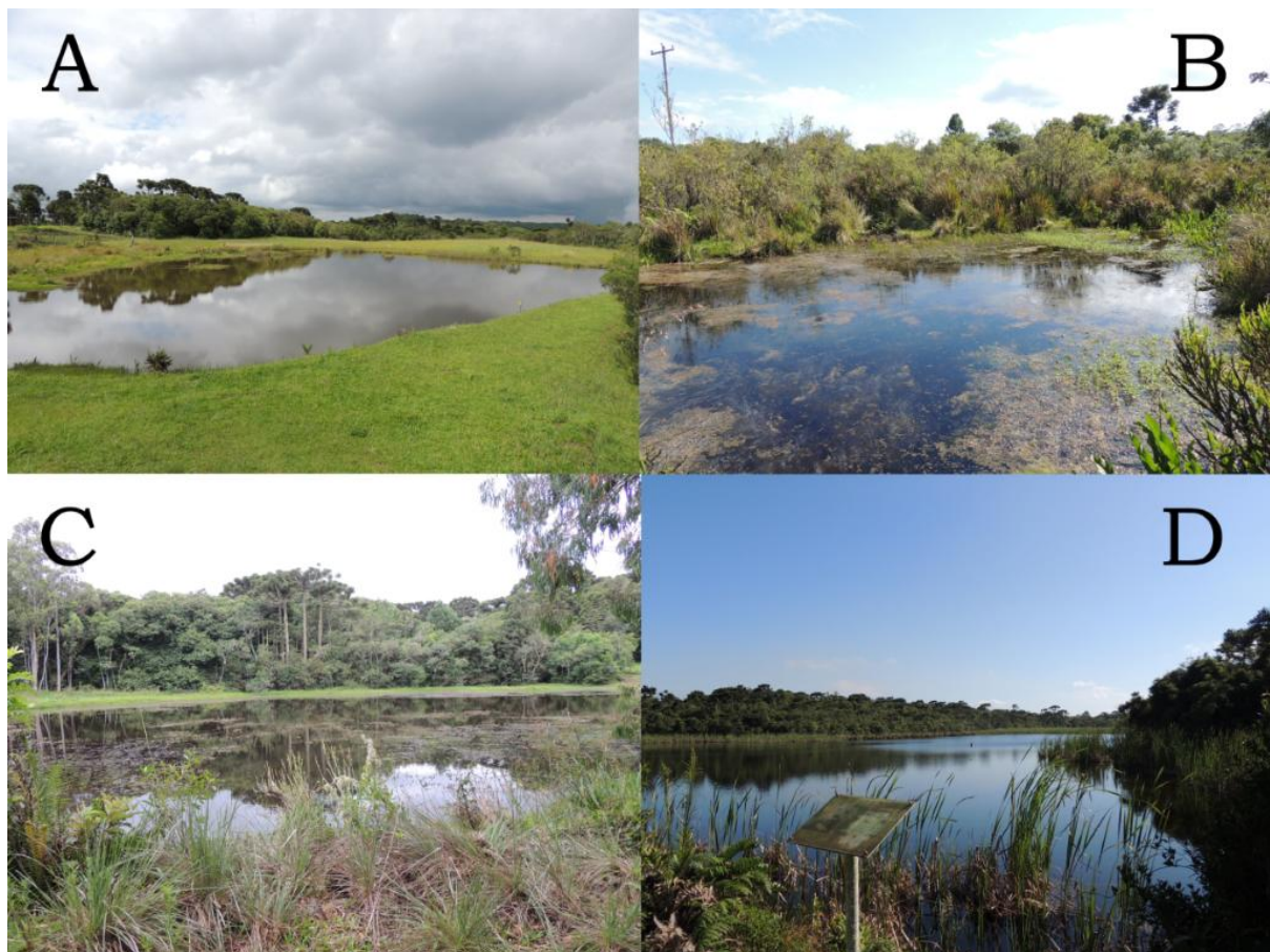
Figura 1. Exemplo de áreas de estudo, sendo elas: Poça 1 (A), Poça 2 (B) e Poça 3 (D) localizadas no CPCN Pró-Mata, São Francisco de Paula, Rio Grande do Sul; e Poça 6 (C) localizada na FLONA de São Francisco de Paula, Rio Grande do Sul.

pluviosidade anual média de 2252 mm e temperatura média de 14,5 °C. A vegetação é caracterizada por um mosaico de zonas de campo e mata (Floresta Ombrófila Mista e Floresta Ombrófila Densa) (Ferreira & Eggers 2008). Foram utilizados três corpos d'água no local, sendo eles: Poça 1 (Figura 1A), localizado nas coordenadas 29°28'49,7"S e 50°10'22,8"W, com diâmetro aproximado de 100 m e borda constituída predominantemente por gramíneas (cerca de 70%) e vegetação emergente (cerca de 30%); Poça 2 (Figura 1B), localizado nas coordenadas 29°28'54,0"S e 50°10'36,3"W, com diâmetro aproximado de 25 m e borda constituída de vegetação arbustiva e emergente em proporções equivalentes; e Poça 3 (Figura 1D), localizado nas coordenadas 29°28'30,1"S e 50°09'51,9"W, com diâmetro aproximado de 500 m e borda constituída de vegetação de mata de araucária e emergente em proporções equivalentes.