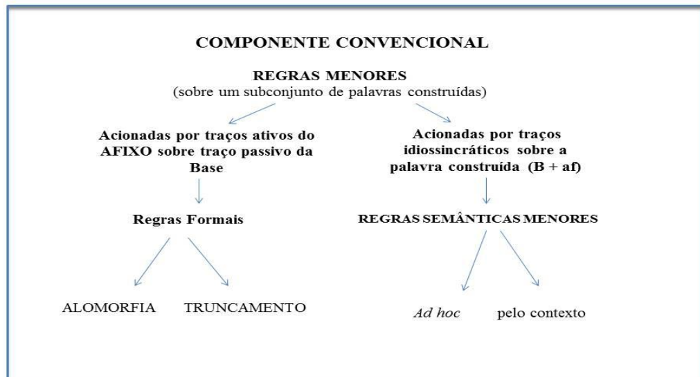
Figura: 04 – Acionamento de Regras Memores. (SANTOS, 2006, p. 78).

A estratificação manifesta-se no fato de a estrutura interna do Componente Lexical e sua correspondente hierarquia de operações nas palavras construídas refletirem a complexidade das relações entre forma e significado características das palavras construídas, relações essas que não podem ser reduzidas à mera dicotomia regular vs. irregular (CORBIN, 1989, p. 31). Em síntese, o modelo é considerado estratificado pelo fato de apresentar um componente lexical da gramática, que é composto de níveis, ao longo dos quais o significado das palavras construídas se edifica.