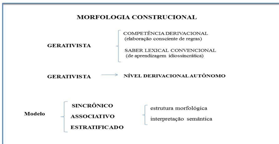
Figura: 02 – Características da Morfologia Construcional. (SANTOS, 2006, p. 69).

Como se vê na figura, a Morfologia Construcional caracteriza-se por seu caráter gerativista, apresentando uma competência lexical em que regras são elaboradas de forma consciente, e um saber lexical, que corresponde às idiossincrasias. Trata-se de um modelo: sincrônico; associativo, que estabelece relação entre forma e significado; e estratificado, dispondo de um componente de base, de um componente derivacional e de um componente convencional.