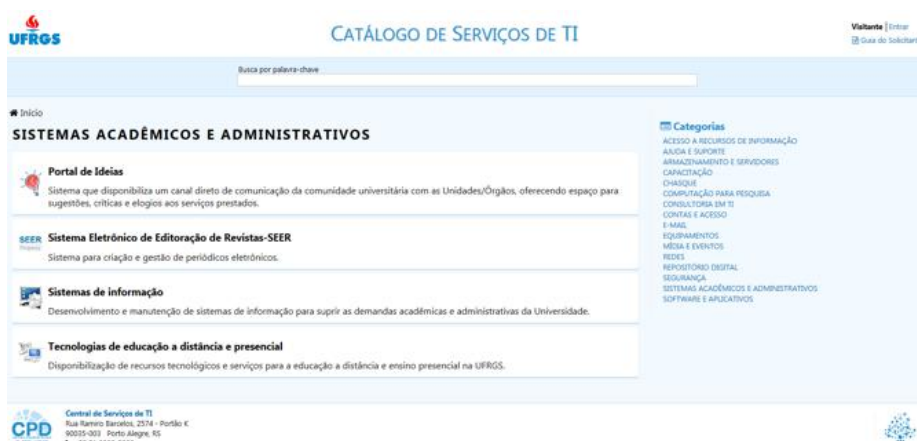
Fig. 4. Visão da categoria Sistemas Acadêmicos e Administrativos, mostrando os serviços a ela relacionados.

Já na apresentação do serviço, a quantidade de informações disponíveis difere se o serviço é um agregador, ou seja, caso tenha serviços relacionados hierarquicamente a ele, que não podem ser solicitados diretamente como, por exemplo, Tecnologias de educação a distância e presencial, como exemplifica a Figura 5. Na seção principal são apresentados apenas o nome, a imagem correspondente (que pode ser o logotipo do serviço ou uma imagem relacionada) e a descrição do serviço, além dos serviços que o compõem, igualmente acompanhados de descrição e imagem de referência, enquanto na seção lateral são apresentados os serviços a ele relacionados.