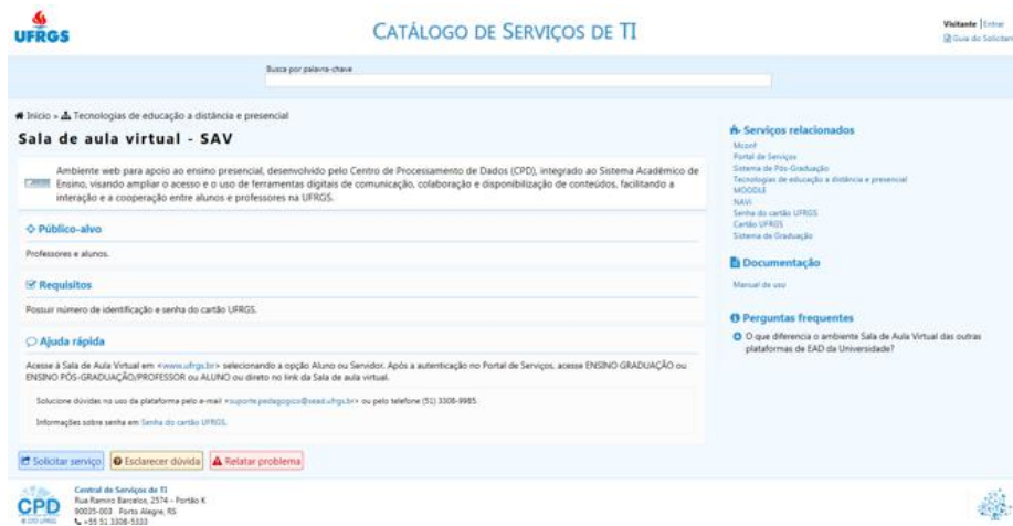
Fig. 6. Visão do serviço Sala de aula virtual - SAV, apresentando todas as informações relacionadas ao serviço e os botões de ação disponíveis aos usuários.

Além do nome, da imagem representativa e da descrição do serviço, são apresentadas as seguintes informações: