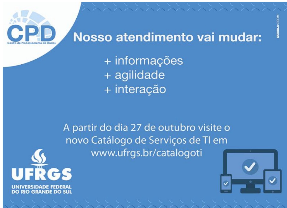
Fig. 2. Banner de divulgação.

Quanto ao produto final, de acordo com a arquitetura de informações proposta pelo Grupo de trabalho, o Catálogo possui 16 categorias que agrupam, até agora, 127 serviços em produção. Somam-se a estes 42 serviços em homologação, ou seja, que estão em desenvolvimento para serem disponibilizados no Catálogo. As categorias dividem os serviços em grandes áreas e são listadas na página inicial como principal opção de navegação para os serviços, podendo um serviço estar inserido em até quatro categorias.