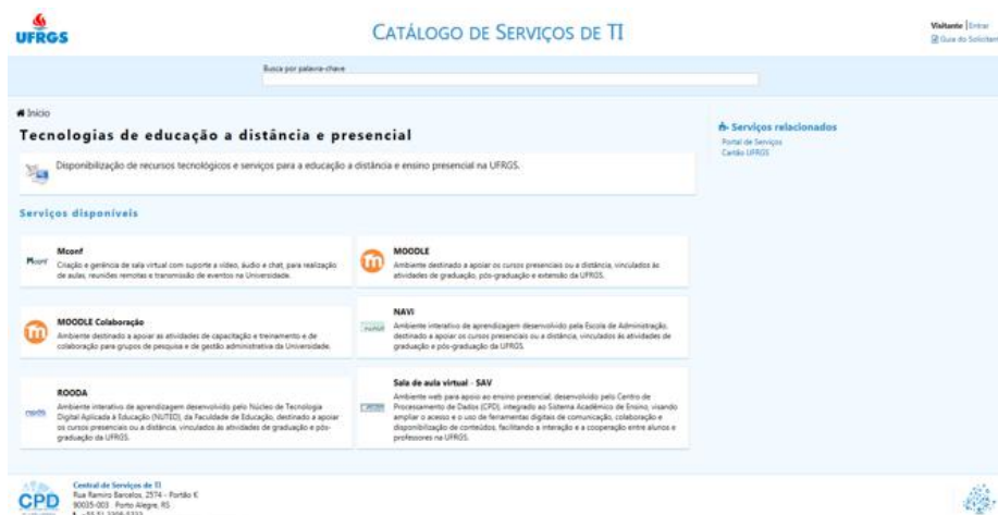
Fig. 5. Visão do serviço Tecnologias de educação a distância e presencial, mostrando os serviços a ele relacionados.

Já na apresentação do serviço, a quantidade de informações disponíveis difere se o serviço é um agregador, ou seja, caso tenha serviços relacionados hierarquicamente a ele, que não podem ser solicitados diretamente como, por exemplo, Tecnologias de educação a distância e presencial, como exemplifica a Figura 5. Na seção principal são apresentados apenas o nome, a imagem correspondente (que pode ser o logotipo do serviço ou uma imagem relacionada) e a descrição do serviço, além dos serviços que o compõem, igualmente acompanhados de descrição e imagem de referência, enquanto na seção lateral são apresentados os serviços a ele relacionados.