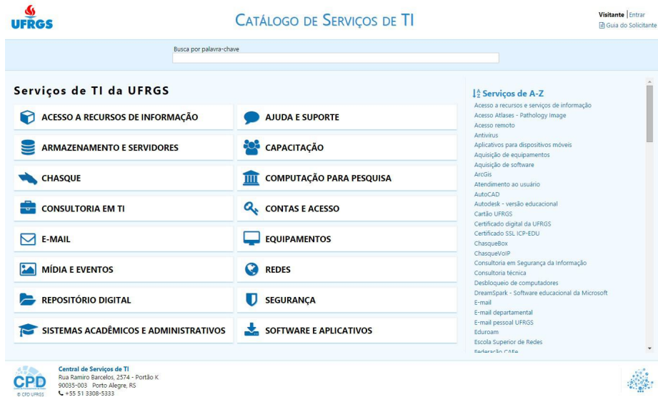
Fig. 3. Página inicial do Catálogo de Serviços de TI da UFRGS.

A paleta de cores utilizada foi construída tendo como base o novo logotipo do CPD, bem como o Portal de Serviços da UFRGS. Os textos ficaram em cor preta, enquanto links e títulos em azul escuro. Foram utilizados ícones para melhor identificar os elementos do Catálogo, em especial, as categorias de serviços. Os ícones utilizados pertencem à fonte de ícones Font Awesome 60 , de código aberto, com licença GPL, exceto o ícone da categoria Chasque, referente ao conjunto de serviços que possuem essa nomenclatura, que foi criado pela equipe do CPD.