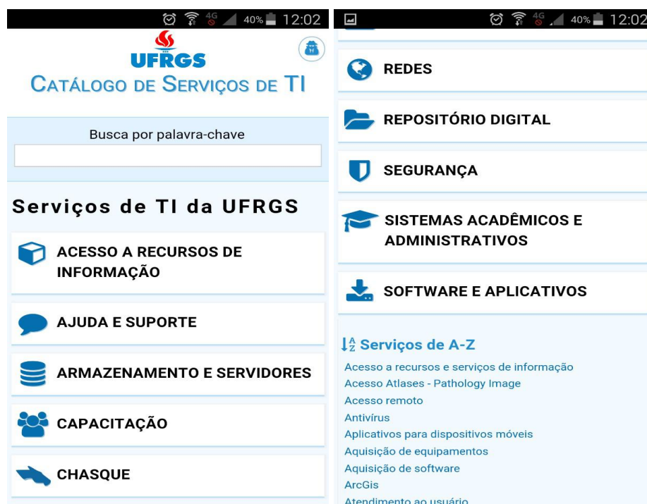
Fig. 7. Tela inicial do Catálogo de Serviços de TI da UFRGS vista em um smartphone .

O site foi construído para adequar-se a dispositivos móveis. Nessas telas de menor tamanho, o topo é reorganizado de modo que o logotipo promocional da UFRGS fique acima do nome do catálogo e a área do usuário fica oculta, sendo acessível a partir de um botão. A seção principal passa a ocupar todo o espaço da tela e as informações em colunas são reorganizadas de modo a formar uma coluna única. Por sua vez, a seção auxiliar passa igualmente a ocupar toda a tela, mas é posicionada abaixo da seção principal. Na Figura 7, apresentada em duas colunas, é exibida a tela inicial em um smartphone . O rodapé é o único elemento da interface que não sofre alteração. [ 9]