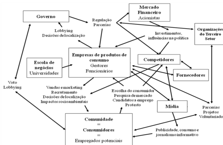
Figura 1 – Mapa da rede de influências para o consumo sustentável.

Assim, frente a esse contexto, cada ator necessita assumir responsabilidades distintas, mas convergentes ao objetivo maior que envolve a reestruturação nos padrões de consumo utilizados. Nessa perspectiva, além das empresas que estão inseridas em diferentes estruturas e que possuem diferentes comportamentos no mercado, outros atores podem ser visualizados nesse sistema, direcionando-se para o consumo sustentável, dentre os quais se destacam: os fornecedores, os competidores, organizações do terceiro setor, as instituições financiadoras, as universidades, a mídia, o governo e os indivíduos (dentro do contexto da comunidade) (MICHAELIS, 2000; 2003; MONT; PLEPYS, 2007; SILVA, 2013). Os quais podem ser mais bem observados na Figura 1: