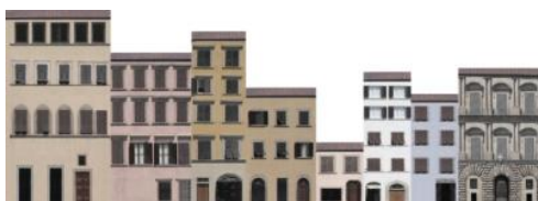
Figura 5 - Cena (2) histórica de Florença com desordem