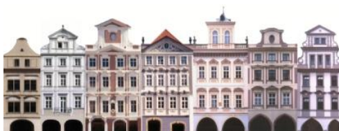
Figura 6 - Cena (3) histórica de Praga com ordem e estímulo