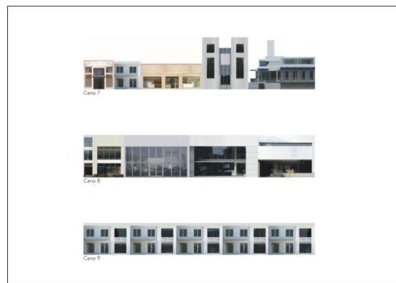
Figura 3 - Prancha com cenas contemporâneas de Porto Alegre