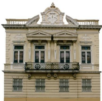
Figura 14 - Palacete Argentina - editado no programa Corel Photo Paint