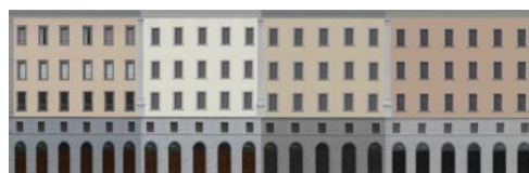
Figura 4 - Cena (1) histórica de Florença com ordem e pouco estímulo