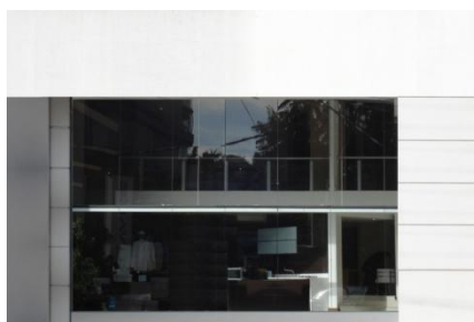
Figura 16 - Loja editada no programa Corel Photo Paint

Foram realizados três testes, incluindo o estudo piloto, e elaboradas mais de cem cenas para verificar a adequação delas às categorias estabelecidas. O estudo piloto, composto do questionário, entrevista e cenas, foi realizado com quinze participantes, sendo cinco arquitetos, cinco não arquitetos com formação superior e cinco pessoas sem formação superior, funcionários e professores da Faculdade de Arquitetura da UFRGS. Os principais objetivos do estudo piloto foram: