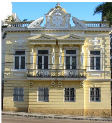
Figura 13 - Palacete Argentina - tombado pelo Iphan

responsáveis por preservar o patrimônio cultural. Essas cenas possibilitam a análise do impacto estético de cenas com distintos níveis de familiaridade e de valor histórico. As cenas contemporâneas de Porto Alegre são formadas por edificações comerciais construídas a partir de 1990 que não se caracterizam como obras arquitetônicas de referência e/ou de divulgação pela mídia. As edificações nas nove cenas possuem, no máximo, quatro pavimentos, de maneira que as cenas históricas e contemporâneas guardem uma relação de escala e correspondam às categorias de ordem com estímulo, ordem com pouco estímulo e desordem. As fotografias das edificações foram editadas no programa Corel Photo Paint visando às montagens de cenas sem distorções e sem pessoas, veículos, sombras e elementos urbanos, tais como vegetação, postes e fios de luz, e lixeiras, que pudessem interferir na avaliação estética das cenas (por exemplo, Figuras 13 e 15). Ainda, foram realizadas alterações na composição de algumas edificações, de modo a adequá-las às cenas (por exemplo, Figuras 14 e 16). Assim, as cenas foram caracterizadas por montagens fotográficas que respondessem aos objetivos da investigação.