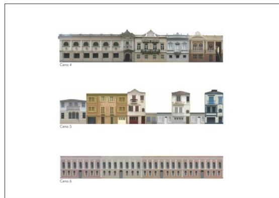
Figura 2 - Prancha com cenas históricas de Porto Alegre