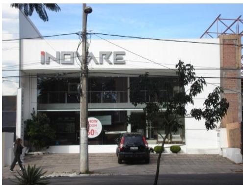
Figura 15 - Loja Inovare - edificação contemporânea