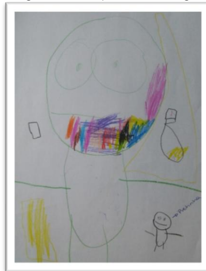
Figura 10 – Desenho do livro “Pretinha de Neve (último personagem à direita) e os Sete Gigantes” por Thor.

Como podemos ver nos desenhos acima, o enfoque é dado ao personagem do gigante, deixando de lado Pretinha, que é a personagem principal da história. Enquanto eu contava a história, eram recorrentes as perguntas sobre o gigante, sobre a hora em que ele apareceria e como ele era. Desse modo, a personagem passou a ocupar um lugar secundário e, desse modo, surgiram os desenhos que enfocam e trazem à tona personagens grandes e fortes. Kaercher e Dalla Zen (2012) atentam que, por vezes, a questão racial passa despercebida, pois fica ocultada por outros fatores que envolvem o personagem, seja para a masculinidade, maneira com a qual se portam ou como a classe a qual pertence. É o que