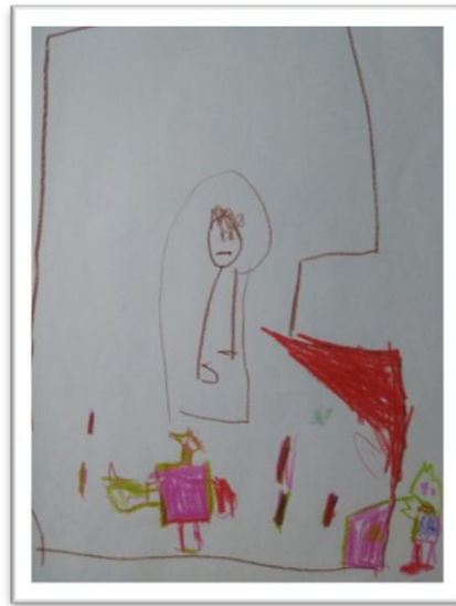
Figura 9 – Desenho do livro “Pretinha de Neve (último personagem à direita) e os Sete Gigantes” por Ana.