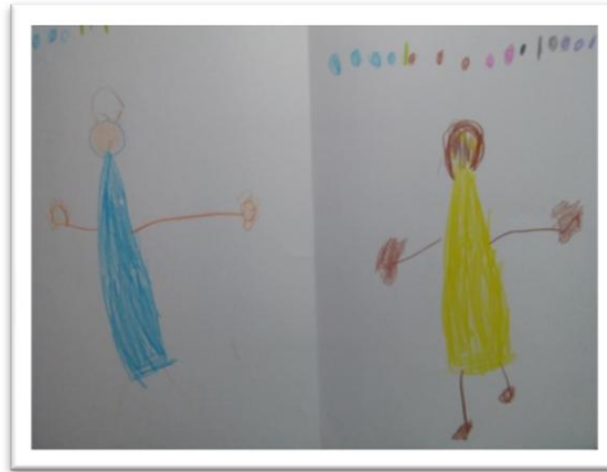
Figura 7 – Branca de Neve (à direita) e Cinderela (à esquerda) por Homem-Aranha.

Quando pedi às crianças que fizessem desenhos, utilizei a seguinte frase: “Pessoal, agora que já conversamos sobre os livros, vamos fazer um desenho sobre eles!”.