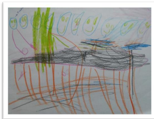
Figura 8 – Desenho do livro “Pretinha de Neve (último personagem à esquerda) e os Sete Gigantes” por Cinderela.

Nas produções acerca do livro “Pretinha de Neve e os Sete Gigantes” temos desenhos variados, mas que evidenciam que, para eles, o ponto marcante da história não era Pretinha, mas sim os gigantes.