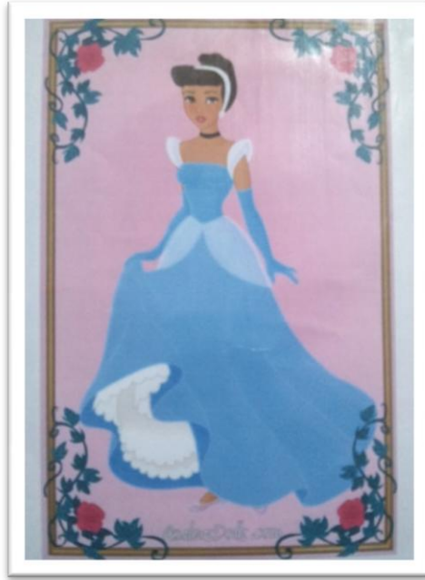
Figura 2 – Livro “Cinderela” Cristina Marques (2012)