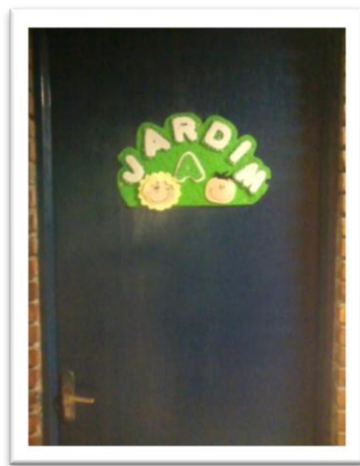
Figura 1 – Fotografia da porta de entrada da sala de aula.

Para iniciar esse subcapítulo, trago uma imagem sobre a qual podemos nos debruçar e discutir alguns aspectos: