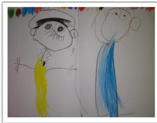
Figura 5 – Branca de Neve (à esquerda) e Cinderela (à direita) por Thor

Com essa citação, podemos pensar os desenhos dos alunos representados a seguir são repletos de significados de uma cultura racista que os cerca, seja na escola, em casa ou em qualquer outro lugar. Vemos a seguir algumas das produções das crianças sobre Branca de Neve e os Sete Anões e Cinderela: