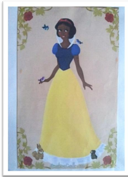
Figura 3 – Livro “Branca de Neve” Cristina Marques (2012)