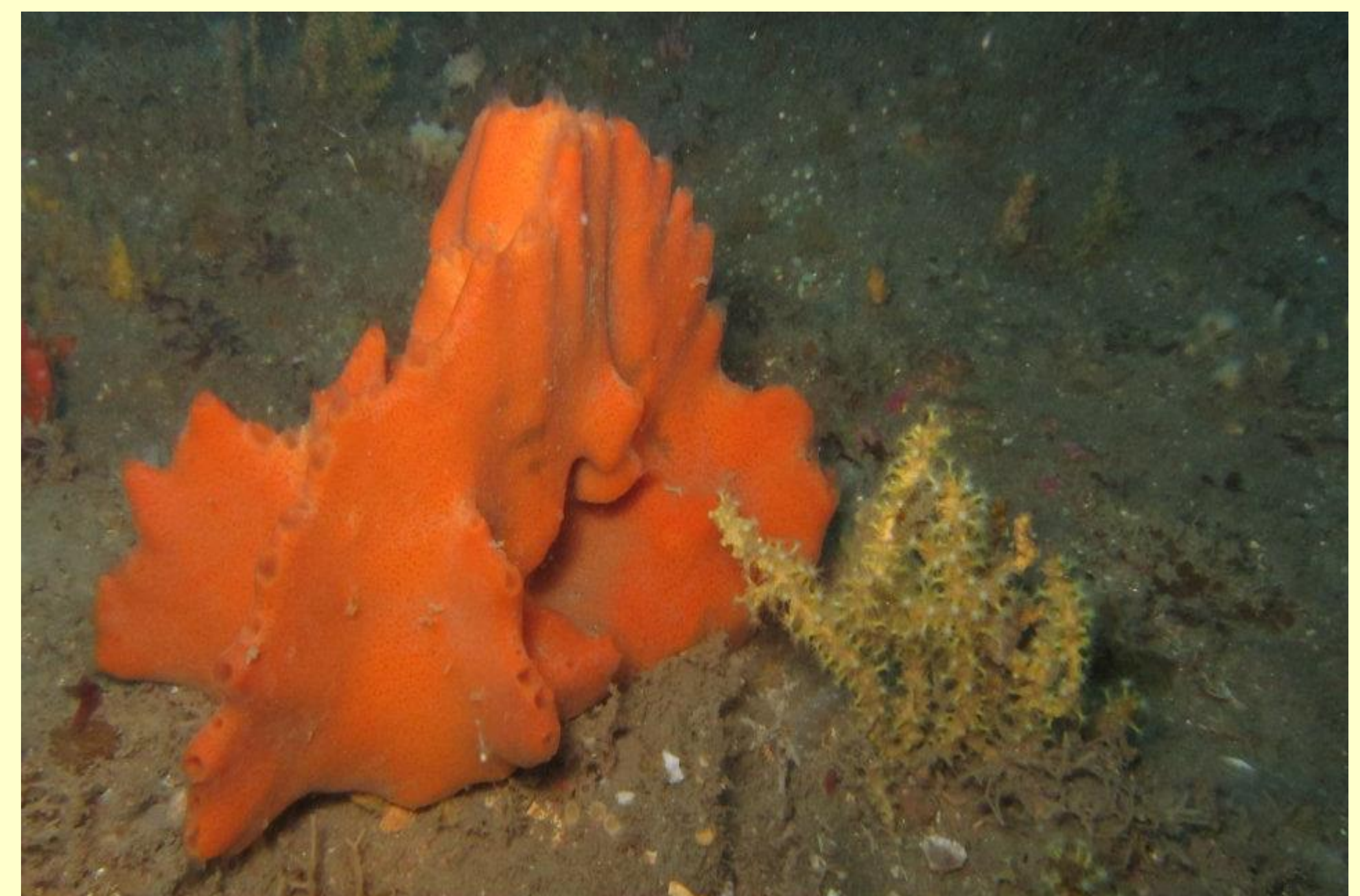
■ Registros fotográficos do ambiente do 'Parcel de Torres', no litoral norte do RS (Dez 2012).