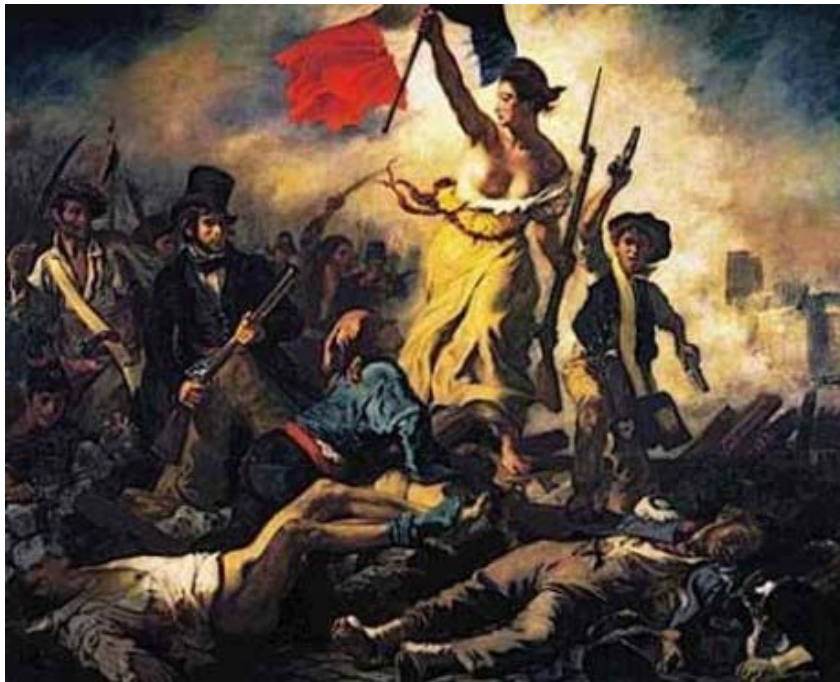
A liberdade guiando o povo