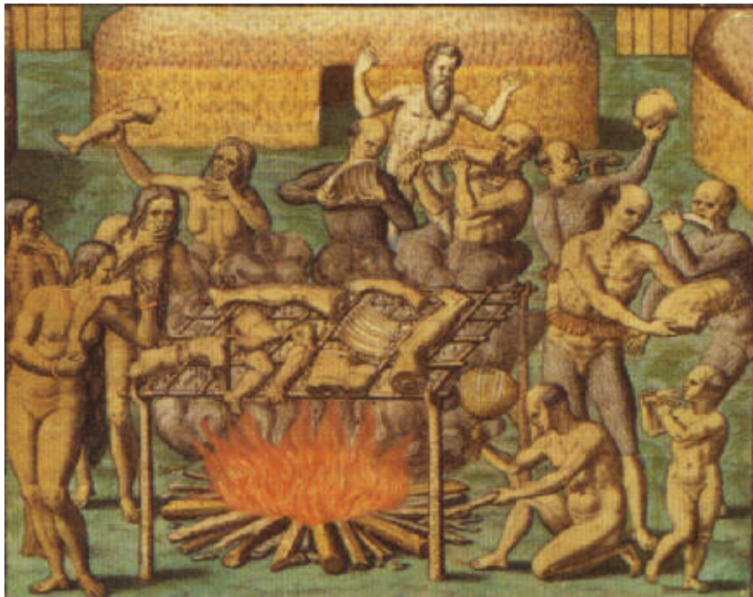
A cozinha antropófaga dos Tupinambás do Brasil