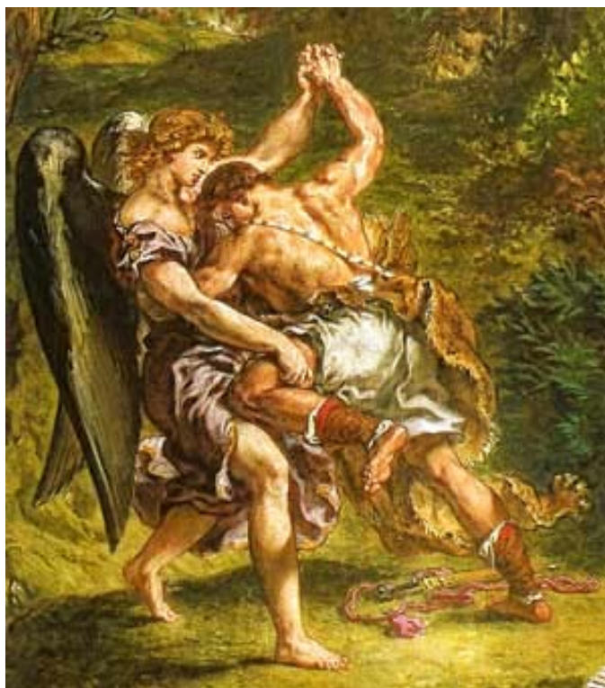
A luta de Jacó com o anjo