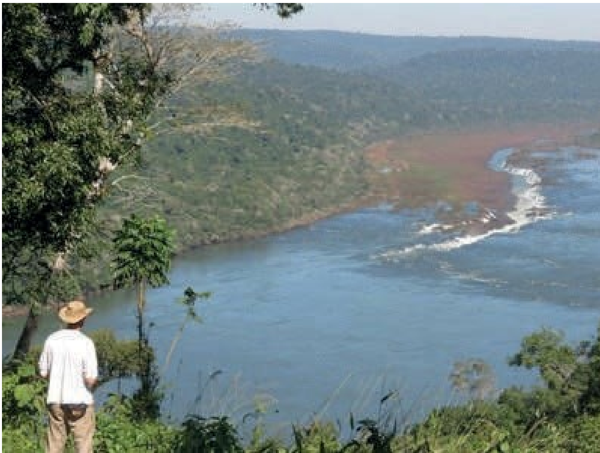
Figura 1 – Ribeirinho contempla o Salto do Yucumã da margem Argentina do Rio Uruguai. Relação dos moradores do local com o rio é complexa, marcada por afetos