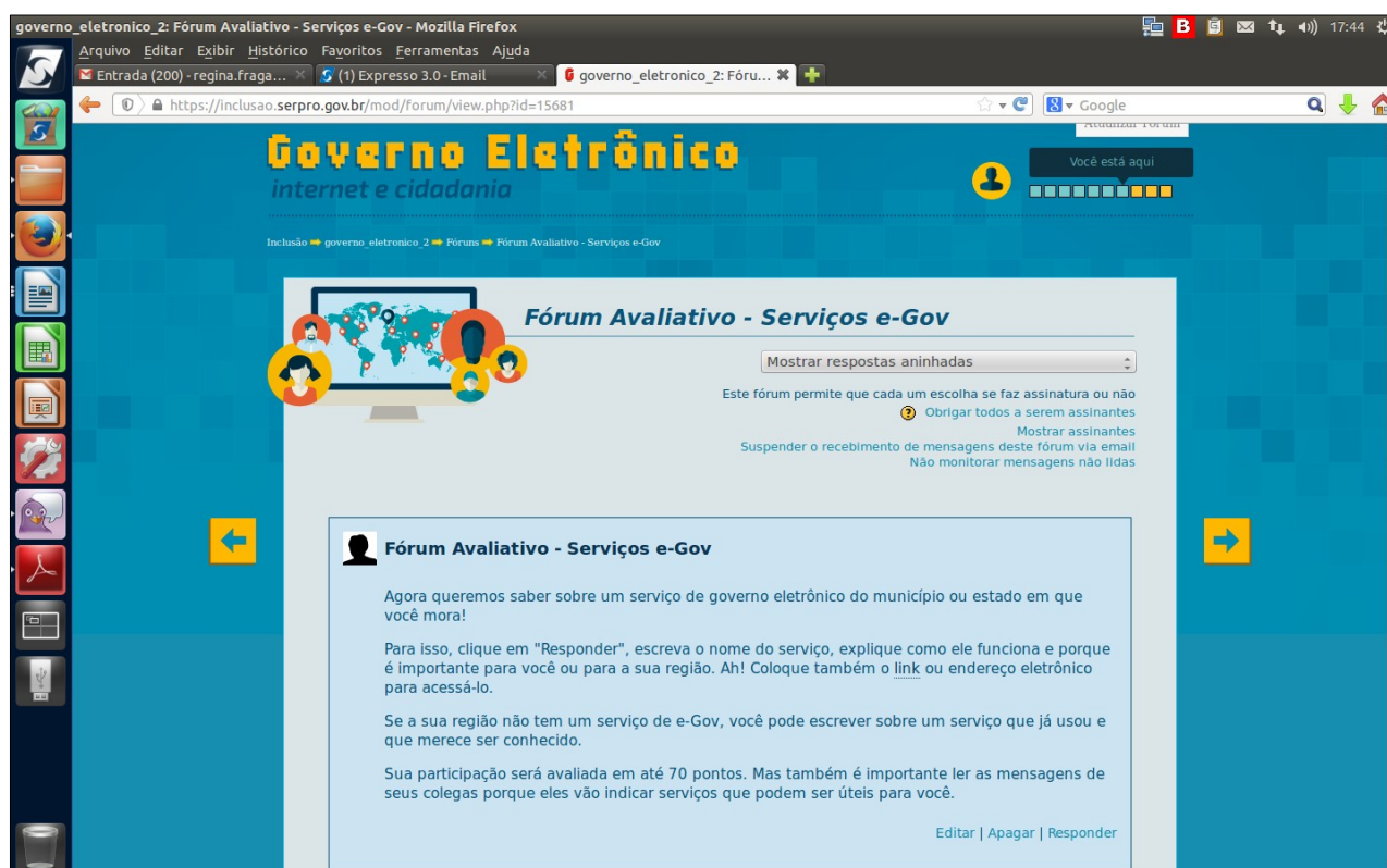
Figura 5 – Fórum avaliativo do curso Governo Eletrônico

Também Kolb (1984), responsável pela formulação da teoria da aprendizagem experiencial, e baseado no postulado histórico-cultural encontrado em Vygostsky, afirma que a aprendizagem é um processo social, que não existe apenas em livros, fórmulas matemáticas ou sistemas filosóficos. Ela requer interatividade para interpretação e elaboração dos conteúdos a serem entendidos.