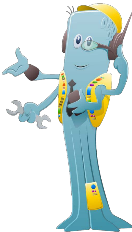
Figura 2 – Sr. Governo

Fonte: Ilustração do curso Governo Eletrônico