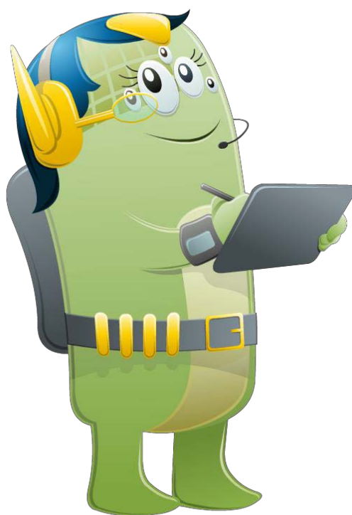
Figura 3 – Sra. Sociedade

Fonte: Ilustração do curso Governo Eletrônico