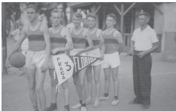
Ilustração 3. Club de Basquetebol da Praça nº 3 Florida.

Imagens encontradas dos clubs formados nas praças chamaram-nos a atenção para alguns detalhes. Os integrantes perfilados seguravam as flâmulas que, com as inscrições “Praça número 2” e “Praça número 3”, delimitam seu espaço. Percebe-se que aquela ação registrada nas fotografias deixava saber as seguintes informações: a que ou a quem eles representavam; quem eram; de onde vinham; e por quem jogavam. Chartier (1990, p. 20) expõe-nos uma das funções da representação como “exibição de uma presença, como apresentação pública de algo”; e é nesse sentido que os clubs das praças e suas práticas, enquanto atividades sociais produtoras de significados e sentidos, revelavam-se independentes e providos de uma lógica inerente ao contexto social em que eram produzidas (WAGNER, 1998).