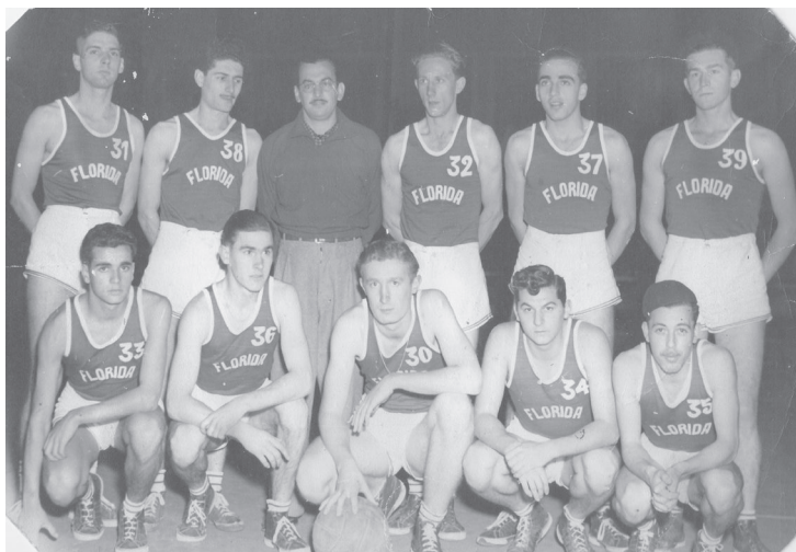
Ilustração 5. Equipe do Florida Atlético Clube, Praça Florida.

Na visão dos reclamantes, o ideal seria a realização de campeonatos entre praças, sagrando-se campeãs das competições equipes que nelas fossem formadas; e, principalmente, que os “clubsinhos” tivessem liberdade para frequentar e utilizar os equipamentos da praça. O que podemos constatar é que, mesmo após essa reclamação formal veiculada no jornal da cidade, os campeonatos e torneios nas praças multiplicavam-se. Encontramos várias notas de jornais registrando o excelente desempenho dos rapazes da Praça A ou das senhoritas da Praça B nas competições.