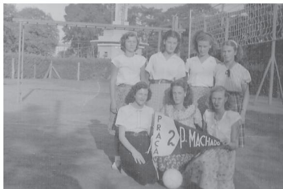
Ilustração 4. Club de Voleibol da Praça nº 2 Pinheiro Machado.