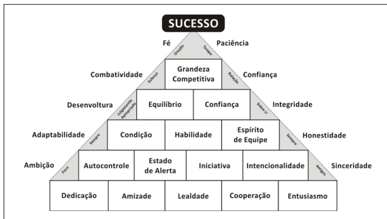
Figura 2: Pirâmide do sucesso

Em 1948, John Wooden, interessado na formação – comportamento, atitude, valores e qualidade – de seus atletas-estudantes de basquetebol da University of California em Los Angeles (UCLA), estabeleceu uma estrutura de valores a qual chamou “Pirâmide do Sucesso” (Figura 2). Perguntado sobre a essência do seu modelo, ele responde: “Minha definição de sucesso e a Pirâmide que estabelece como alcançá-lo englobam tudo que faço como treinador, professor e líder” (WOODEN; JAMISON, 2010, p. 47). A ideia era a de organizar uma estrutura baseada em valores que deveriam apoiar, estimular e inspirar todas as ações pedagógicas de Wooden na direção da formação de uma equipe forte, organizada, inspirada, dedicada e atenta.