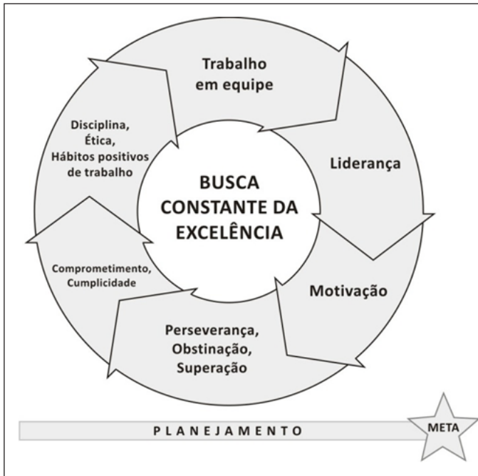
Figura 3: A Roda da Excelência

a essência da sua liderança está registrada na própria Pirâmide do Sucesso. Podemos concluir que, em ambos os modelos, a liderança, assim como a ética (descritas por Bernardinho e não anotadas por Wooden), perpassam, sendo registradas ou não, as suas fórmulas/modelos.