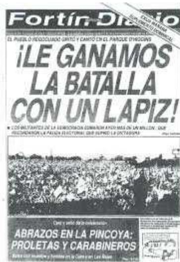
Figura 3 Diário Fortín Mapocho

Disponível em http://sigloscuriosos.blogspot.com.br/2007/12/el-ms-importante-plebiscito-en-la.html Acesso 12/11/2014