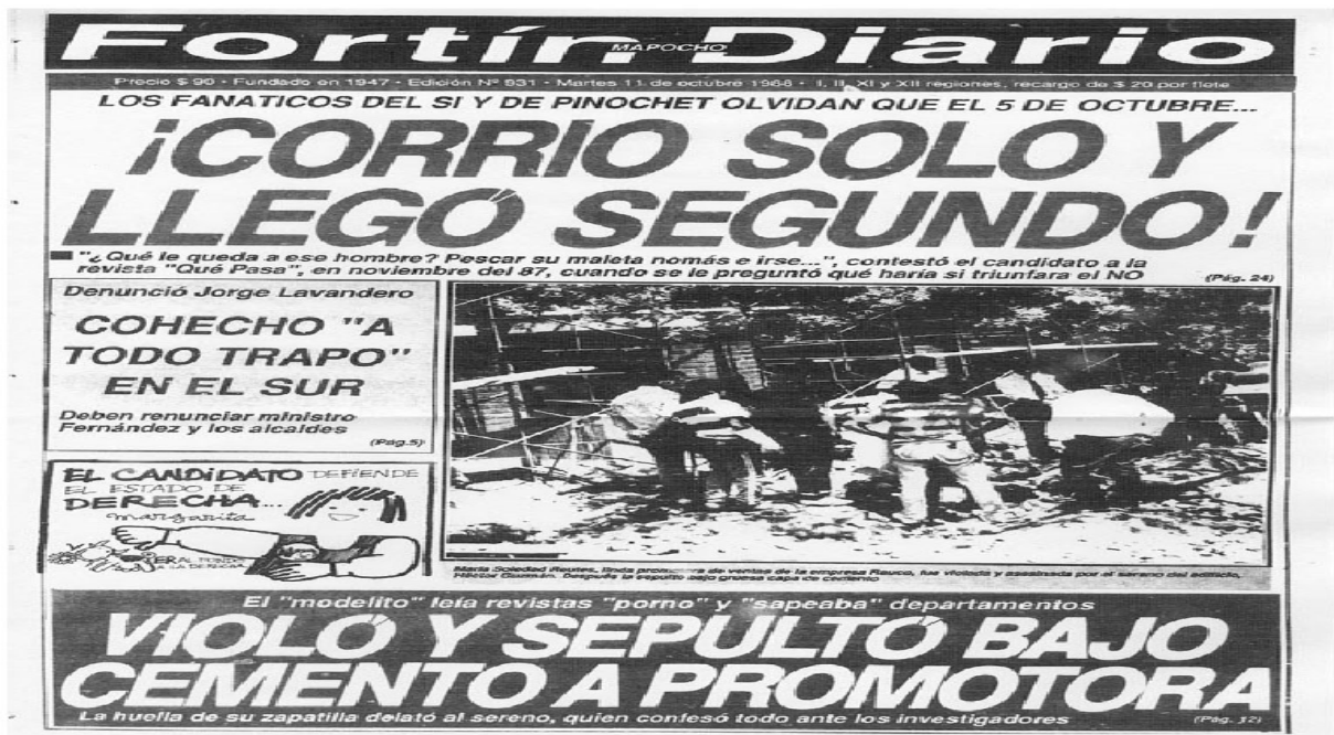
Figura 2 Capa do jornal de oposição Fortín Mapocho , após o resultado final do plebiscito