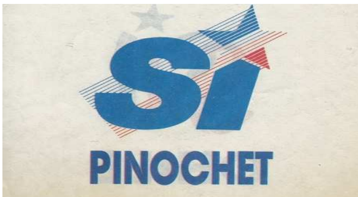
Figura 4 Logo da campanha de Pinochet para o plebiscito de 1988

Disponível em http://es.wikipedia.org/wiki/Plebiscito_nacional_de_Chile_de_1988 Acesso 12/11/2014