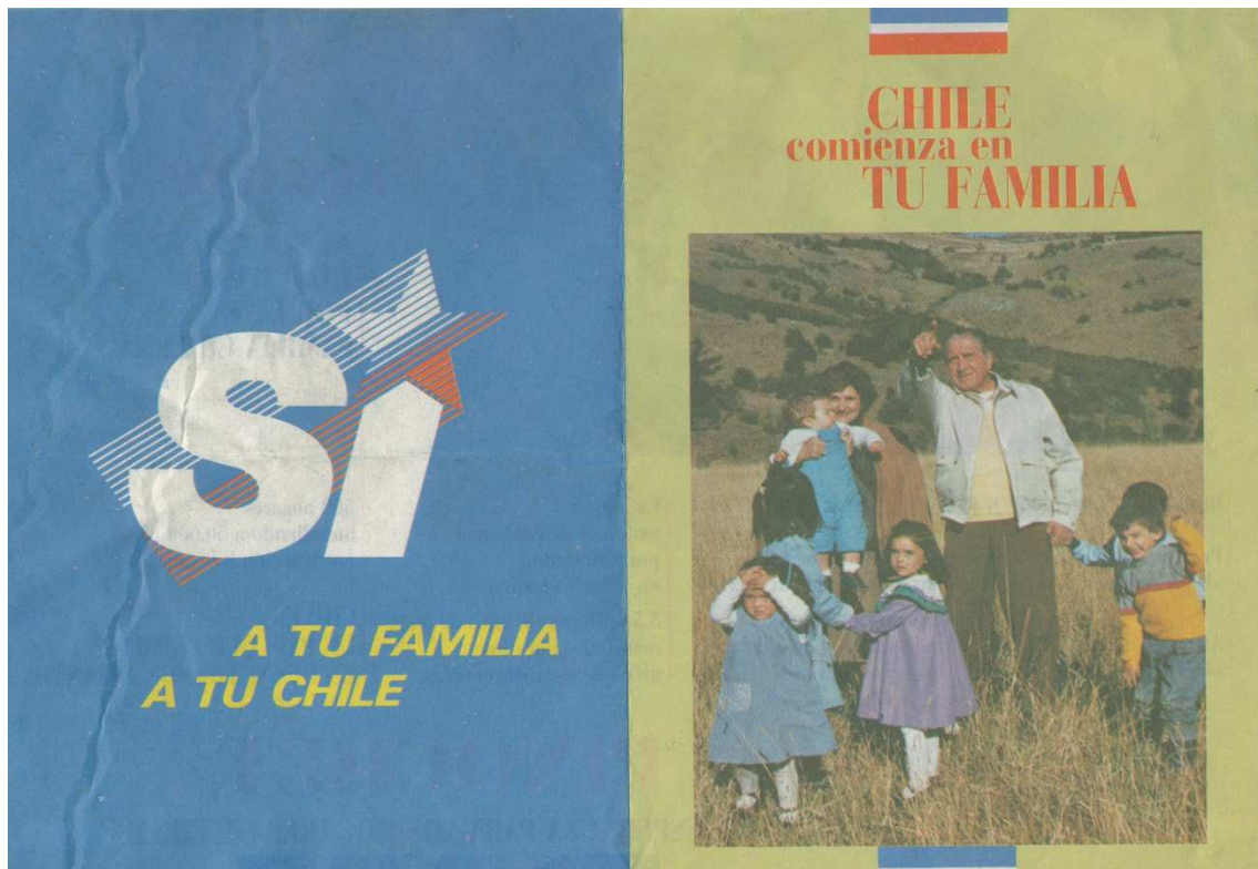
Figura 5 Panfleto da campanha do SI

Disponível em http://en.wikipedia.org/wiki/Chilean_national_plebiscite,_1988 Acesso 12/11/2014