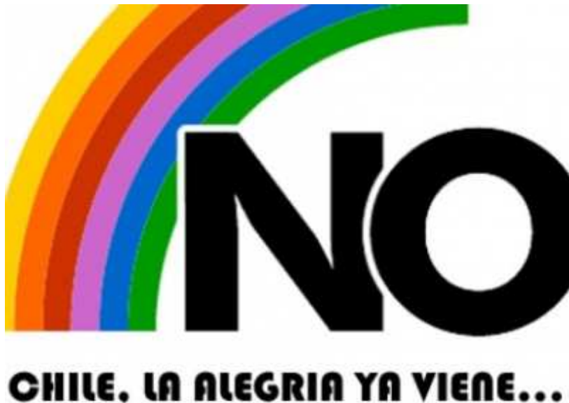
Figura 7 Logo da campanha de oposição a Pinochet

Disponível em http://www.espaciomural.com.ar/chile-la-alegria-ya-viene/ Acesso 12/11/2014