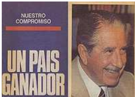
Figura 6 A imagem que publicitários do SI queriam de Pinochet

Disponível em http://www.cooperativa.cl/noticias/pais/politica/5-de-octubre/este-jueves-chile-recuerda-los-18-anos-del-triunfo-del-no/2006-10-04/202727.html Acesso 12/11/2014