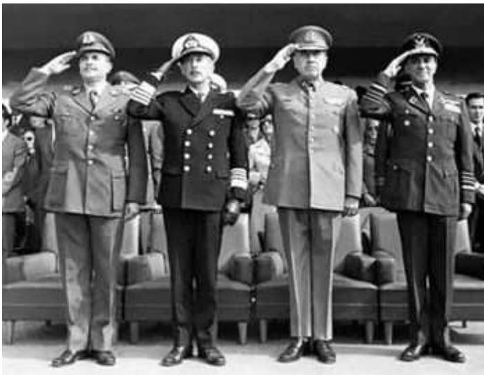
Figura 1 Junta Militar Chilena. Da esquerda para a direita: César Mendoza, José Toríbio, Augusto Pinochet e Gustavo Leigh

Disponível em http://www.lapala.cl/2013/pinochet-y-sus-tres-generales-documental-espanolfrances-2004-entrevistas-exclusivas-a-la-junta-de-gobierno Acesso 12 nov 2014