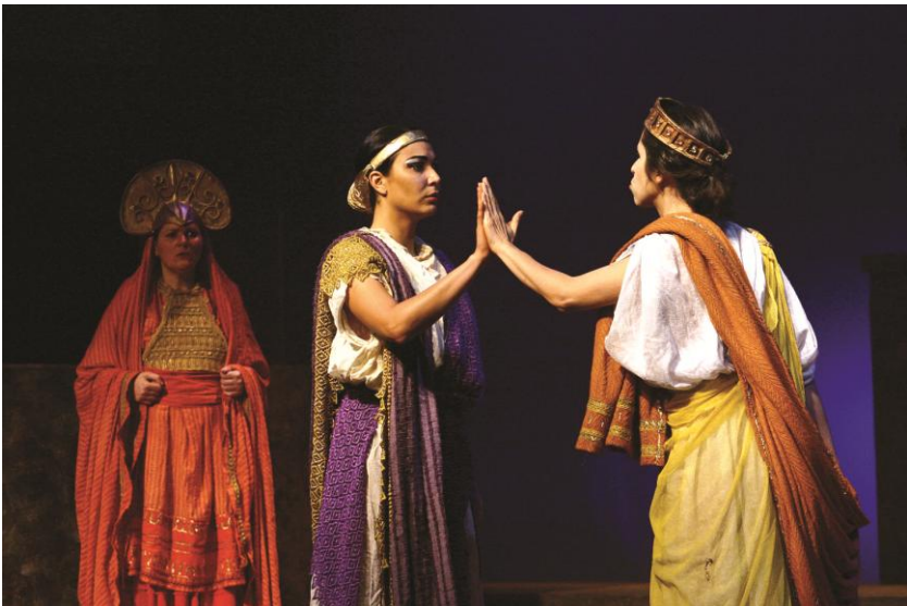
Figuras 1 e 2