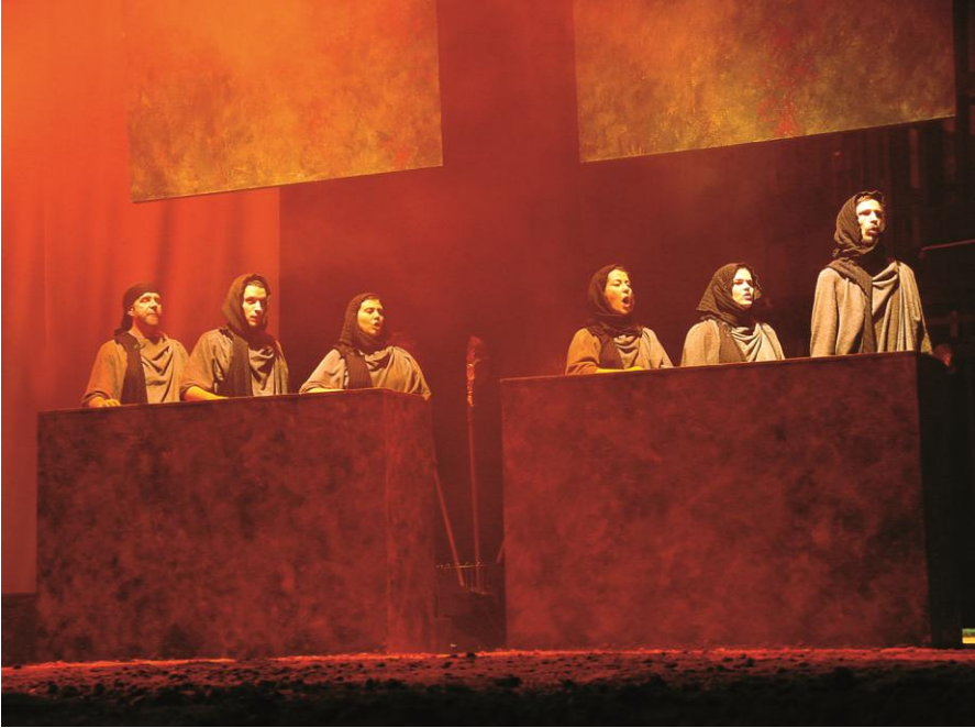
Figuras 5 e 6