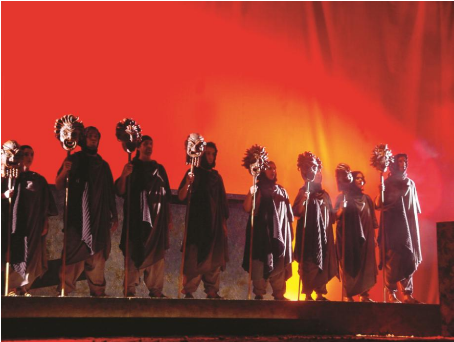
Figuras 3 e 4