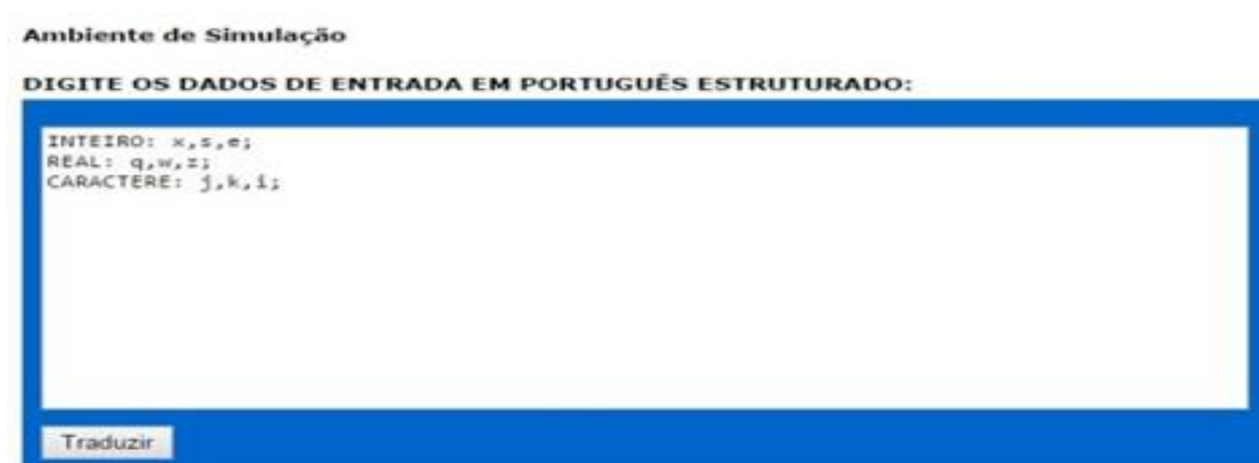
Figura 3 – Dados traduzidos para a linguagem C