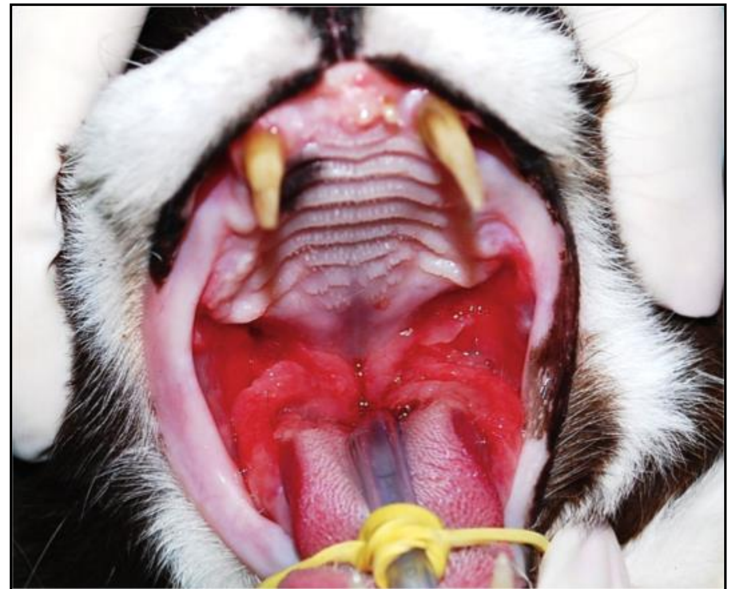
Figura 1 – Felino, cavidade oral. Acentuada gengivoestomatite (grau 4) associada a intensa proliferação e ulceração da mucosa oral, coloração vermelho intenso, friável, difusamente distribuída no arco palatal e estendendo-se até a base lateral da língua, dentes molares e pré-molares extraídos em procedimento cirúrgico anterior.