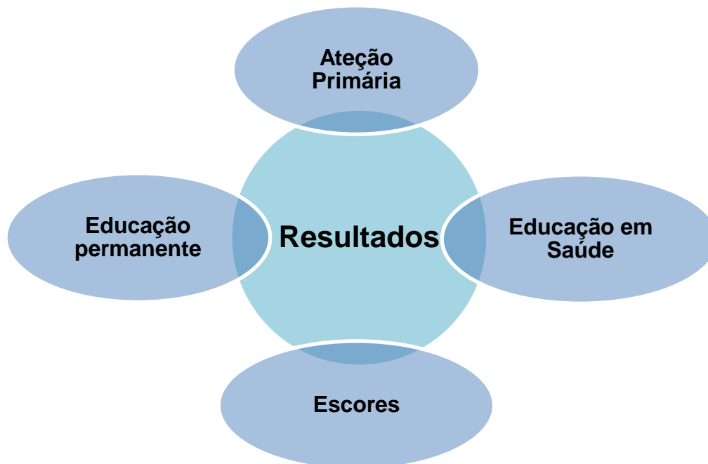
Figura 1 Expressões que apareceram nos resultados dos estudos analisados