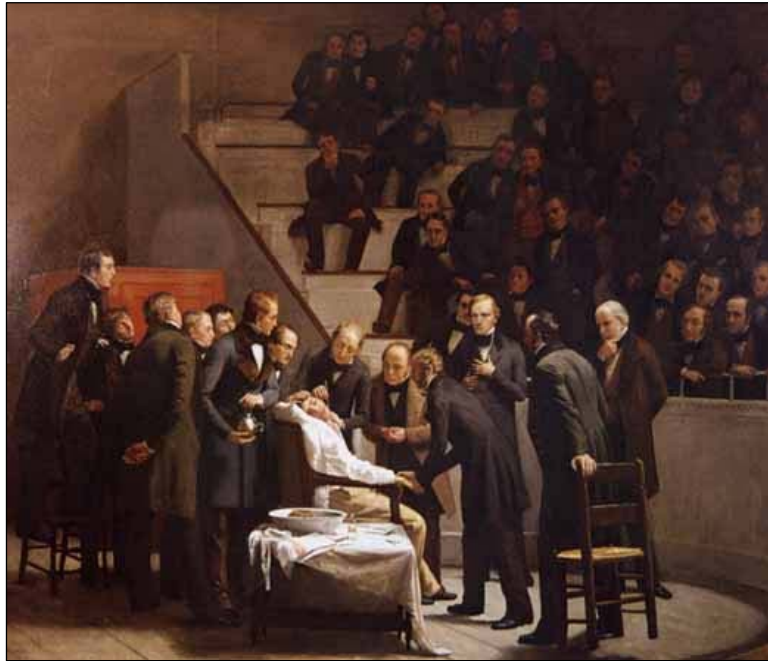
Figura 5 - A Primeira Demonstração Pública de Anestesia - realizada por William Thomas Green Morton, 1846.

Em meados do século XIX, foram inventados diversos aparelhos e técnicas com a finalidade de diagnosticar e tratar as doenças, iniciando-se também o uso de substâncias, como o éter, para diminuir a dor durante o procedimento cirúrgico (Figura 5).