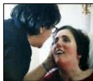
Figura 6 – Terri Schiavo

Outra situação que mobilizou a mídia impressa ocorreu em São Paulo, no ano de 2005, em que o pai de Jhéck (um menino de quatro anos) queria pedir à Justiça a eutanásia do filho.