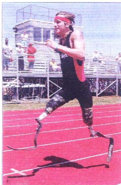
Figura 9 - Prótese