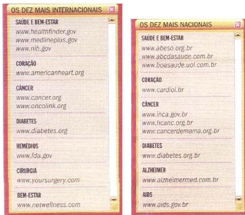
Figura 14 – Lista de sites.

A articulação de estratégias direcionadas à “autonomia” do sujeito e ao biopoder fez com que houvesse um aumento dos cuidados de si em relação à saúde. O biopoder engendra o nosso cotidiano e vida através da naturalização de suas estratégias e, por que não dizer, da universalização dos cuidados com a saúde. Hoje algumas opções, como a de ser sedentário ou fumante, entre outros comportamentos, caracterizam a nova categoria denominada comportamento pessoal de risco. As pessoas que optam por manter essas práticas ou “vícios” são vistas como descuidadas e desleixadas com relação a si mesmas. Nesse entendimento, é possível dizer que o biopoder visa à administração e regulamentação da vida da população, interferindo nas possíveis escolhas dos sujeitos e nos modos de viver vistos como saudáveis ou não – ou seja, na sociedade, se aprendem formas de ser saudável e de ser doente. Segundo Sibilia (2003), a naturalização do biopoder foi sendo construída ao longo da história, ocorrendo, assim, a incorporação do controle 20 e gerando menos resistências