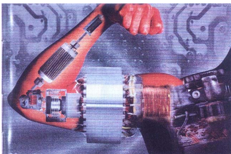
Figura 10 - Corpo-máquina

Um outro exemplo de superação do orgânico relacionado à origem da vida, que já se tornou procedimento de rotina nos consultórios médicos, vem a ser a fertilização in vitro . Essa tecnologia garante que as mulheres com problemas de fertilidade possam gerar filhos. Esse foi o tema da reportagem intitulada “Agora sem hormônios” (Bergamo, 2005b), que fala de uma técnica de fertilização em que a maturação e a fecundação de óvulos ocorrem fora do corpo da mulher. Segundo a reportagem, a medicina reprodutiva tornou-se uma das áreas que mais evoluíram nos últimos anos, atendendo, talvez, à lógica de fazer viver, como é apontado por esta imagem trazida pela reportagem (Figura 11).