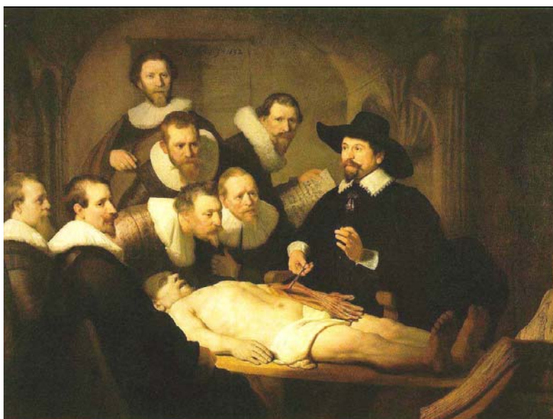
Figura 2 - A lição de Anatomia do Dr. Tulp.

Com relação às dissecações e observações, abro um parêntese para o estudo de Kruse, que destaca em sua tese a importância dada ao corpo como objeto de estudo da anatomia, trazendo o exemplo de quadros e pintores, principalmente dos séculos XVI e XVII (Kruse, 2003). Os quadros guardavam as cenas de dissecação dos corpos para que fosse possível pensar nelas. Outro ponto a destacar é o fato de mostrarem a aliança estabelecida entre a ciência e a arte, que é exemplificada na Figura 2: