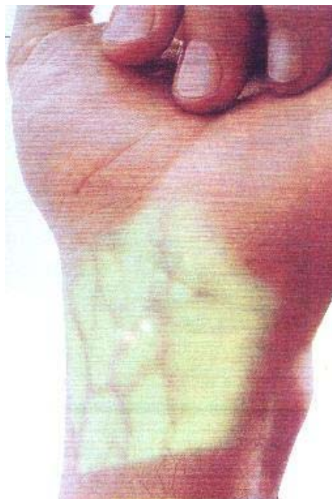
Figura 4 - Mapa da vascularização superficial.