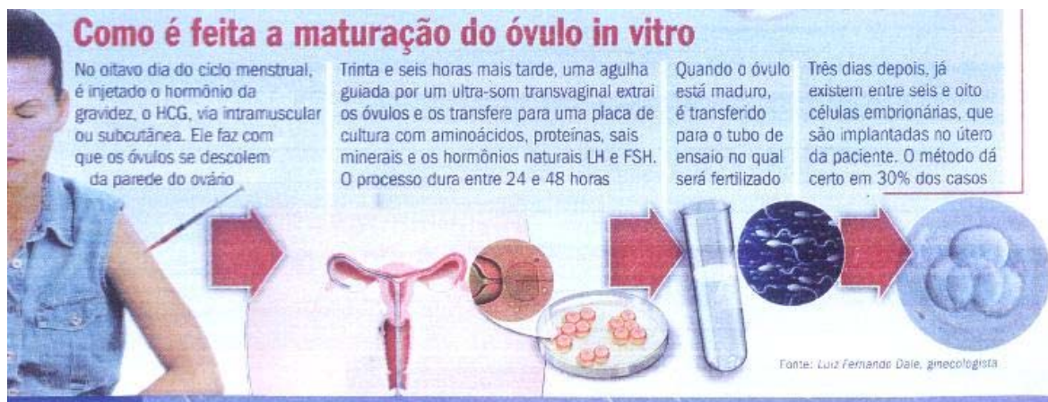
Figura 11 – Técnica de maturação do óvulo.