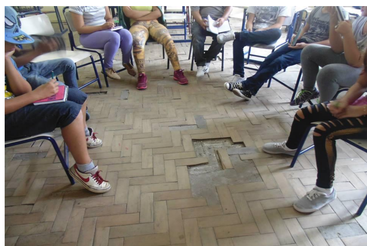
Foto 3 - Alunos jogando DETETIVE

Durante as aulas foram utilizados diferentes métodos de ensino e recursos didáticos como: aulas práticas, vídeos e documentários, construção de maquetes, uso de jogos pedagógicos e aulas expositivo-dialogadas com uso de imagens montadas no PowerPoint.