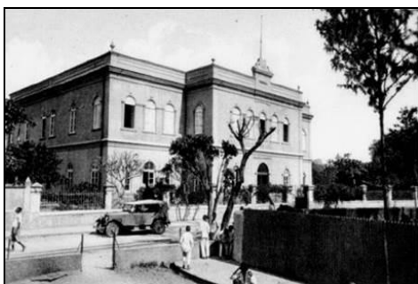
Figuras 3 e 4 – Edifício do Conselho Municipal e Casa Oswald Hoffmann

De acordo com observações efetuadas no terreno, em harmonia com as fontes anteriormente citadas, os calmos bairros do município (vide o mapa) consistem principalmente em casas antigas (Fig. 4) construídas durante os tempos coloniais, muitas delas em decadência, ainda que algumas, como o edifício do Conselho Municipal (Fig. 3), já tenham sido restauradas e mostrem de novo o seu velho esplendor. A cidade foi generosamente construída com espaçosas ruas alcatroadas, varias praças e pequenos parques. O animado centro da cidade concentra-se em redor do mercado central, que é localizado num edifício antigo muito bonito.