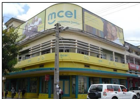
Figuras 5 e 6 – Casa Jeta e Casa Damião de Melo