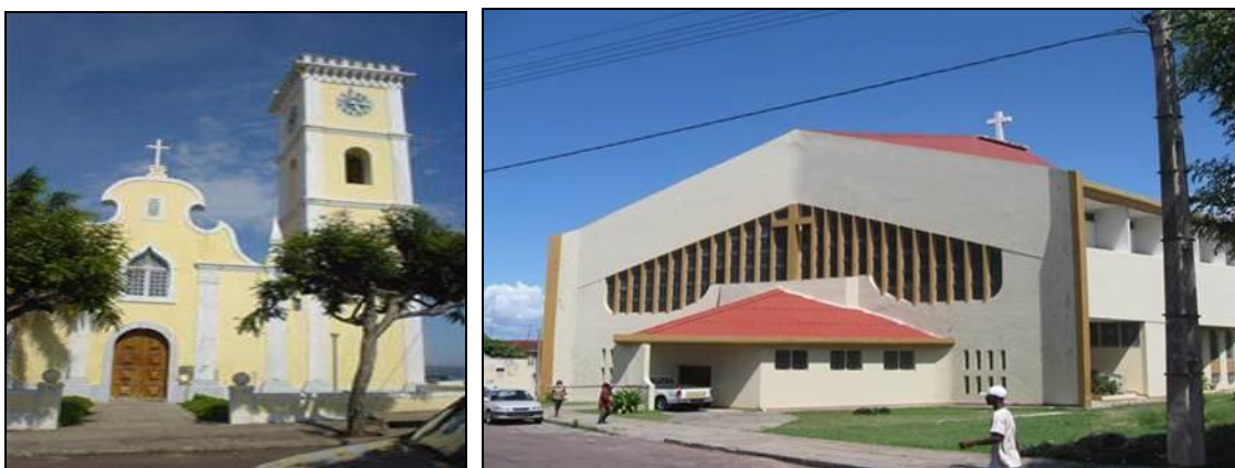
Figuras 7 e 8 – Igreja Velha e Igreja Nova (Nossa Senhora da Conceição)