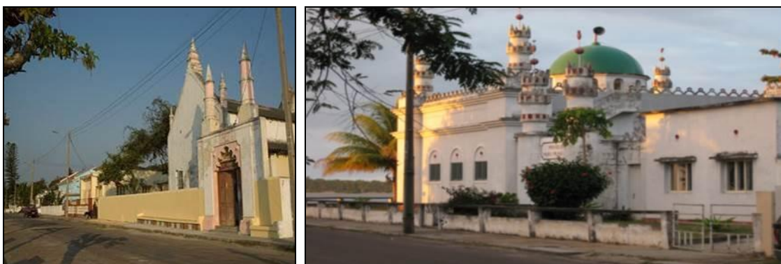
Figuras 9 e 10 – Mesquita Velha e Mesquita Nova (Nur Muhammad).