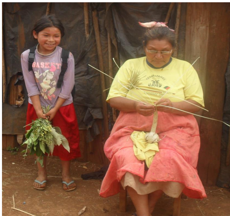
Mãe da Linha Bananeira.

ocorre em tarefas rotineiras, como a busca de materiais no mato. Durante o caminho as crianças brincam, conversam entre si e com as pessoas mais velhas que os acompanham. Nessas conversas, aprendem sobre as plantas e suas funções dentro da tradição kaingang. A prática das mães é ensinar as crianças sobre as plantas, além de outros acontecimentos, durante a caminhada no mato. As atividades que acontecem após as colheitas do material, como a confecção dos artesanatos ou dos seus utensílios, podem ser chamadas de Pedagogia Kaingang. Como mostra a foto abaixo, uma mãe na confecção de um trançado para fazer um chapéu, e o olhar atento da criança.