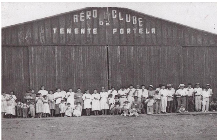
Hangar onde aconteciam as aulas