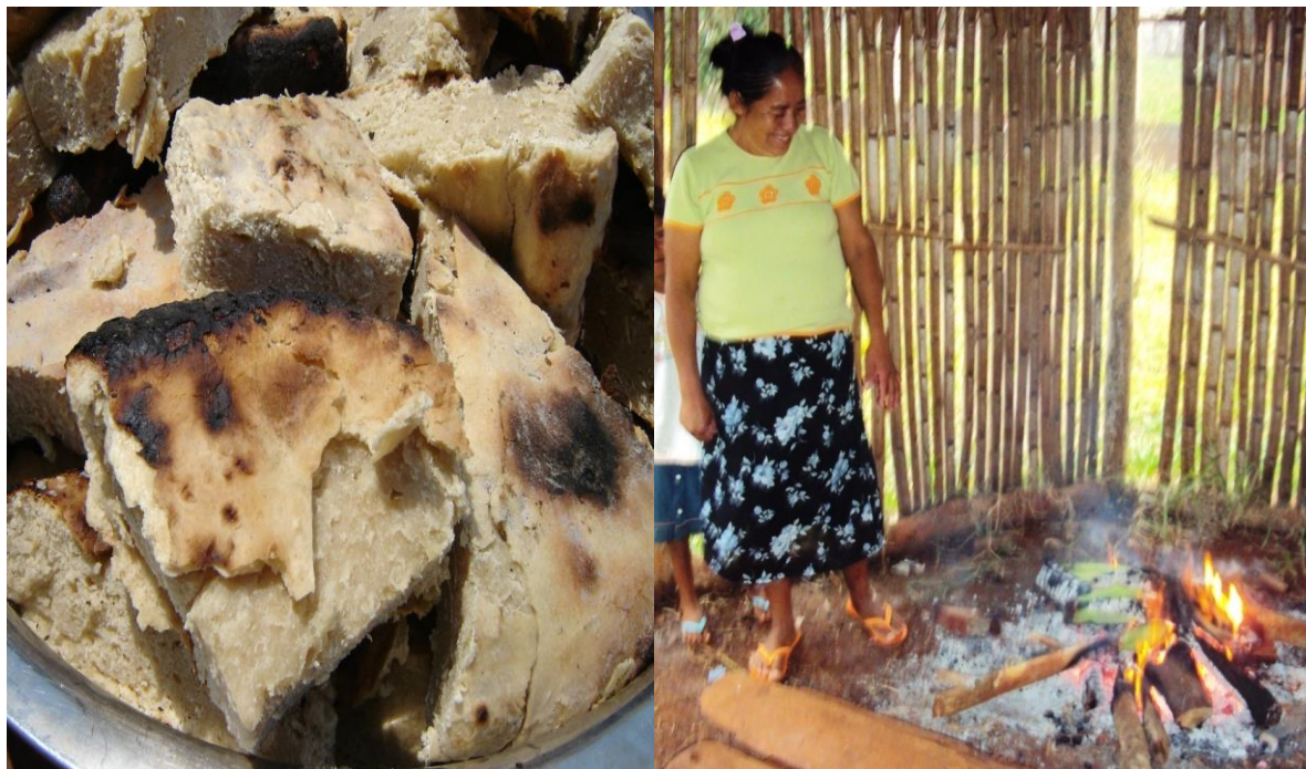
Fazendo o bolo assado na cinza

Essas atividades, apesar das mudanças ocorridas, estão muito presentes no dia a dia dos Kaingang. Então, a resignificação dos espaços também mostra que existe um fortalecimento no modo de ser Kaingang e que de uma forma outra, está sendo repassado às novas gerações. Isso também fica evidente nas atitudes das famílias Kaingang mais tradicionais ou mais velhas, onde as pessoas são recebidas desta forma, qual seja, com a fartura de comidas.