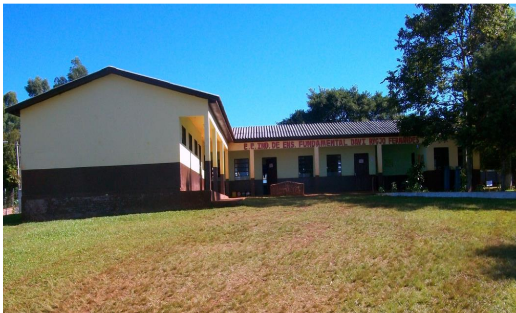
Escola Estadual Indígena Davi Rygjo Fernandes – Foto: Bruno Ferreira

A escola que descrevo aqui fica aproximadamente a um quilômetro da vila São João, distrito do município de Redentora. Logo atrás tem o posto de saúde, que atende as pessoas da comunidade e, nesse sentido, parece estar demarcando um espaço do Estado, onde trabalham pessoas indígenas e não indígenas. A Escola atualmente possui 260 alunos. Esses têm como primeira língua o kaingang e o português como segunda. A escola possui ainda 16 professores, sendo 6 Kaingang e 10 não indígenas. Tem uma diretora e uma vice não indígena, sendo que um vice-diretor é um professor Kaingang. Tem ainda duas pessoas não indígenas que fazem apoio pedagógico aos professores e uma secretária também não indígena. Os professores indígenas trabalham com os anos iniciais e as disciplinas de Artesanato, Valores Culturais e Kaingang. Estes componentes curriculares são ministrados por professores indígenas que ainda fazem a alfabetização na língua originária, até o terceiro ano. A partir daí inicia-se o ensino em português, antes oral e depois escrito. Os demais professores não indígenas trabalham com os anos finais, quando é usada de maneira mais intensa a língua portuguesa.