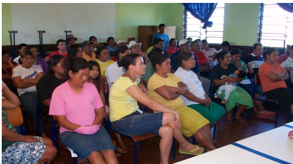
Reunião de mães e pais

Uma atividade que presenciei nessa escola foi a realização de trabalhos com projetos, onde os professores se organizaram em grupos de pesquisa por áreas de conhecimento, desenvolvendo várias atividades de pesquisa na comunidade indígena da Missão. Um dos objetivos desse trabalho foi conhecer melhor o lugar onde estão trabalhando. Esses grupos pesquisaram a história, a medicina/plantas, o meio ambiente e assim por diante. Isso aproximou muito a escola e a comunidade. Tais atividades também são resultados de conversas com os pais e as mães em reunião.