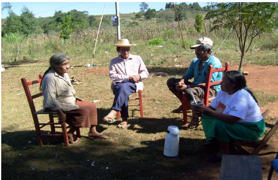
Kofá - Foto: Bruno Ferreira

Esses são momentos muito ricos e importantes que podemos realizar em nossas pesquisas, pois acredito que trabalhar com pessoas vivas é muito mais saudável e verdadeiro. Uma conversa como mostra a foto acima, permite a essas pessoas uma verdadeira viagem pela história de seu povo, costumes, tradições, seus modos de relacionamento com as demais pessoas em épocas diferentes. Isso permite a construção contínua dos seus processos de conhecimentos baseada na visão de conjunto da cultura, pois a educação Kaingang nunca vai estar separada, como é em geral a organização de uma escola não indígena.