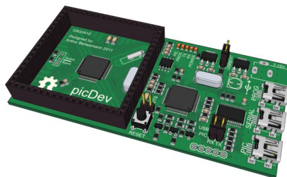
Figura 2. Placa de desenvolvimento para microcontroladores.

Para ler os sinais de todos os sensores e ainda formar um link de comunicação com um computador foi projetada e desenvolvida uma placa composta por um microcontrolador (Microchip 16 bits). A placa é composta por um programador on board , o que facilita a sua aplicação e além disso apresenta todas as funcionalidades do hardware disponíveis por meio de um conector. (Figura 2)