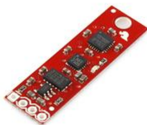
Figura 1. Hardware utilizado para a unidade inercial.

Este trabalho tem como objetivo desenvolver um sistema de navegação inercial utilizando sensores de baixo custo do tipo MEMS. Um conjunto de 3 sensores tri-axiais formam a Unidade de Medidas Inerciais (Inertial Measurement Unit), estes sensores são um acelerômetro, um giroscópio e um magnetômetro. A princípio, a unidade formada por esses sensores é capaz de medir qualquer movimento de um corpo no mesmo sistema inercial, se os erros devido a influência de variáveis espúrias puderem ser compensados. O conjunto de sensores é apresentado na Figura 1.