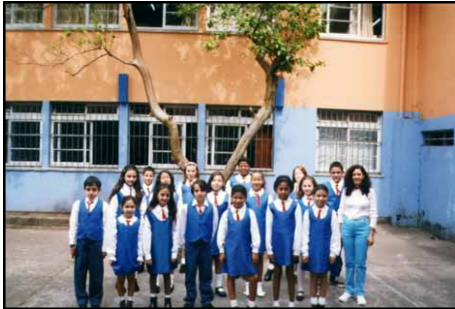
Coral da Escola A