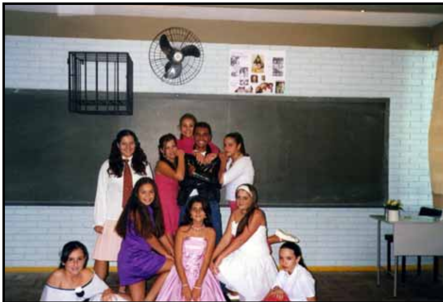
Grupo "Splash", da Escola G