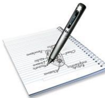
Figura 2 - Caneta leitora Fonte: Revista Nova Escola, março de 2012.

- canetas leitoras, indicadas para disléxicos, pois os dispositivos leem documentos, que ficam arquivados por escrito e em áudio e armazenam o texto redigido pelo aluno (figura 2),