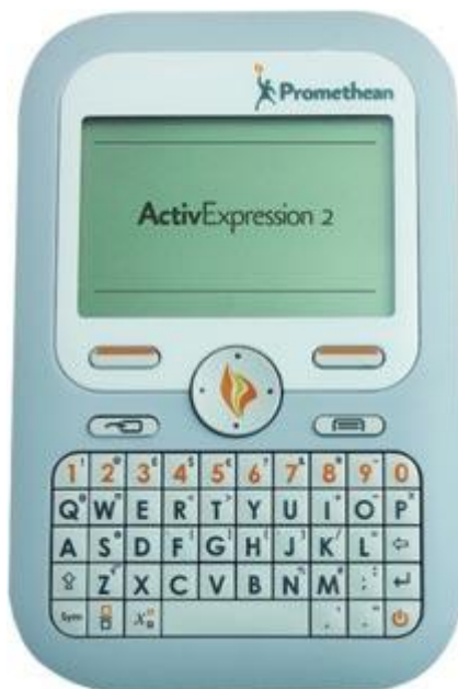
Figura 3 - Dispositivo de respostas