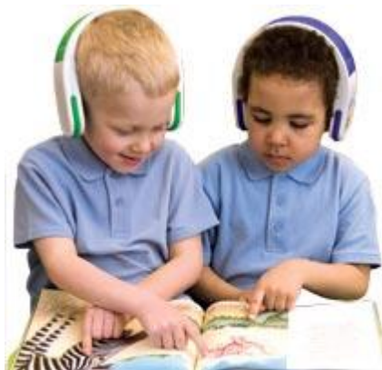
Figura 1 - MP3 para leitura

- MP3 para leitura com fones de ouvido que vêm com histórias, músicas e jogos de palavras para as crianças (figura 1),