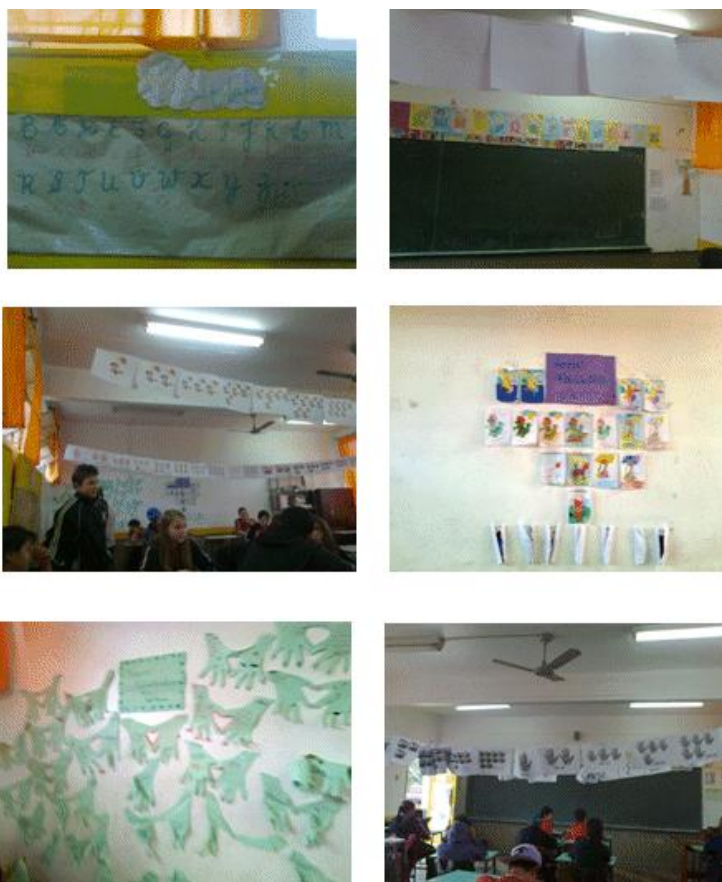
Figura 5 - Sala de aula ambientada para o currículo, sendo utilizada pela área

Para esta escola, a solução seria uma pesquisa sobre como funciona a mudança de salas de aula não ambientadas para as salas com ambientação, uma vez que fica sob a responsabilidade do professor e seus alunos a tematização do ambiente, não onerando em nada à Escola.