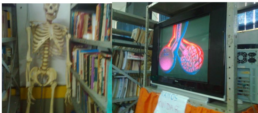
Figura 9 - Materiais para estudo de ciência dispostos na biblioteca

A Escola E (figura 9) não utiliza salas ambientadas e nem possui laboratório de ciências. O esqueleto encontra-se na biblioteca assim como a televisão com o vídeo.