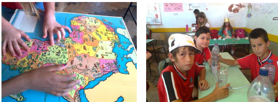
Figura 8 - Alunos do currículo interagindo com os materiais disponíveis

A Escola E (figura 9) não utiliza salas ambientadas e nem possui laboratório de ciências. O esqueleto encontra-se na biblioteca assim como a televisão com o vídeo.