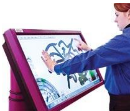
Figura 4 - Monitor inclusivo

- monitor inclusivo com tela digital e sensível ao toque que possibilita a participação do estudante com baixa visão ou dificuldade de movimentos nas atividades proposta em aula (figura 4),